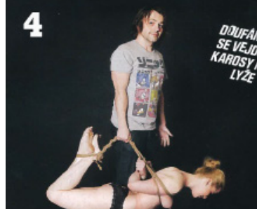
Žena je sbalená na cestu. Stihnete to i vy do patnácti minut?