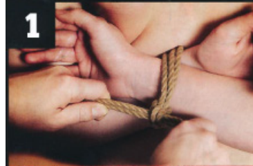
Dvojtým jutovým provazem svážeme k sobě zápěstí.

Berete holku na hory a je málo místa v autě? Čtete návod!