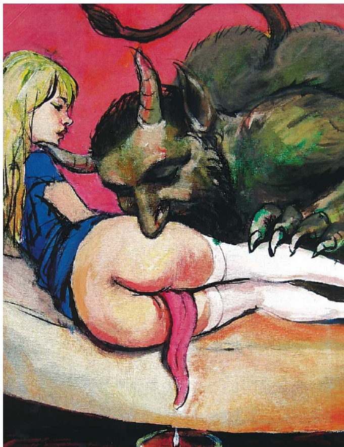
Obrázek 2: „Stuart Mead je v Berlíně usazený americký undergroundový malíř, jehož tvorba se často točí kolem tématu děvčátek v různých perversních situacích“ („Nahota ve vazbě“, Maxim, č. 10, s. 59).