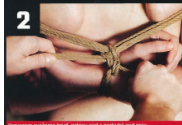
Provazem ovážeme hrud', jednou nad a podruhé pod prsy.