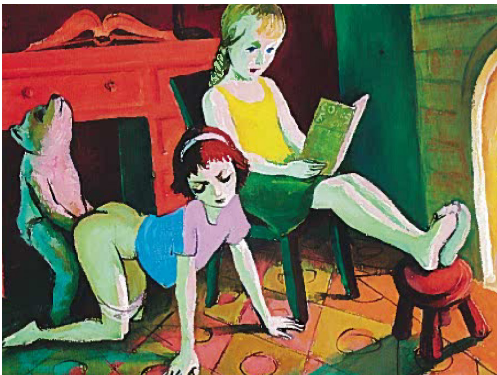
Obrázek 1 „... sexualita může dospívajícím dívkám dodat moc nad druhými, podobně jako v románu Lolita“ („Nahota ve vazbě“, Maxim, č. 10, s. 59).