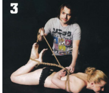
K zápěstí přivážeme nohy. Nakonec vyrobíme držadlo jako u balíku, aby se dobře nesla a nezařezávala se vám do dlaně.