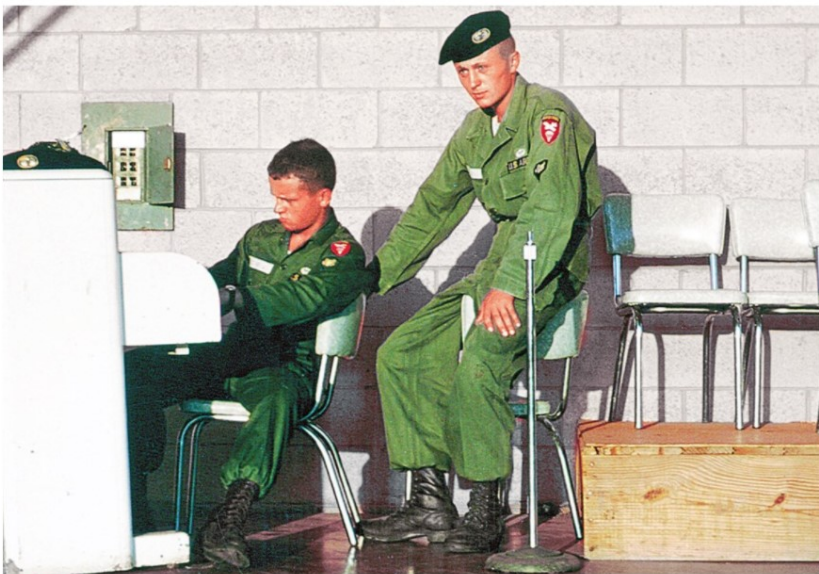
Bratři Mašínové v americké základně Fort Bragg v 50. letech. Josef Mašín u piano, vpravo bratr Ctirad.

ROZHOVOR se Ctiradem Mašínem čtěte na stranách 6 a 7