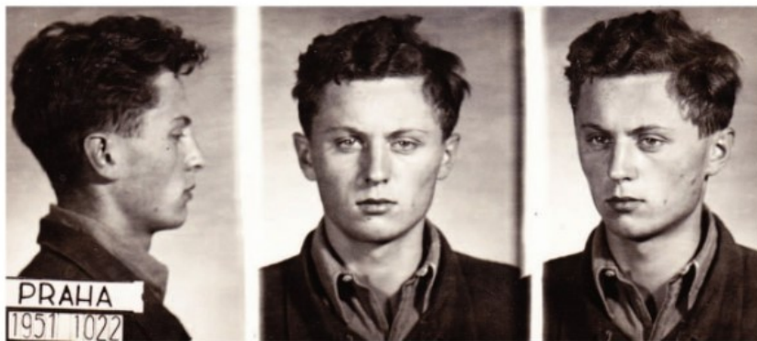
Ctirad Mašín • 11. 8. 1930 † 13. 8. 2011 Odbojář, který se ozbrojen postavil komunistickému režimu, zemřel na leukemii. Foto z vyšetřovacího spisu

V USA zemřel bojovník proti komunismu Ctirad Mašín. Od útěku na Západ v roce 1953 se domů nechtěl vrátit ani po pádu režimu. Česku vyčítal, že se nevypořádalo s komunisty.