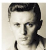
Nedlouho v Americe Mašín se po útoku usadil v USA. Sloužil v armádě a pak podnikal.