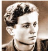
V době svobody Ctirad Mašín v roce 1930.