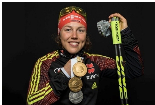
Obrázek 18: Laura Dalhmeierová