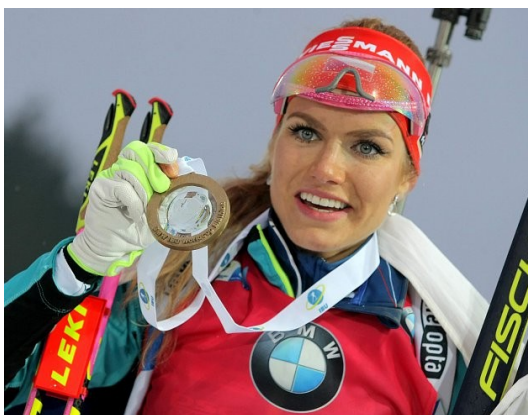
Obrázek 23: Gabriela Koukalová