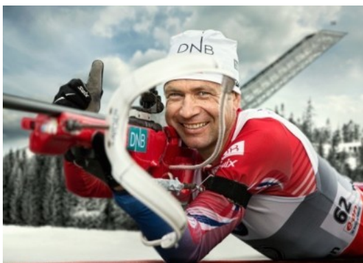
Obrázek 13: Ole Einar Bjoerndalen