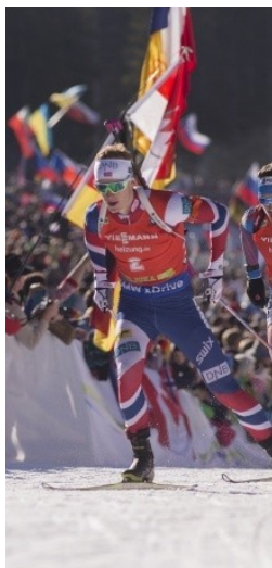
Obrázek 15: Johannes Thingnes Boe