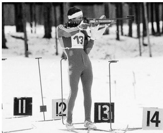
Obrázek 4:Alexandr Tichonov