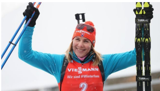
Obrázek 17: Anastasia Kuzminová