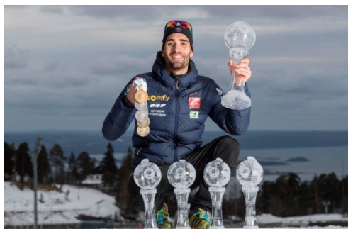
Obrázek 14: Martin Fourcade