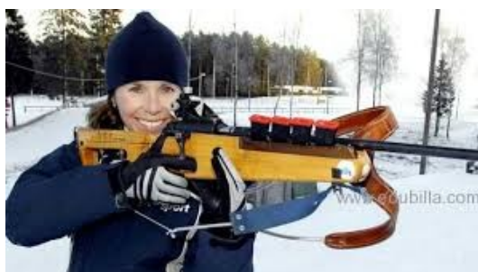
Obrázek 10: Magdalena Forsberg-Wallin