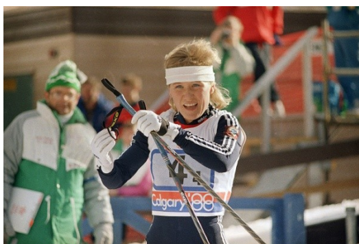
Obrázek 11: Anfissa Restzová