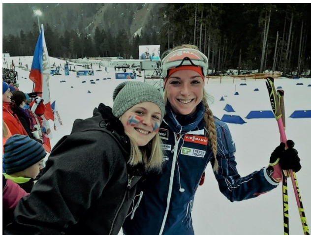
Obrázek 27: Markéta Davidová, Ruhpolding 2018