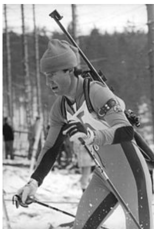
Obrázek 6: Frank Ullrich