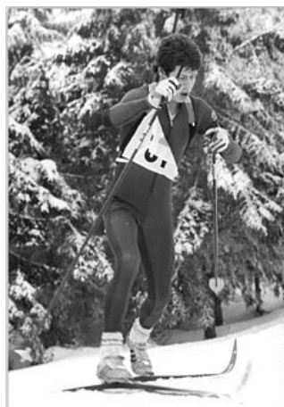
Obrázek 7: Frank Peter Roetsch