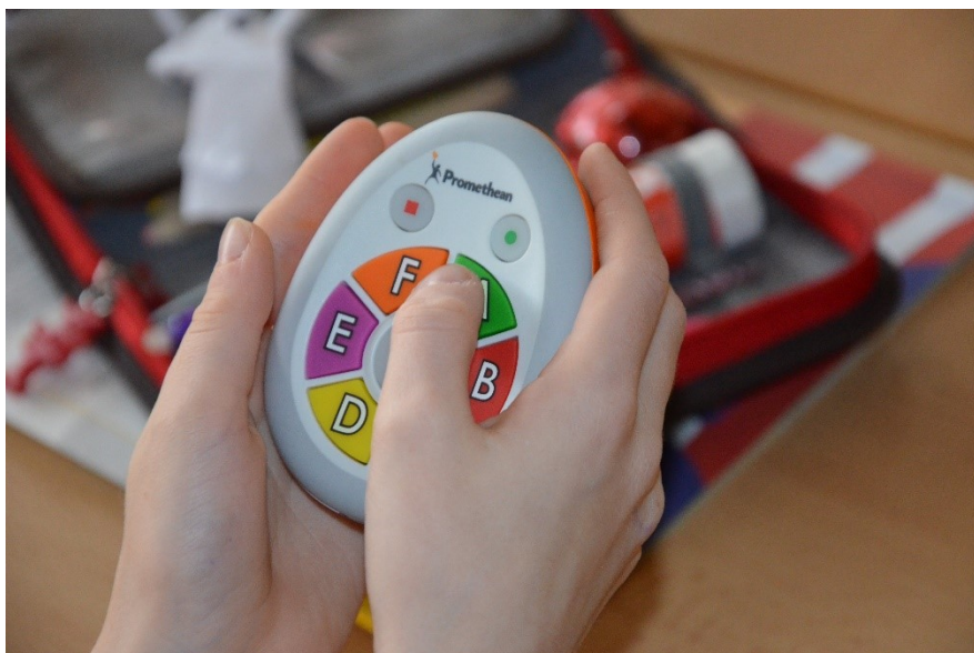
Obrázek 4 - Hlasovací zařízení