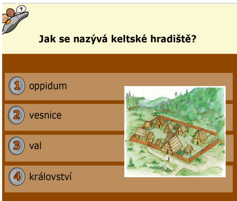
Obrázek 1 – Kvízová otázka vytvořená v Activ Inspire I

10. Jaké překážky/limity vidíte v používání interaktivních elektronických výukových materiálů ve výuce?