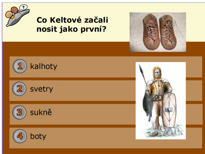
Obrázek 2 - Kvízová otázka vytvořená v Activ Inspire II