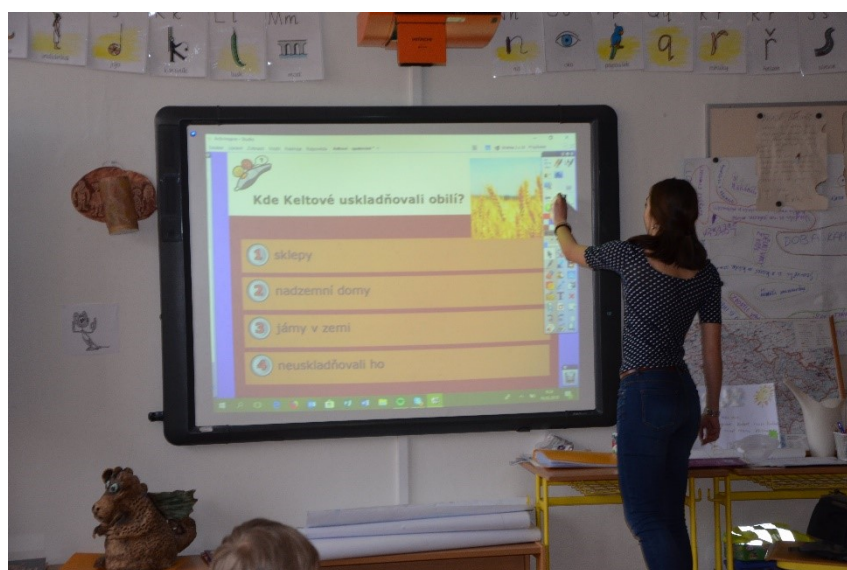
Obrázek 3 - Výuka s použitím hlasovacích zařízení