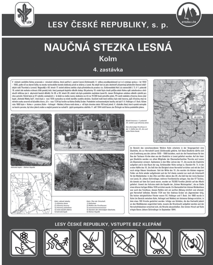
OBR. 5 NS Lesná — příklad panelu s kulturně-historickou tematikou — zaniklá obec Kolm.