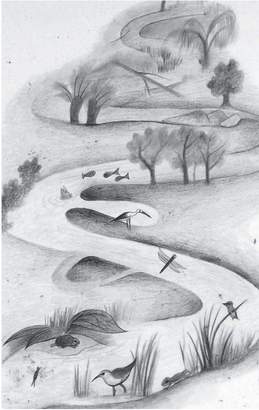
OBR. 3 NS Údolím Šembery — výřez z panelu o říčních meandrech, příklad „veselých kreseb“ — typického stylu ilustrací na této NS (zdroj autoři).

jeho škůdci, odborné grafy, i množství lidí v lese. Ze všech zobrazení lidí se pouze dvakrát objevují ženy. Muži dělají nejrůznější činnosti v lese, role žen je mnohem pasivnější. Jedna z žen je dívka, nejspíše dcera, které otec ukazuje ptáka v letu, druhá je dospělá žena, která pomáhá muži sázet stromky. NS Údolím Šembery má mnohem více obrázků (přehled obrázků dle témat viz Tab. 3), přesto je možné shrnout, že témata přirozené obnovy lesa a zobrazení živých škůdců lesa a jejich stop jsou zastoupeny stejně na obou stezkách, zatímco odborné grafy jsou spíše na stezce šemberské, detaily přírody zase spíše na NS Lesná a práce v lese jsou pouze na NS Údolím Šembery.