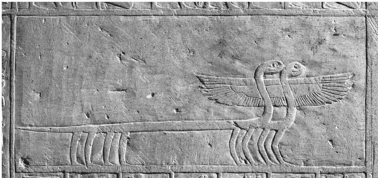
Obr. 2 „Bazilišek“; oblouk západní stěny lufaovy pohřební komory, jižní část / Fig. 2 “The Basilisk”; the arch of the western wall of the burial chamber of lufaa, southern part

Záříciho“ , je to radostný výkřik těchto sedmi bohů, jejichž jména „Ten, jenž přináší svou paži“, zná.