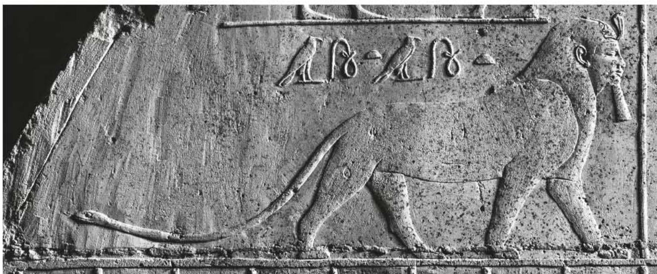
Obr. 8 Tutu; oblouk východní stěny lufaovy pohřební komory, jižní část / Fig. 8 Tutu; the arch of the eastern wall of the burial chamber of Iufaa, southern part

Ten, jenž je v papyrusové houštině Nilu, původce krvavé řeže