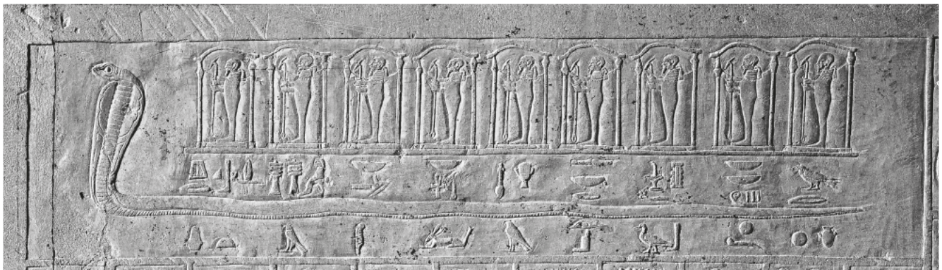
Obr. 4 Had se svatyněmi devíti podob boha Ptaha; oblouk západní stěny lufaovy pohřební komory, severní část (foto M. Frouz) / Fig. 4 A snake carrying nine shrines containing an image of the god Ptah; the arch of the western wall of the burial chamber of lufaa, northern part (photo M. Frouz)

Nachází se v místnosti z (minerálu) sečet, která je 33 333 loktů dlouhá a otevírá se k osmi branám podsvětí.