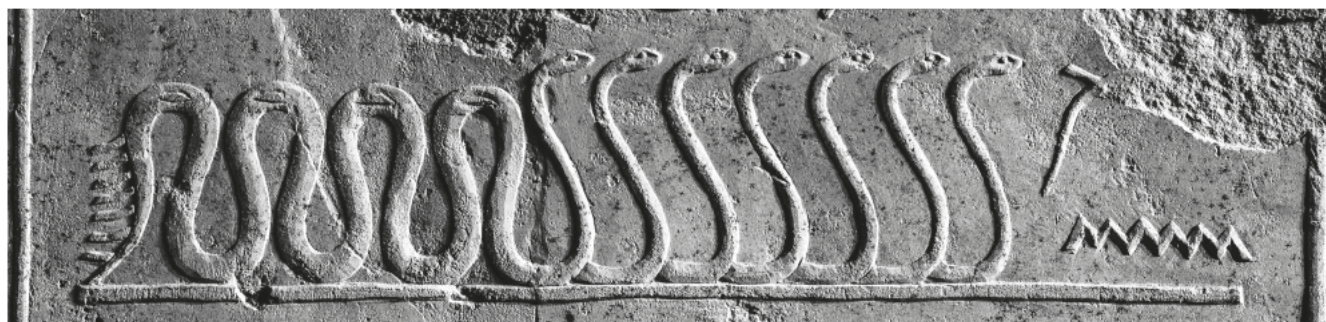
Obr. 7 Mehen; oblouk východní stěny Iufaovy pohřební komory, střed / Fig. 7 Mehen; the arch of the eastern wall of the burial chamber of Iufaa, central part

Iufaova „hadí encyklopedie“ je tedy na jedné straně mytickým protikladem „světské“ příručky kněze-kouzelníka bohyně Selkety a zároveň je také příručkou tajných znalostí, potřebných pro knězovo zasvěcení. 12 Víme tedy,