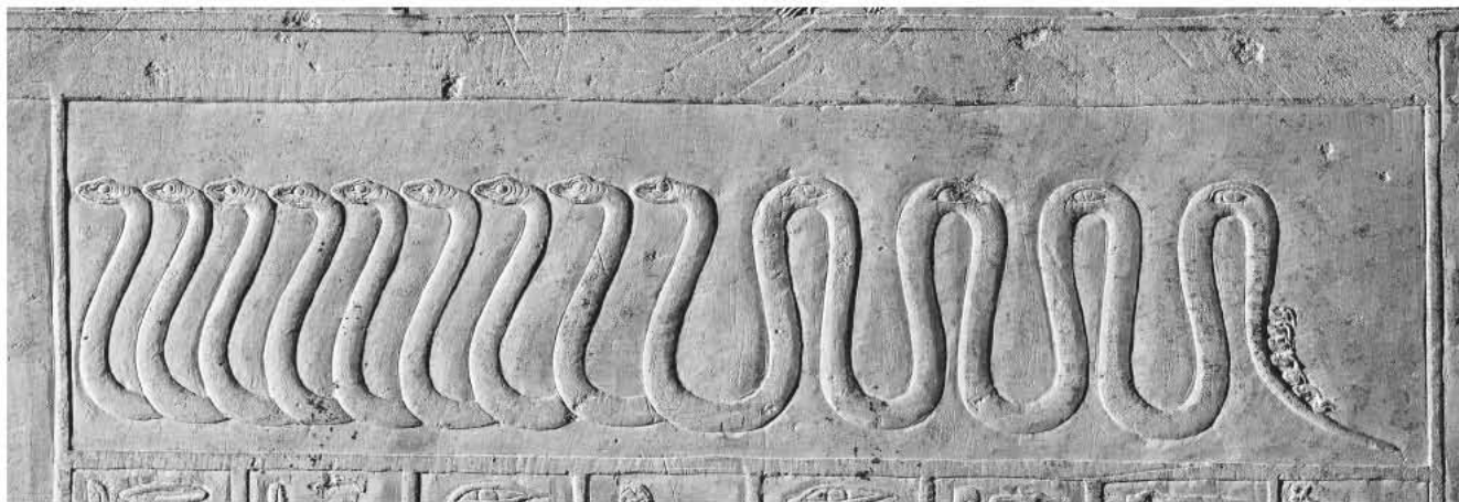
Obr. 5 Devítihlavý had; oblouk západní stěny lufaovy pohřební komory, severní část / Fig. 5 A nine-headed snake; the arch of the western wall of the burial chamber of Iufaa, northern part