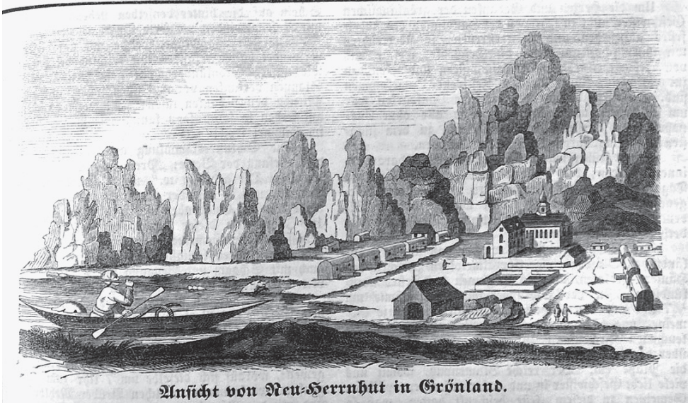
Ansicht von Neu-Herrnhut in Grönland.