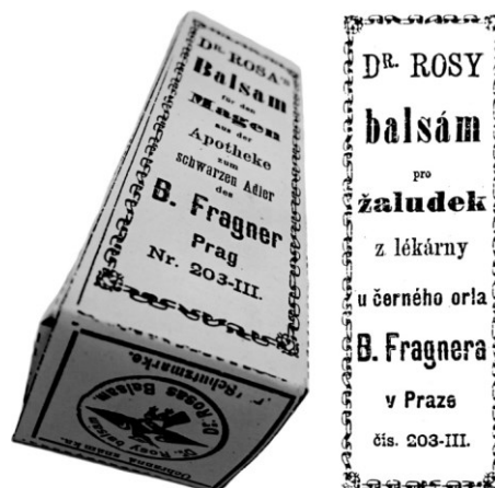
Obrázek 3 – Papírová skládáčka Dr. Rosy balsámu pro žaludek.