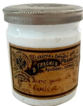
Obrázek 2 – Individuálně vyrobený léčivý přípravek lékárny U Černého orla (1910).