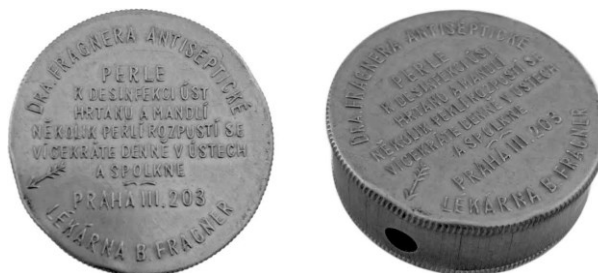
Obrázek 7 – Antiseptické ústní perle.

Perle byly užívány k desinfekci ústní dutiny, zubů, mandlí, hrtanu a dýchacích cest. Dále se používaly také k parfemaci dechu, při chrapotu a na regeneraci hlasivek. Doporučovány byly dětem, které měly problém s kloktáním. 196 Perle byly aromatické, ale nedráždily žaludek. 197