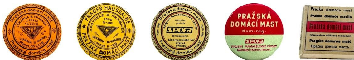
Obrázek 4 – Obaly Pražské domácí masti. Řazeno chronologicky.

Mast měla velké množství indikací jako např. oděrky, spáleniny, drobná poranění. Nanášela se na tzv. měkký klůček (tj. hadřík), přikládala se na postižené místo podle potřeby na 4, 6, 8 nebo 12 hodin. Poté se obklad vyměnil. 164