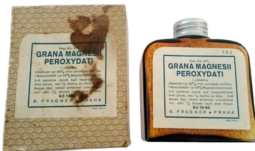
Obrázek 11 – Grana magnesií peroxydati.