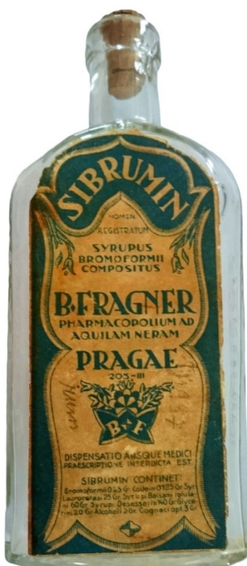
Obrázek 9 – Sibrumin.

Indikace sirupu byly především kašel, černý kašel, bronchitida, zápal plic, laryngitida, záněty horních cest dýchacích a astma. Dávkování bylo 2–6 kávových lžiček za den. 253 Ovšem dávkování Sibruminu, který produkovala již továrna B. Fragner, vypadalo takto: Děti 3–5 kávových lžiček, dospělí pak 3–5 polévkových lžic během 24 hodin, vždy 1–2 hodiny po jídle a před spaním. 254