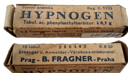
Obrázek 14 – Hypnogen, produkt firmy B. Fragner.