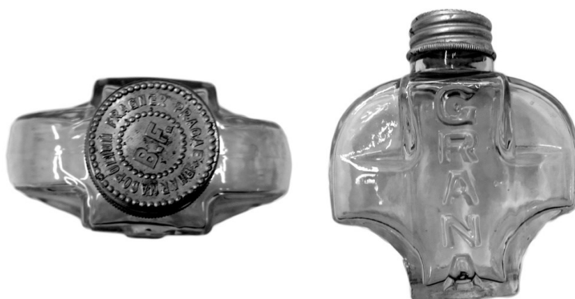
Obrázek 10 – Grana, druh nespecifikován.