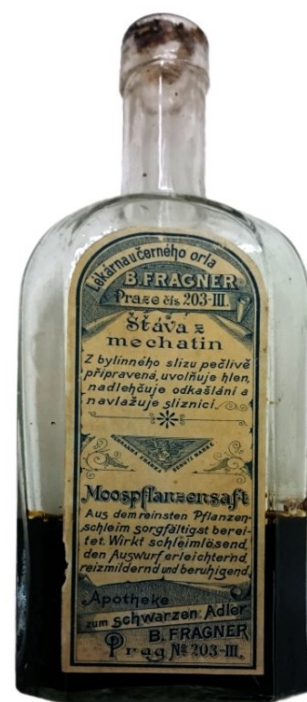
Obrázek 6 – Štáva z mechatin.

Štáva i celtle z mechatin se používaly při nachlazení, kašli, zánětu v krku, chrapotu. Usnadňovaly odkašlávání. Byly doporučovány jak dospělým, tak dětem. Dokonce se doporučovaly v sychravém počasí pro své údajné preventivní účinky před nachlazením. 173