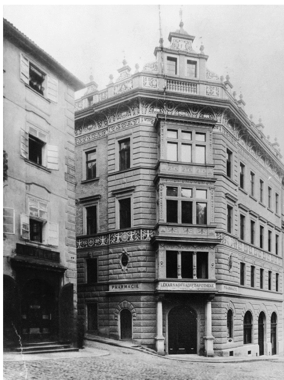
Obrázek 20 – Dům č. p. 203. s lékárnou. Historická fotografie.