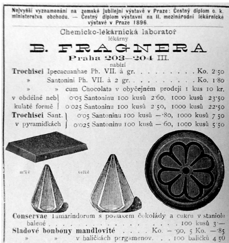
Obrázek 16 – Inzerát Karla Fragnera na cukrovinky (1899).