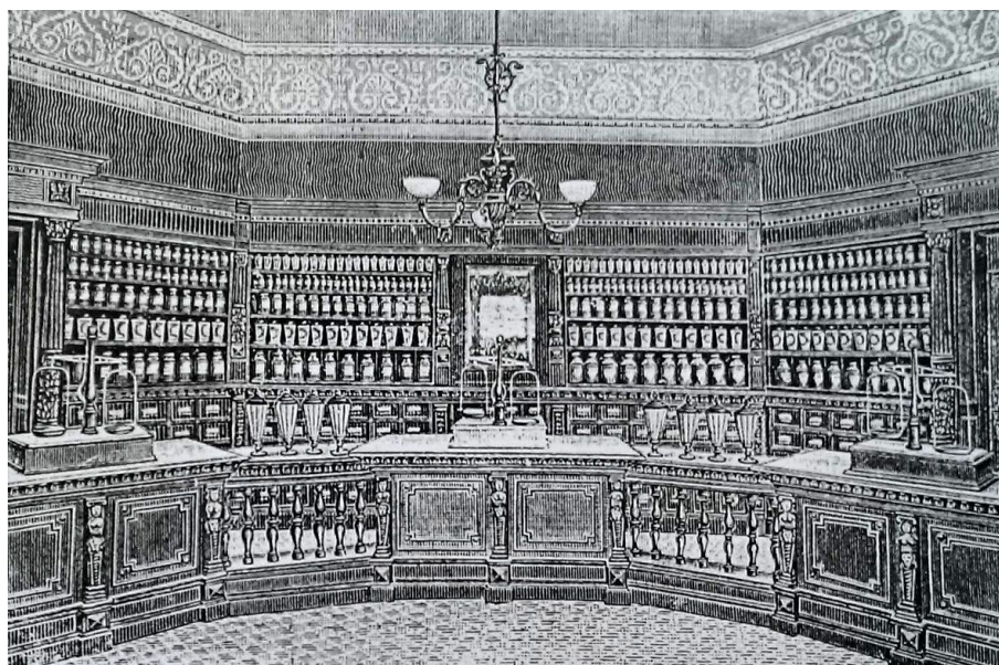
Obrázek 1 – Pohled do oficíny nové lékárny U Čeného orla na Malé Straně (po r. 1889).