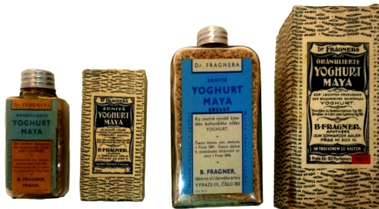
Obrázek 8 – Yoghurt Maya – dvě velikosti balení.

Pro pacienty, u nichž by použití mléka pro přípravu jogurtu bylo nevhodné a mohlo jim způsobit zdravotní obtíže, vyráběl dr. Fragner takzvané Tabletiae Yoghurti. Tyto tablety obsahovaly lactobacily a mléčný cukr. Díky keratinovému obalu byly enterosolventní. Jinak se použitím a indikacemi nelišily od Yoghurtu Maya. 238