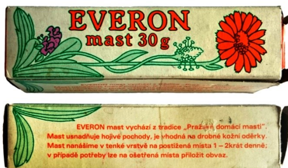
Obrázek 5 – Papírová skládačka Everonu.

Je zajímavé, že produkt zcela odlišný od Pražské domácí masti více než třicet let po ukončení jejího uvádění na trh navazoval na její tradici a zřejmě využíval jejího úspěchu k podpoře svého prodeje.