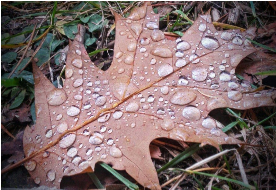
Obrázek 3 V lese, Liběchov