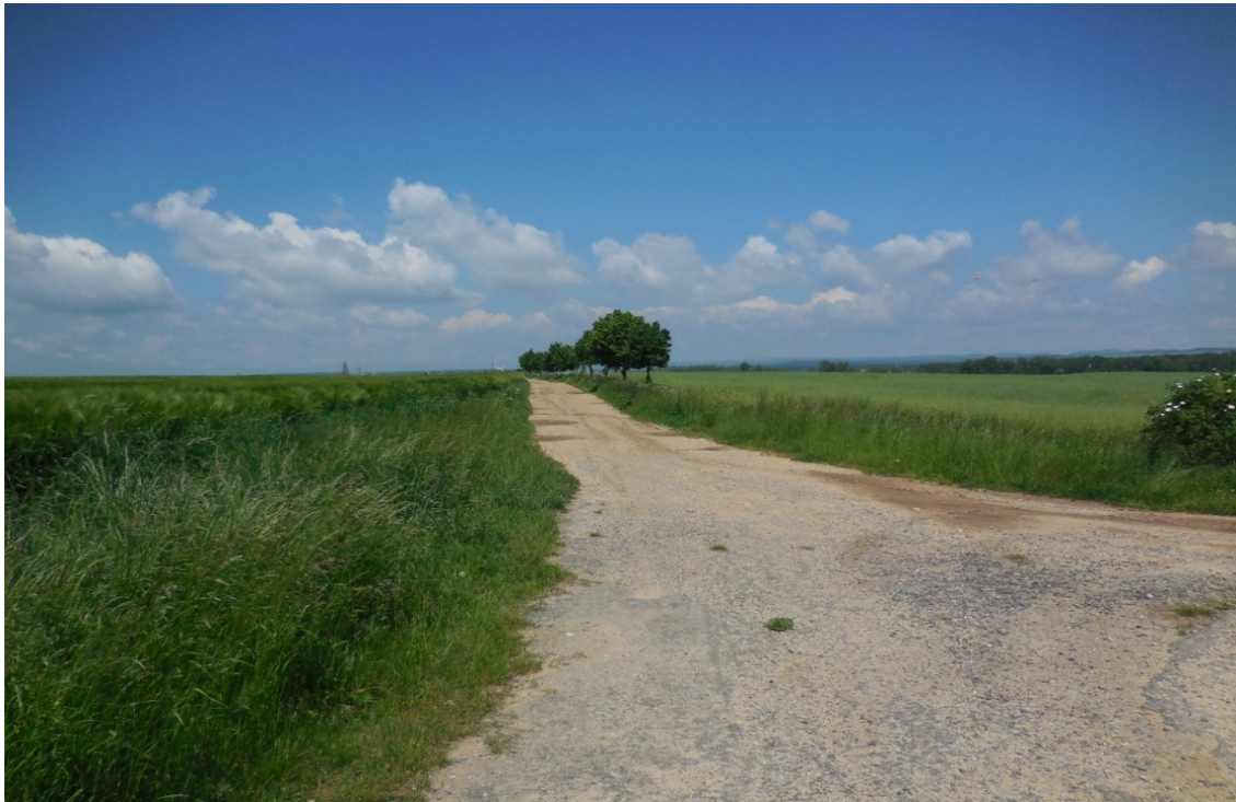
Obrázek 9 Třeboň, Cesta v polích