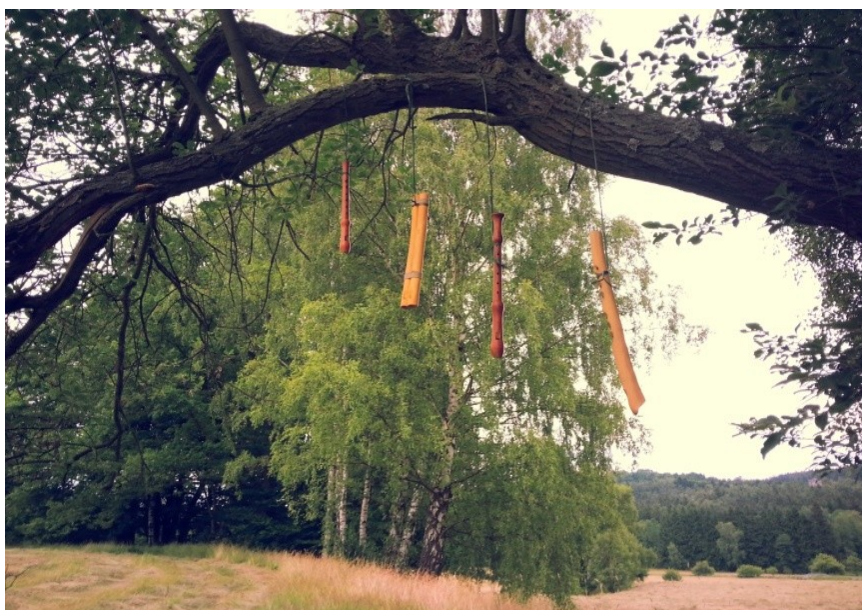
Obrázek 2 Vlašim Moje flétny na stromě