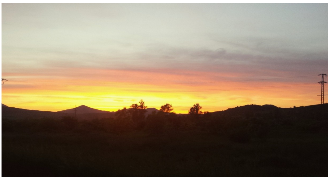
Obrázek 8 České středohoří