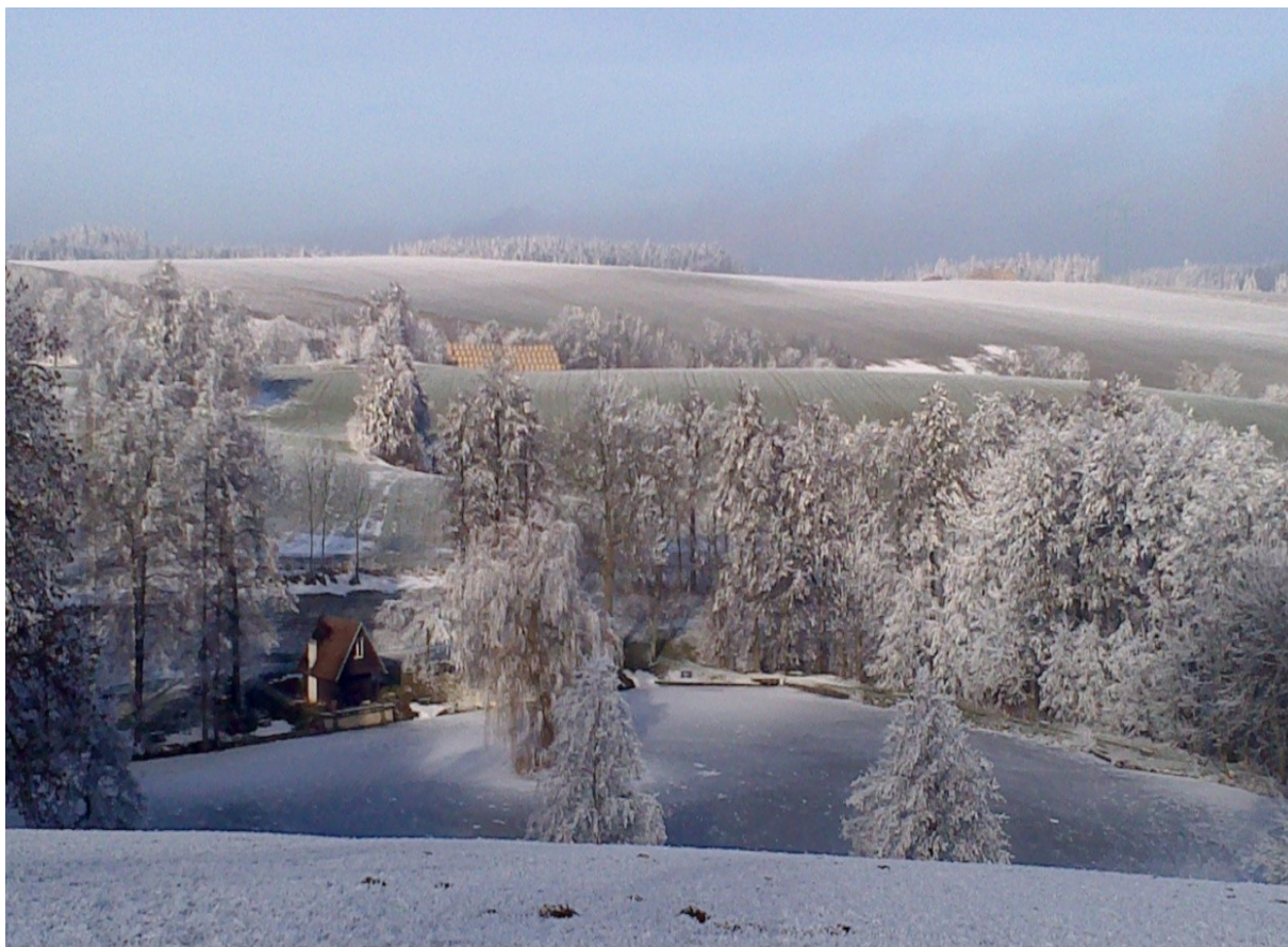
Obrázek 6 Rybník, Bystré u Poličky