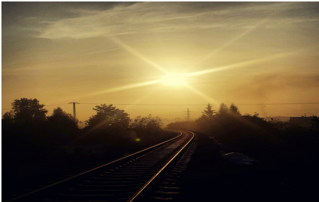
Obrázek 7 Litoměřice, oblouk do neznáma