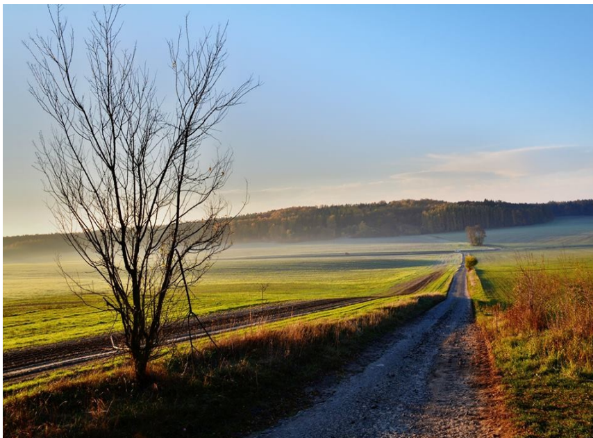
Obrázek 1 Cesta v polích Dobruška