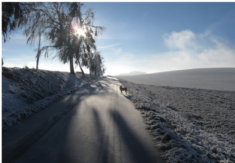
Obrázek 5 Na kopci v Bystrém u Poličky