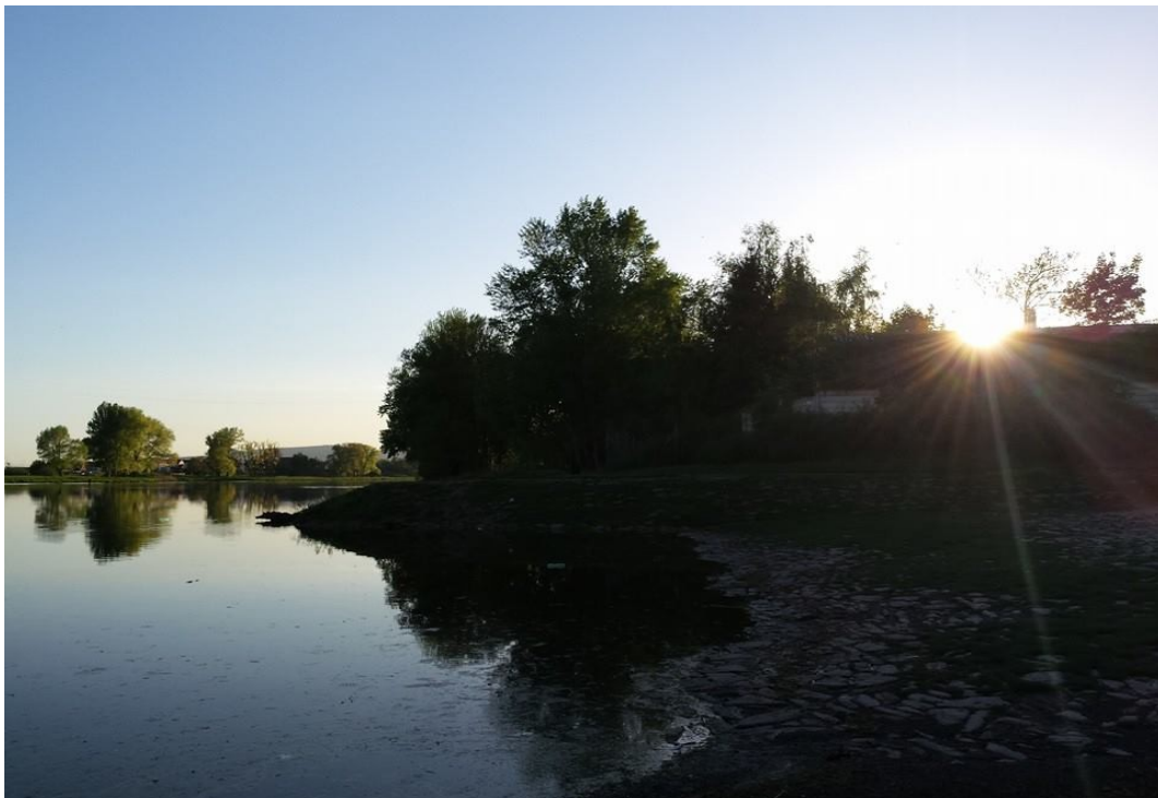
Obrázek 10 Žalhostice, Rybník