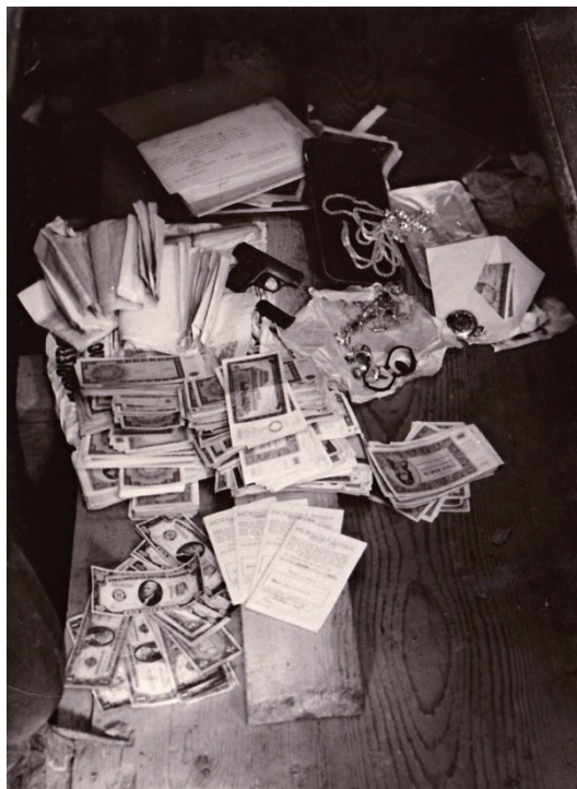
Obr. 16 – Předměty, které měly být nalezeny při prohlídce kostela (tuzemské i zahraniční peníze, doklady, zbraň, cenné předměty apod.). Fotografie z KA: složka Procesy 1945–1950.