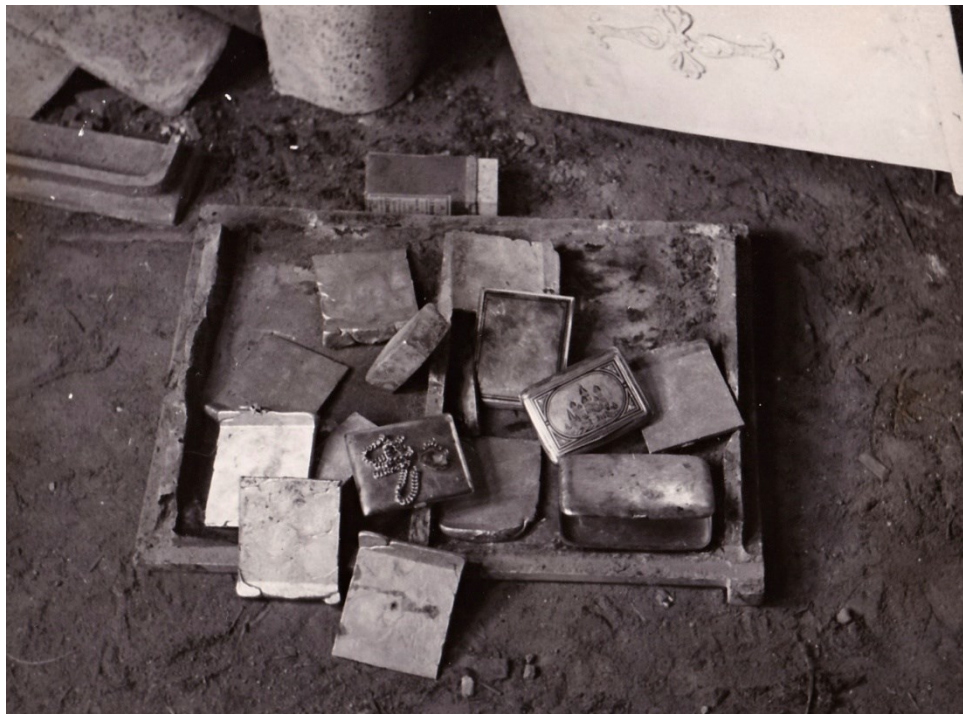
Obr. 20 – Nález cenností ve sklepení kláštera