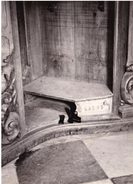
Obr. 15 – Pistole ukrytá pod klekátkem ve zpovědnici.