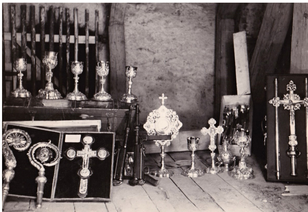
Obr. 18 – Cennosti nalezené v jižní věži kostela. K premonstráty schovaným liturgickým předmětům postavili vyšetřovatelé dva samopaly.