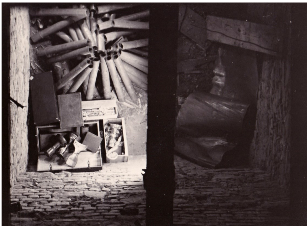
Obr. 17 – Úkryt cenností v jižní věži kostela.