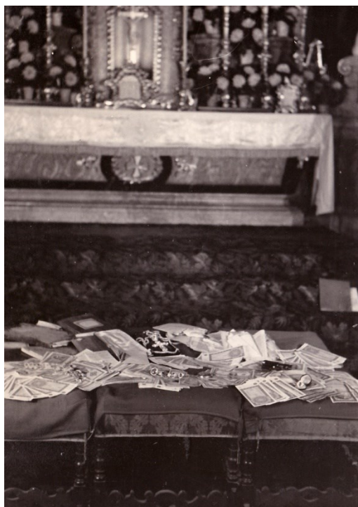
Obr. 19 – Všechny předměty „nalezené“ v kostele. Fotografická inscenace nalezených předmětů před svatostánkem.