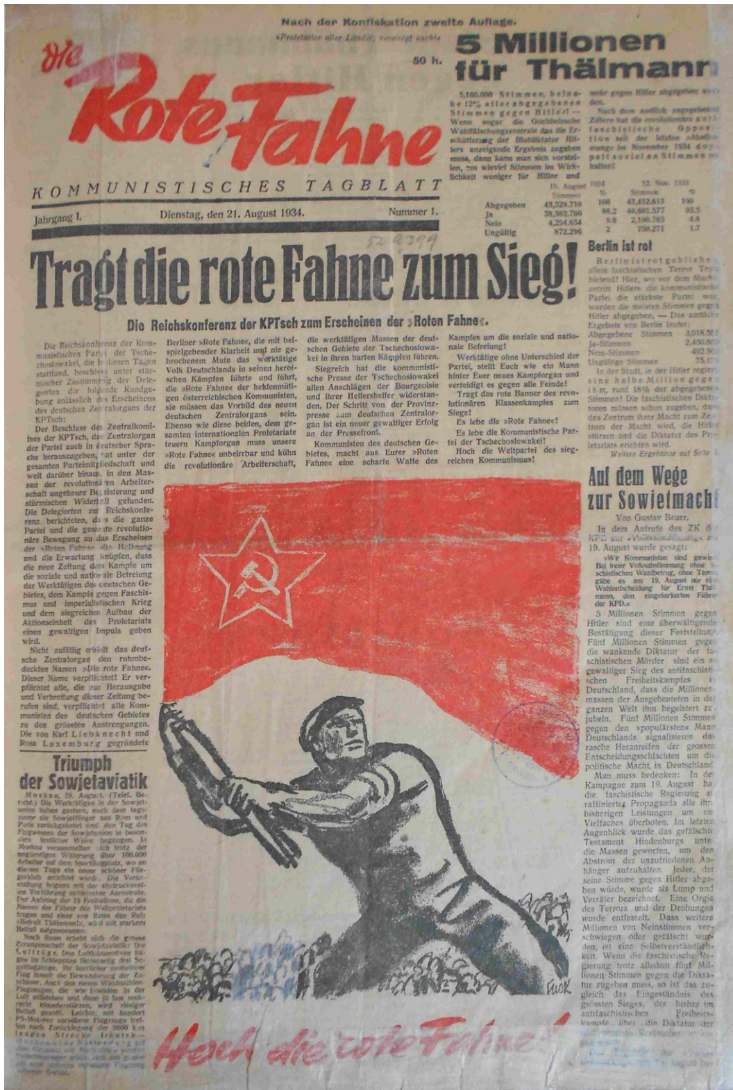
Obrázek 7 Die Rote Fahne, 21. Srpna 1934