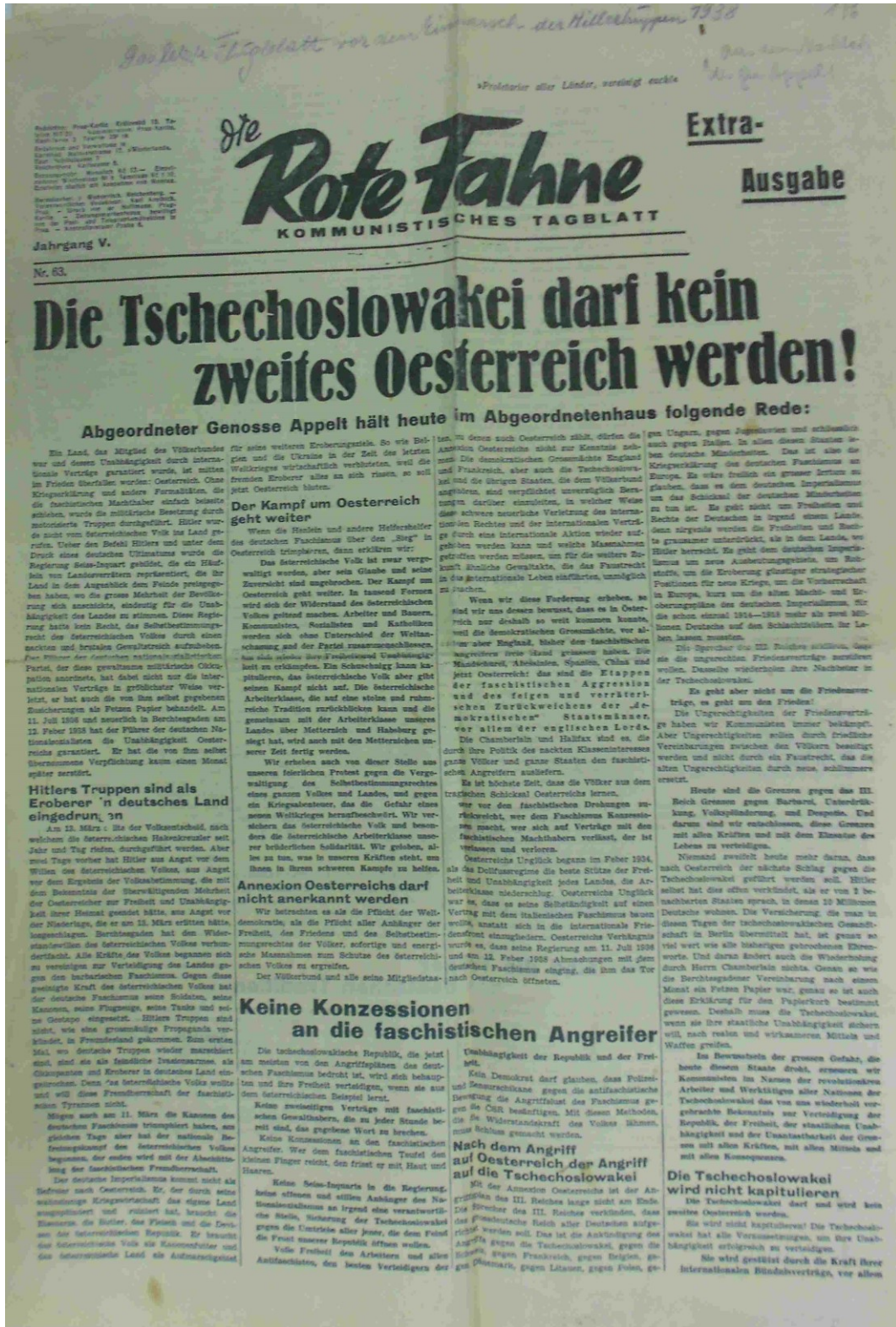
Obrázek 9 Die Rote Fahne, zvláštní vydání, září 1938