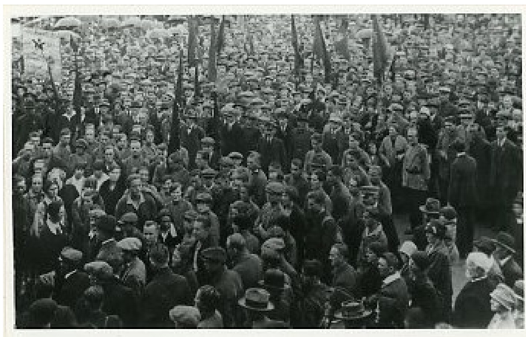
Obrázek 2 Shromáždění v Jablonci nad Nisou, 1933