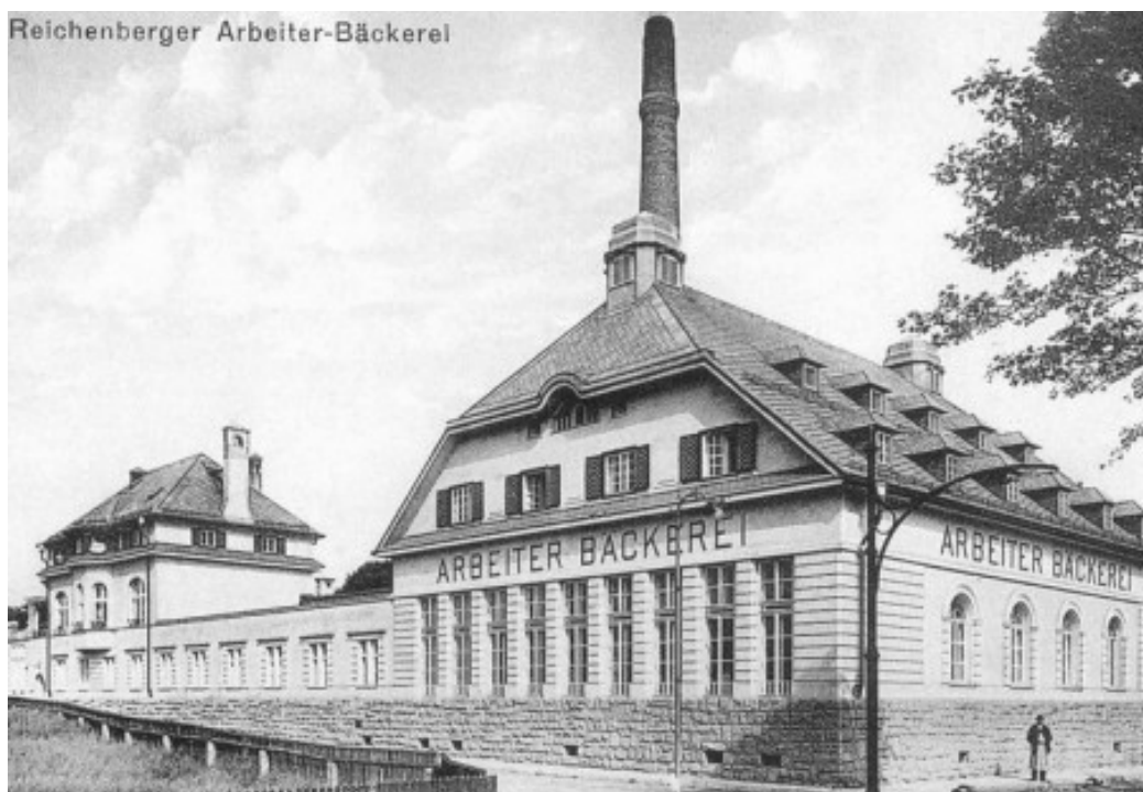
Obrázek 3 Dělnická pekárna v Liberci (dostupné online: http://liberec-reichenberg.net/stavby/karta/nazev/70-liberecka-delnicka-pekarna# , stav ke dni 1. 8. 2017)