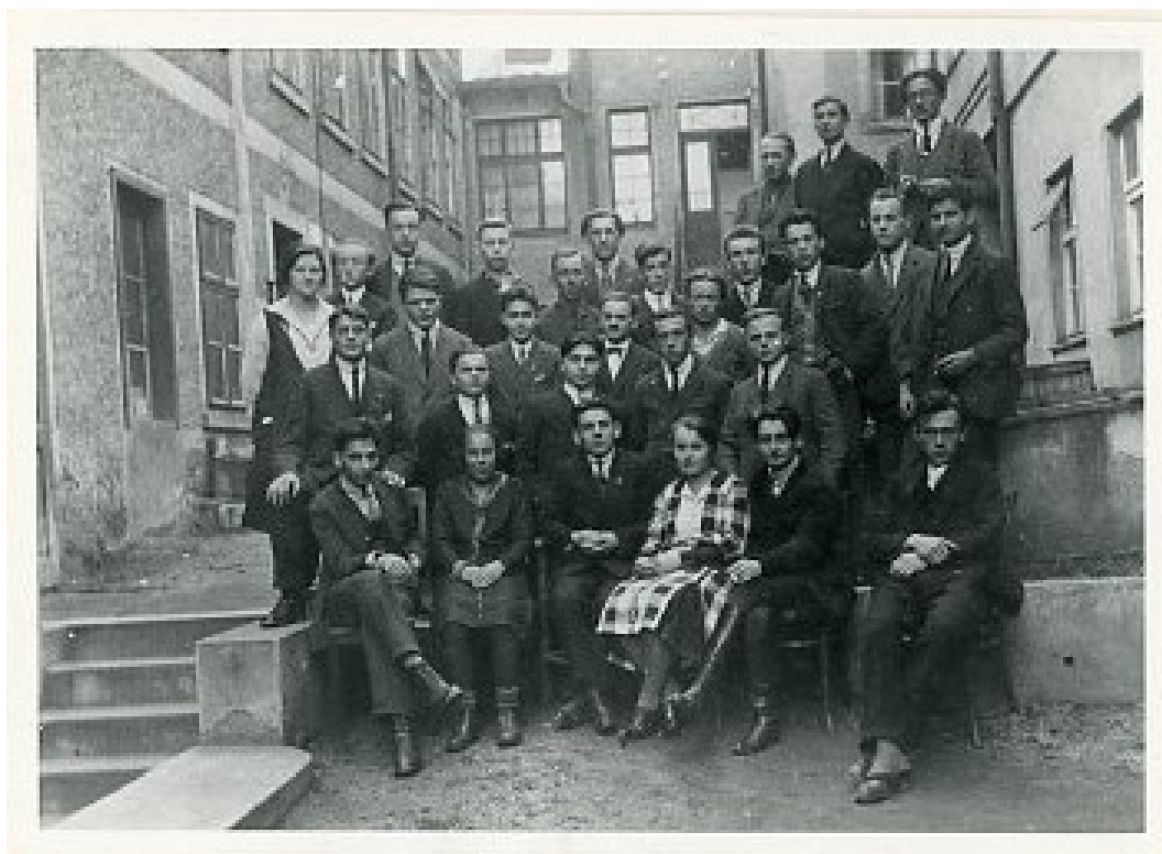
Obrázek 1 Školení funkcionářů komunistické mládeže (NA, fotoarchiv Ústavu marxismu-leninismu)