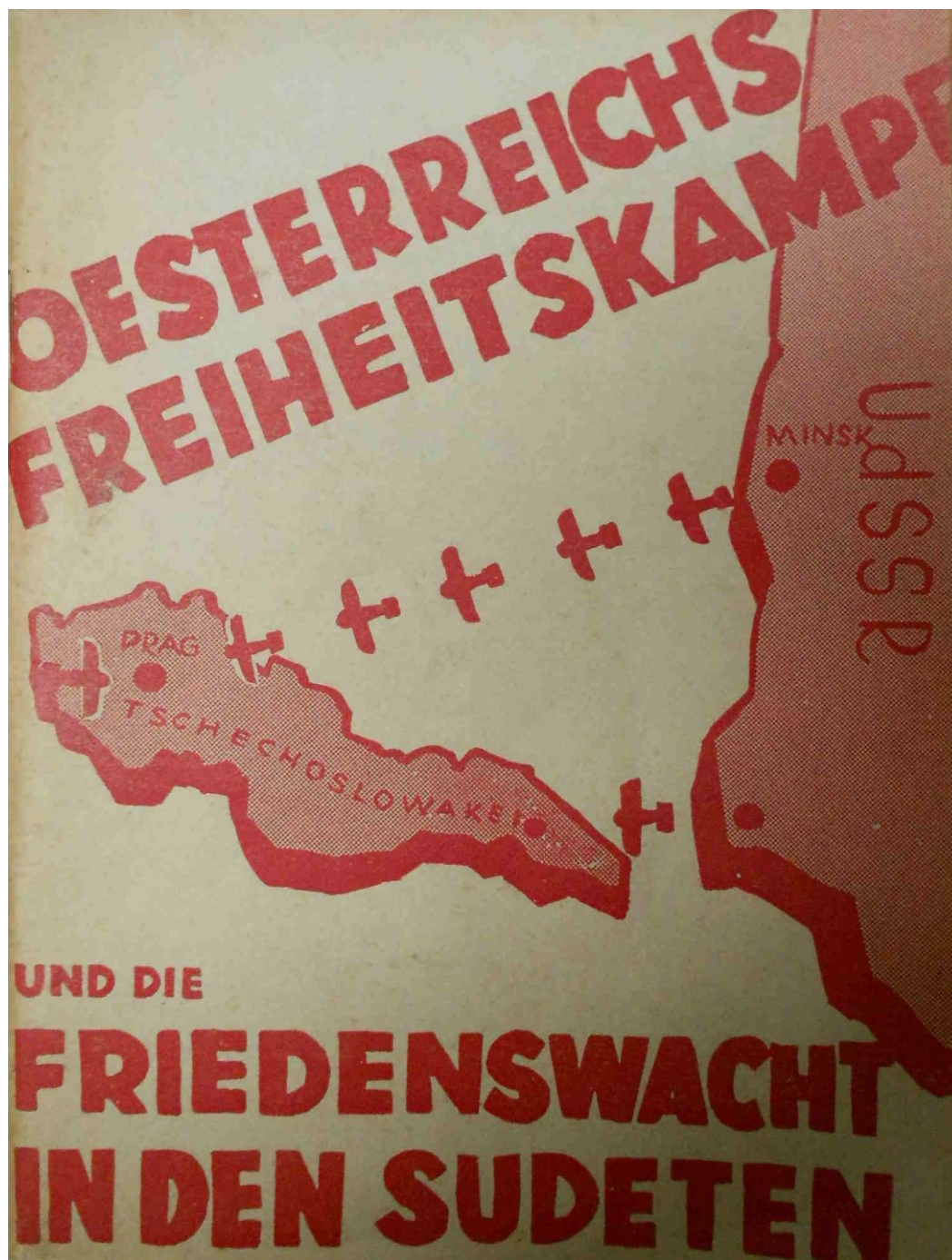
Obrázek 8 REICHENBERGER, Franz. Oesterreichs Freiheitskampf und die Friedenswacht in den Sudeten. Prag: Verlagsbüro, 1938