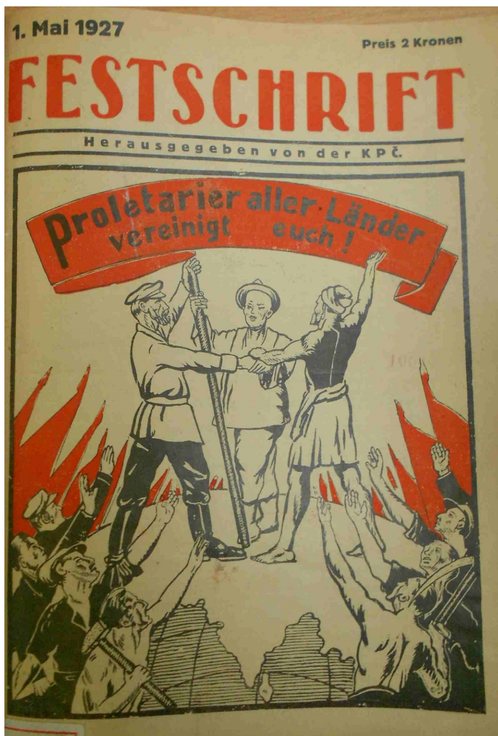
Obrázek 5 1. Mai: Festschrift. Reichenberg: Runge & Co, 1927