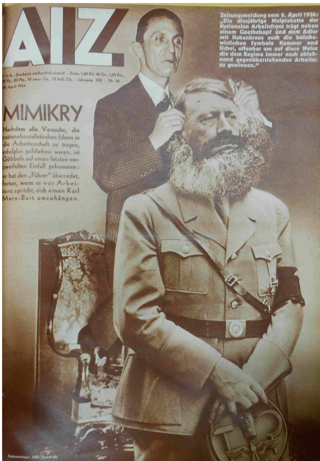
Obrázek 4 AIZ, duben 1934