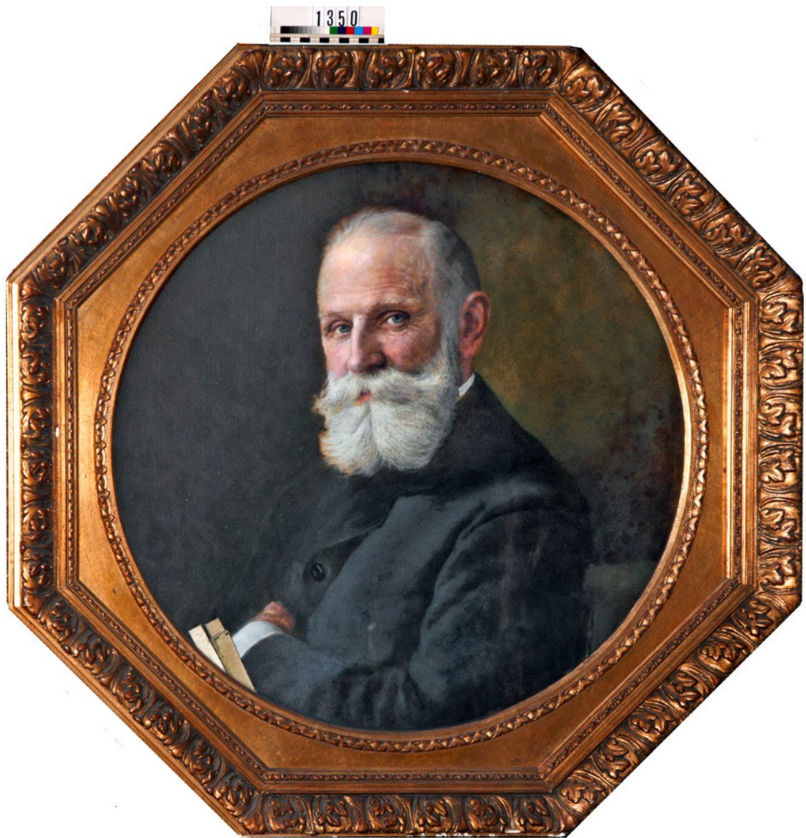
Zdroj: Oblastní muzeum Děčín, pobočka Rumburk, inv. č. 1350