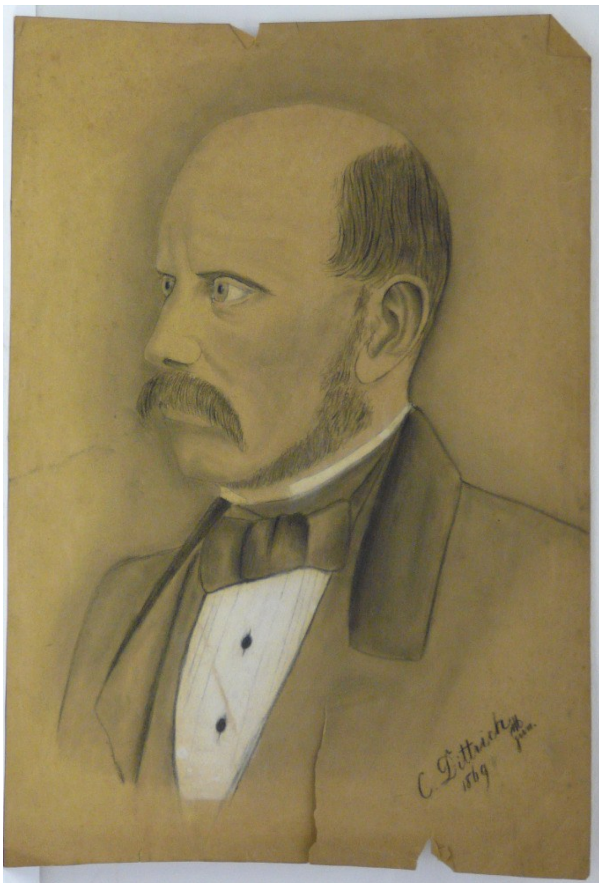
Příloha č. 5: Kresba Carla Dittricha juniora, autor: neznámý

Zdroj: Oblastní muzeum Děčín, pobočka Rumburk, inv. č. 214-87