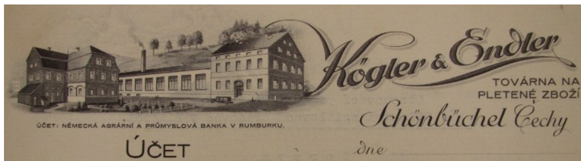
Příloha č. 18: Veduta firmy Kögler & Endler, továrna na pletené zboží na firemním formuláři