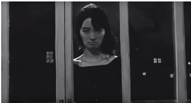
Obrázek 1 Služebná rozzlobeně hledící do pokoje. (zdroj: Služebná [ Hanjö ] [film]. Režie Pak Ki-jöng . Korejská republika, 1960.)