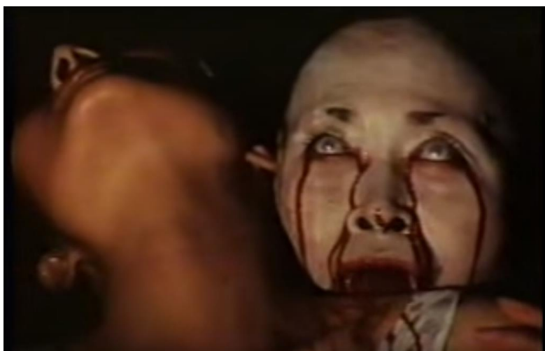
Obrázek 5 Naturalistické ztvárnění upířího ducha. (Zdroj: Ženský nářek [ Jögoksöng ] [film]. Režie I Kje-in. Korejská republika, 1986.)