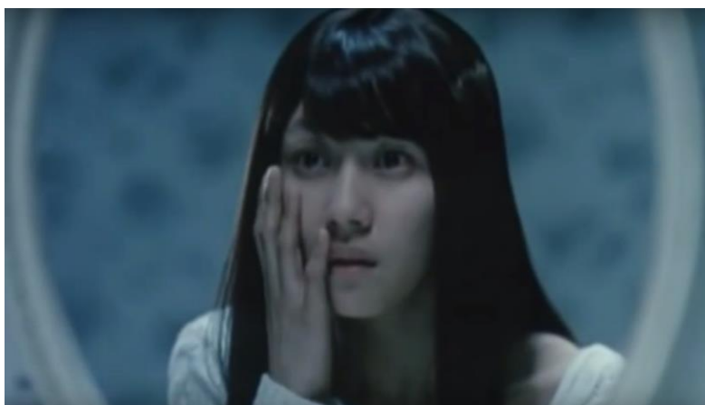
Obrázek 6 Nemocná dívka fascinovaná svým vzhledem v paruce. (Zdroj: Paruka [ Kabal ]. [film]. Režie Wön Sin-jön. Korejská republika, 2005. )