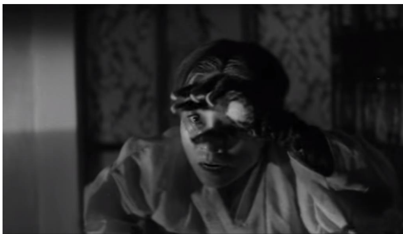
Obrázek 2 Kočičí démon přetvářený do zlé tchyně. (Zdroj: Ďábelský vrah [ Sarinma ] [film]. Režie I Jong-min. Korejská republika, 1965. )