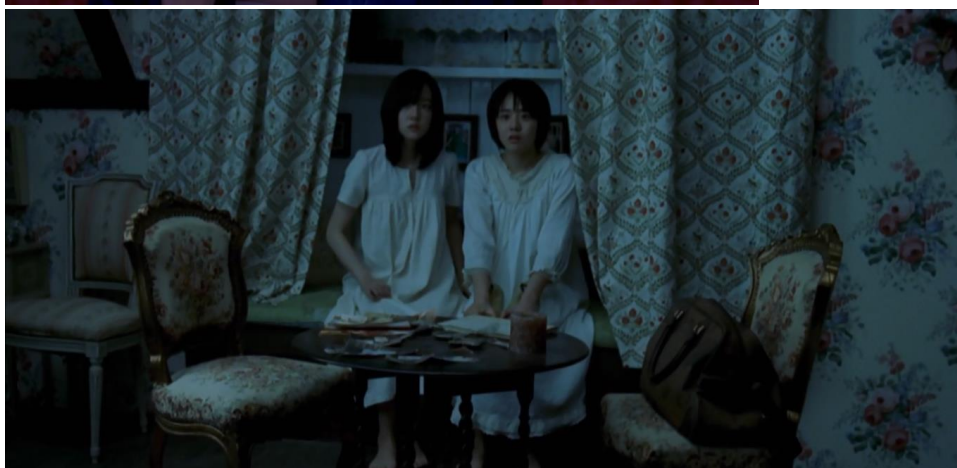
Obrázek 11,12 Zdobené tapety a výrazné barvy, sloužily k dokreslení celkové atmosféry ve filmu Čanghwa, Hongrjōn . Na obrázku nahoře se nachází nevlastní matka a dolní fotka zachycuje obě sestry. (Zdroj: Růže a Rudý lotus[ Čanghwa, Hongrjōn ] [film]. Režie Kim Či-un, 2003.)