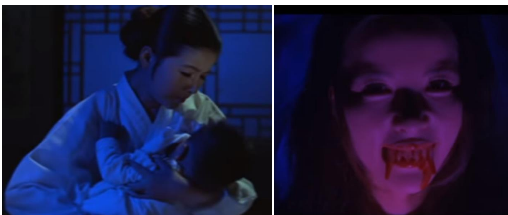
Obrázek 3,4 Duch Wöl-hjang: Na prvním snímku kojí mrtvá žena své dítě. Druhá fotka ukazuje její démonickou tvář.