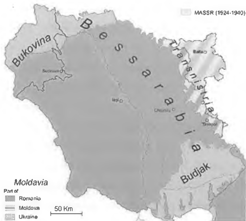
Území historické Moldávie a jeho následné dělení