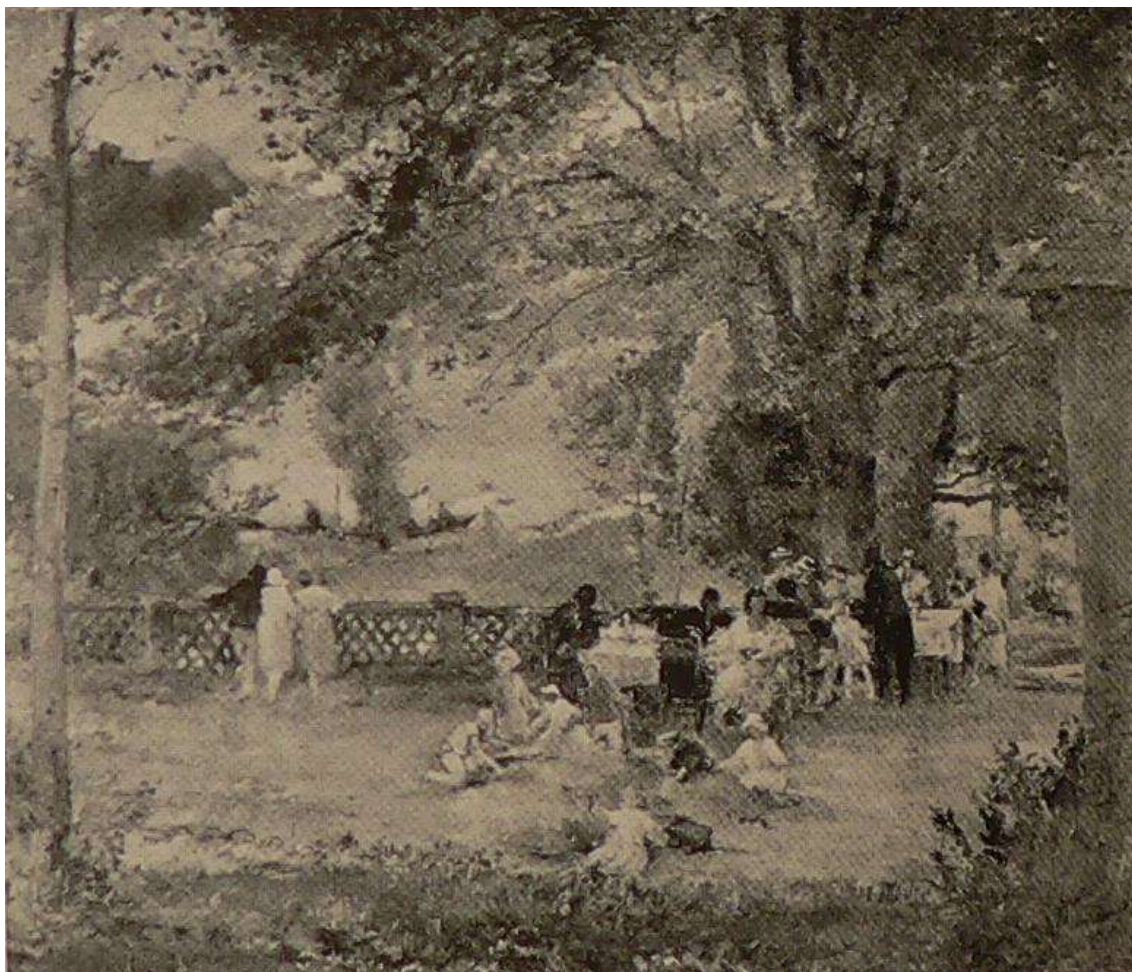
Oldřich Blažíček, Společnost na terase . Olej na plátně / 114 x 102 cm