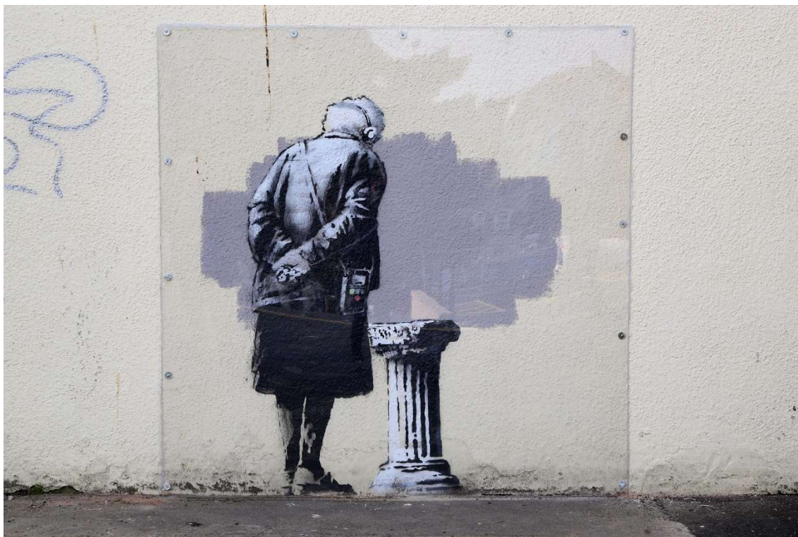
Banksy, Art Buff

New Banksy mural appears on Folkestone wall | The Independent. The Independent | News | UK and Worldwide News | Newspaper [online]. Obrázek ve formě jpeg. Dostupné z: http://www.independent.co.uk/arts-entertainment/art/news/new-banksy-mural-appears-in-folkestone-9764753.html