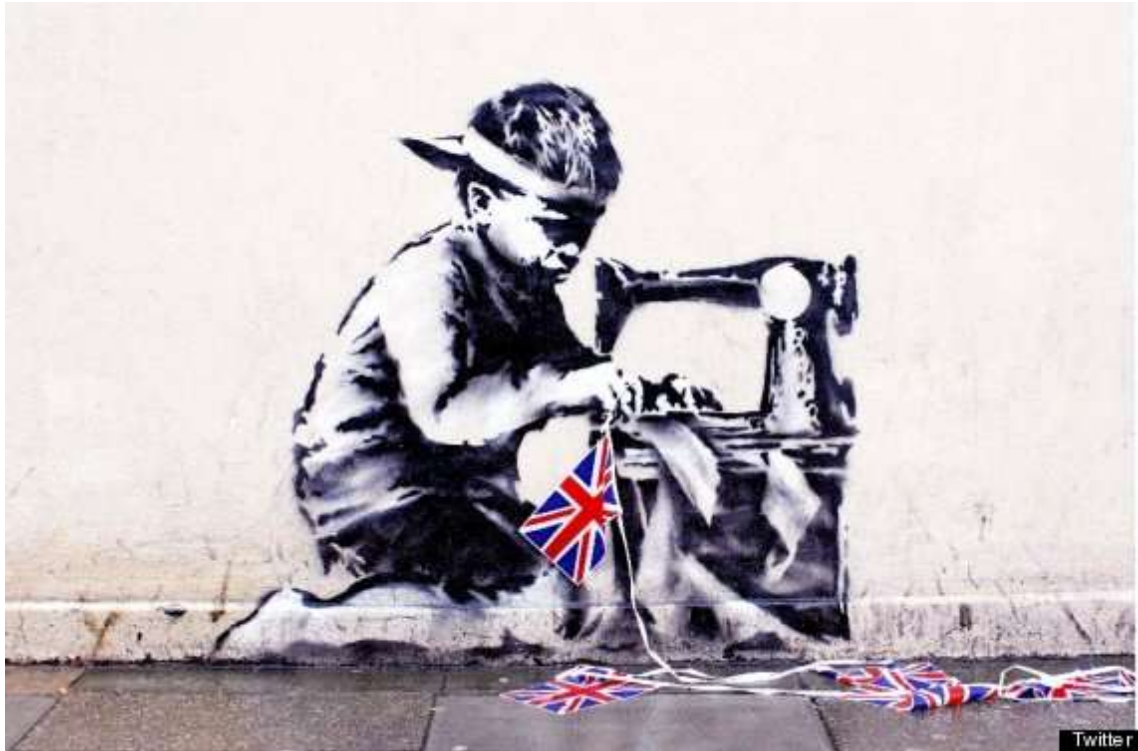
Banksy, Otrocká práce

Banksy 'Slave Labour' Mural Sells At Private London Auction For '£750,000' | HuffPost UK. UK News and Opinion - HuffPost UK [online]. Copyright ©2017 Oath Inc. All rights reserved. [cit. 29.08.2017]. Obrázek formy jpeg. Dostupné z: http://www.huffingtonpost.co.uk/2013/06/03/banksy-slave-labour-sold_n_3377435.html