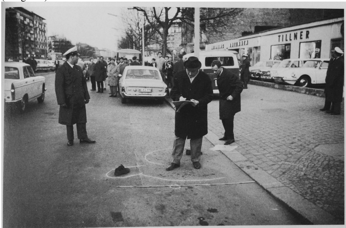
Zdroj: Fichter, Tilman, and Siegwald Lonnendonker. 2008. Kleine Geschichte Des SDS . Essen: Klartext.