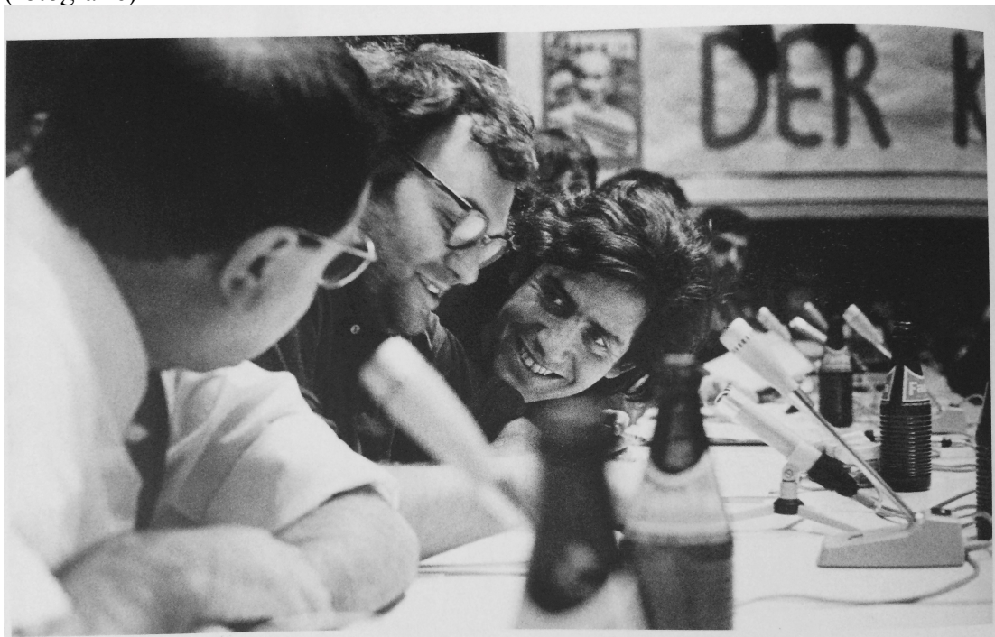
Zdroj: Fichter, Tilman, and Siegwand Lonnendonker. 2008. Kleine Geschichte Des SDS . Essen: Klartext.