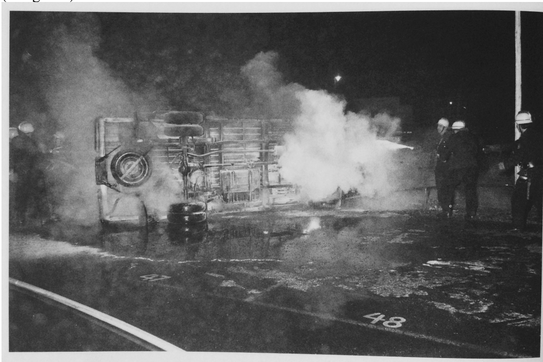
Zdroj: Fichter, Tilman, and Siegwald Lonnendonker. 2008. Kleine Geschichte Des SDS . Essen: Klartext.