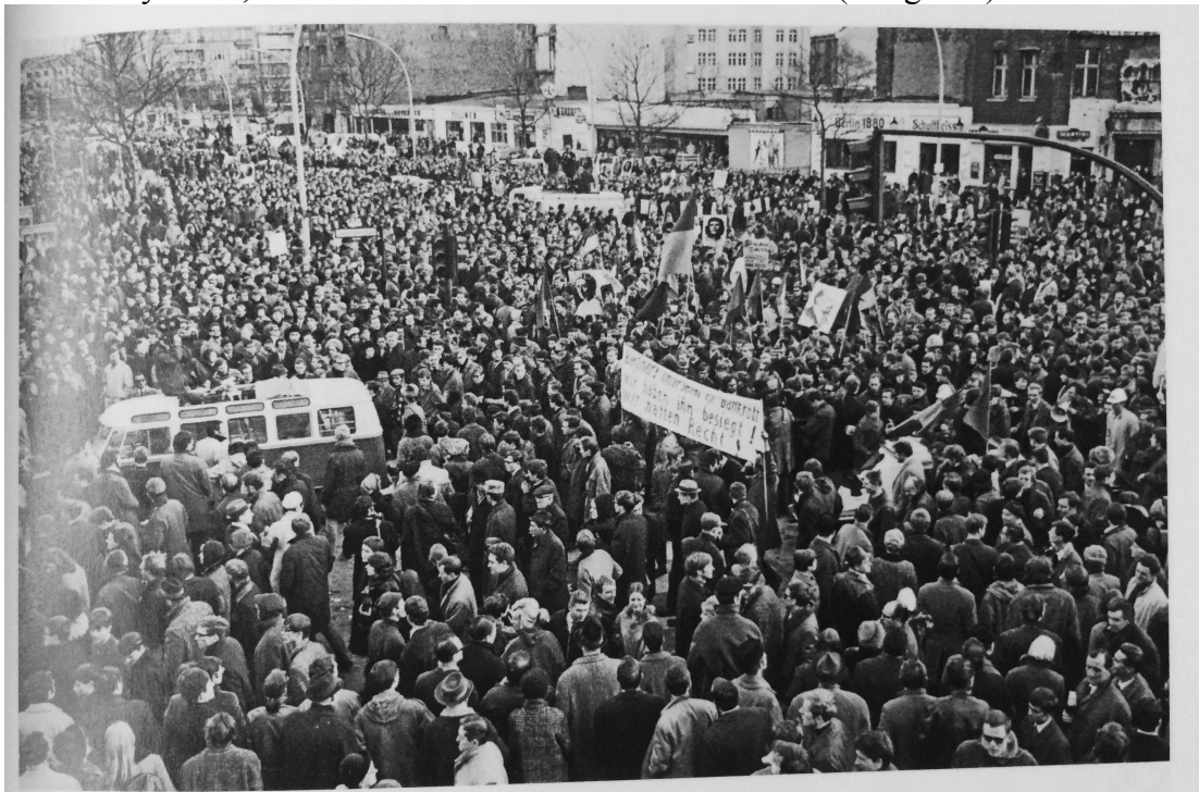
Zdroj: Fichter, Tilman, and Siegwald Lonnendonker. 2008. Kleine Geschichte Des SDS . Essen: Klartext.