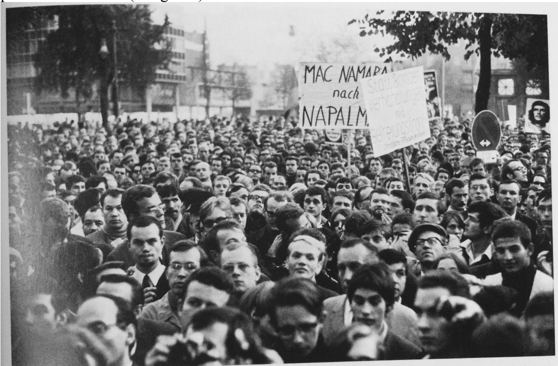
Zdroj: Fichter, Tilman, and Siegwand Lonnendonker. 2008. Kleine Geschichte Des SDS . Essen: Klartext.