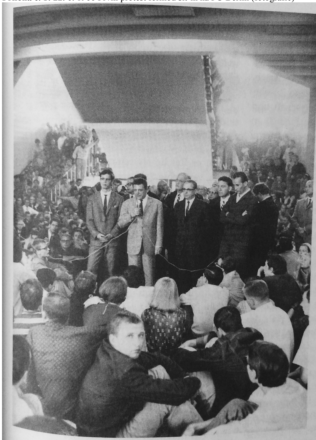
Příloha č. 1: 22. 6. 1966 První protest formou sit-in na FU Berlín (fotografie)