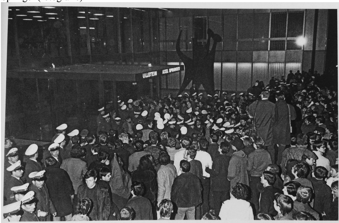
Zdroj: Fichter, Tilman, and Siegwald Lonnendonker. 2008. Kleine Geschichte Des SDS . Essen: Klartext.