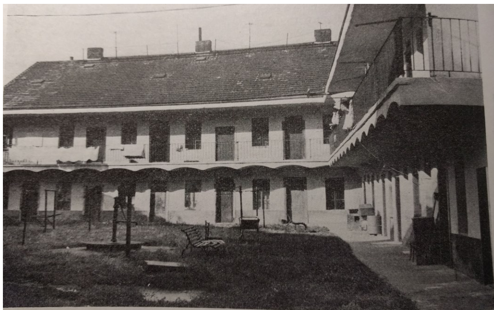
Bývalý Perutzův pavlačový dům s nádvořním křídlem z r. 1890. Libeň, ul. Na žertvách (dř. Smetanova) čp. 283. Foto z r. 1974.

nebo se spolehnout na domácí sebevzdělávání v rámci rodinných vazeb. V neposlední řadě hrály významnou roli i vlivy stojící mimo dělníkovo pracoviště, dle mého mínění, byla nejvýznamnějším z těchto vlivů podoba dělnického bydlení, které pokud nedosahovalo běžného standartu, mohlo sloužit jako určitá záminka pro stávkou. 176 Vzorovým příkladem nevyhovujícího dělnického bydlení byl například činžovní pavlačový dům Perutzovy přádelny, obyvateli domu byl podle příjmení tehdejšího majitele familiárně nazýván „Perucák.“ Pro čtenářovu představu, byt tvořila jediná místnost o rozloze pouhých 24 m 2 , bez sociálního zařízení, které bylo společné pro celou pavlač. Místnost tedy sloužila zároveň jako obývací pokoj, kuchyň a ložnice, v níž se tísnila celá dělnická rodina s několika dětmi. 177