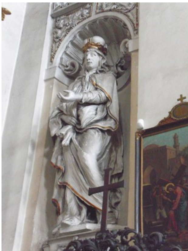
19. Stará Boleslav, kostel Nanebevzetí Panny Marie, 1617-1623, Valdštejnská kaple, socha sv. Ludmily