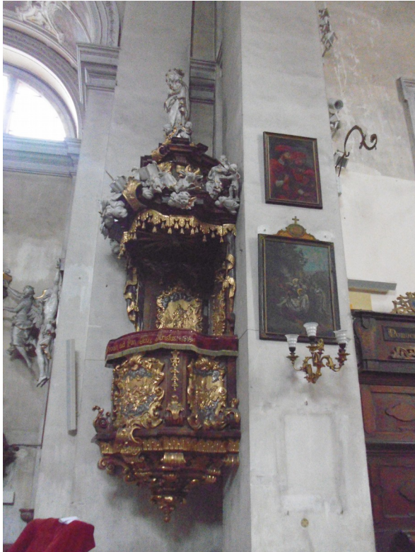
7. Stará Boleslav, kostel Nanebevzetí Panny Marie, kazatelna, 1743