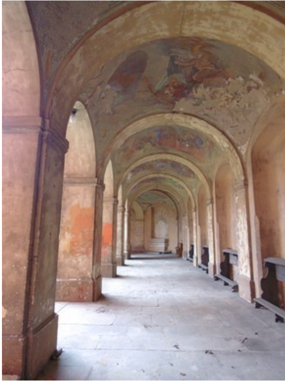
25. Stará Boleslav, ambity, 1728-1731