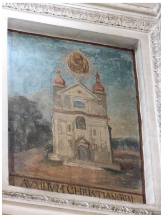
16. Stará Boleslav, kostel Nanebevzetí Panny Marie, 1617-1623, Černínská kaple, nástěnná freska