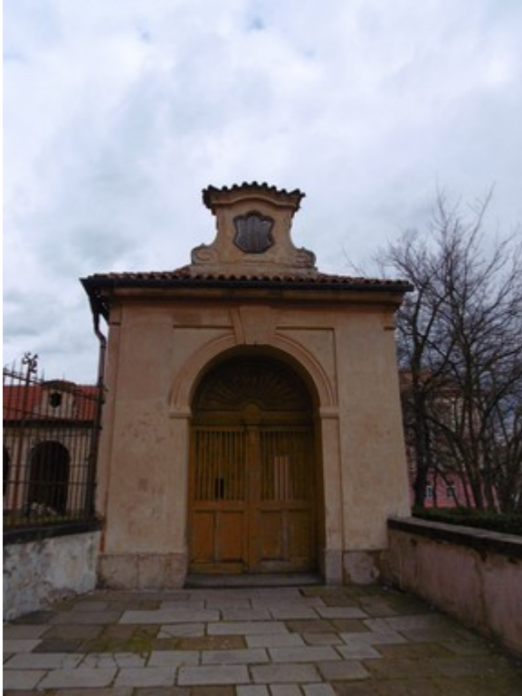
23. Stará Boleslav, ambity, 1728-1731