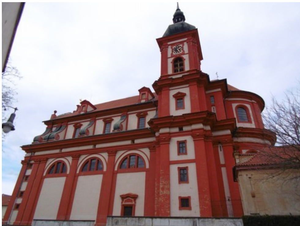
2. Stará Boleslav, kostel Nanebevzetí Panny Marie, 1617-1623, jižní fasáda