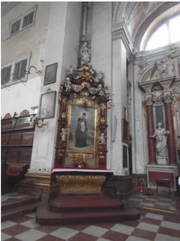
8. Stará Boleslav, kostel Nanebevzetí Panny Marie, oltář sv. Jana Nepomuckého, 1744