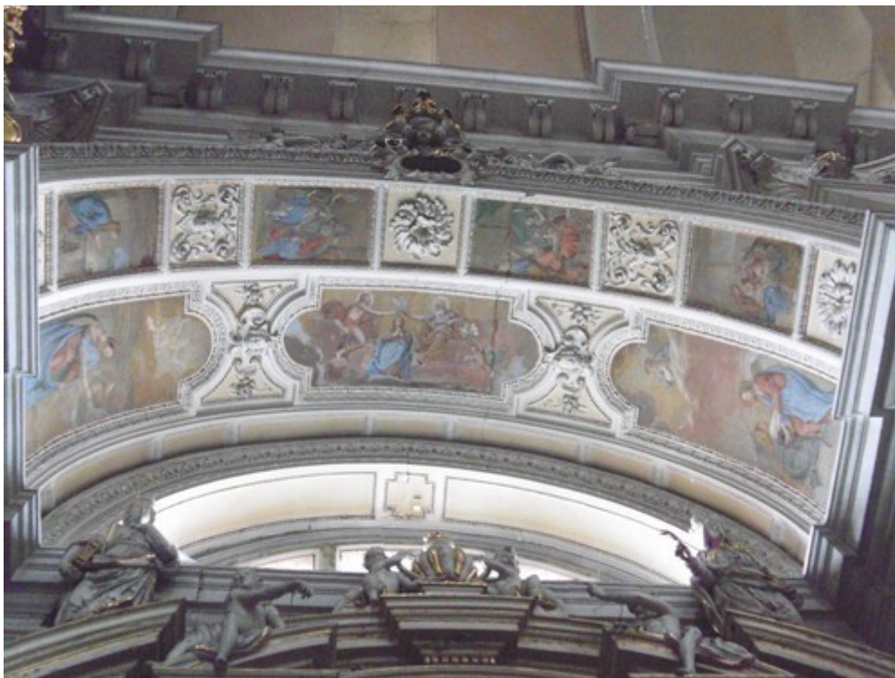
12. Stará Boleslav, kostel Nanebevzetí Panny Marie, 1617-1623, Berkovská kaple, nástropní freska.