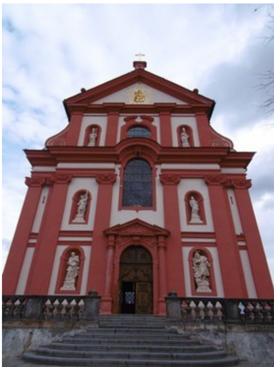
1. Stará Boleslav, kostel Nanebevzetí Panny Marie, 1617-1623, průčelí