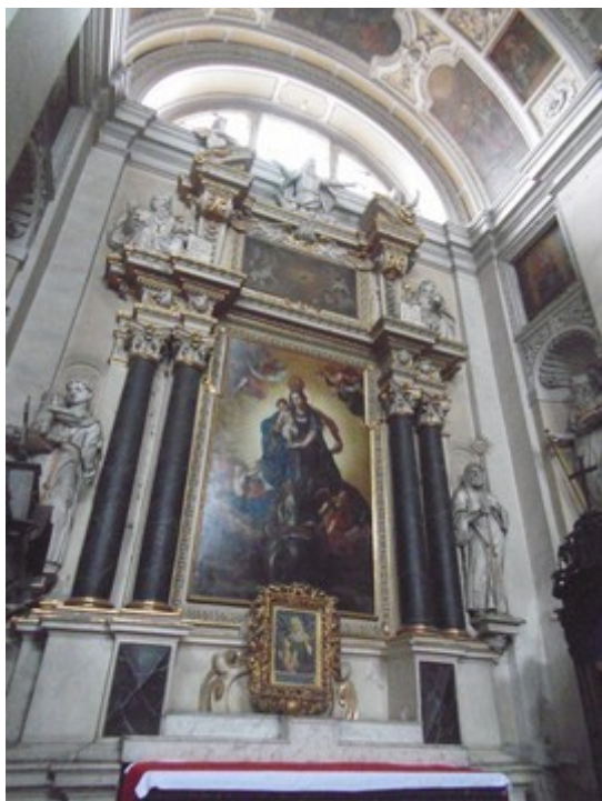
20. Stará Boleslav, kostel Nanebevzetí Panny Marie, 1617-1623, Morzinská kaple