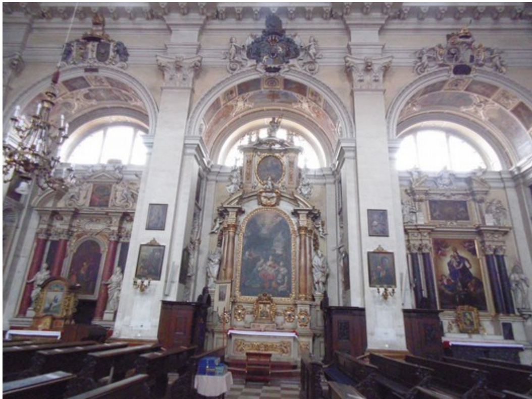
9. Stará Boleslav, kostel Nanebevzetí Panny Marie, 1617-1623, boční kaple jižní strana