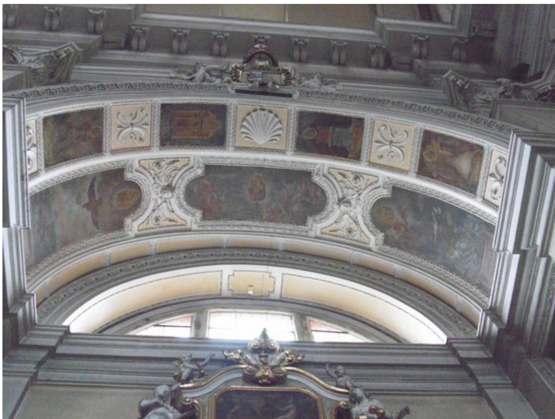
15. Stará Boleslav, kostel nanebevzetí Panny Marie, 1617-1623, Černínská kaple, nástropní freska