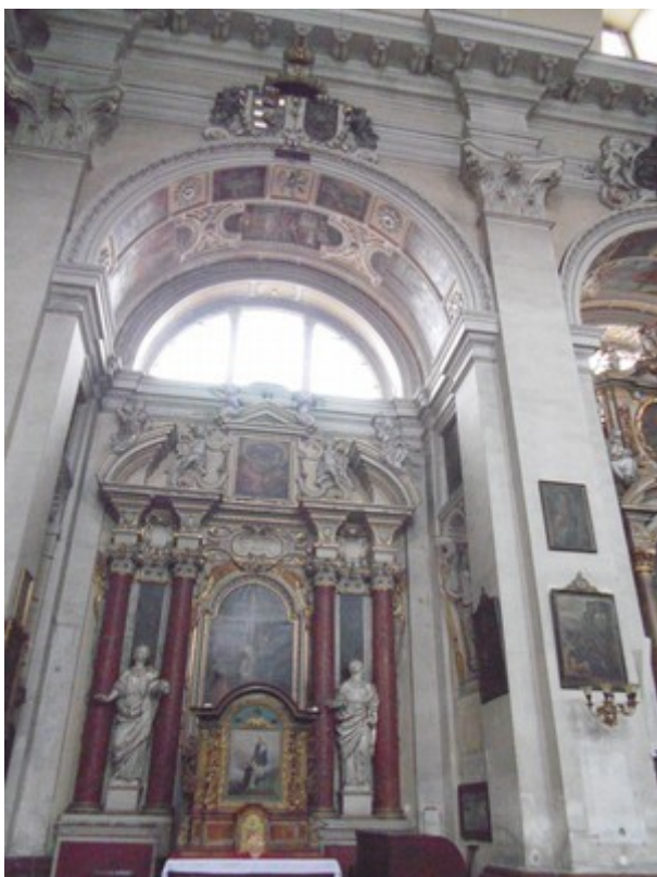
17. Stará Boleslav, kostel Nanebevzetí Panny Marie, 1617-1623, Slavatovská kaple