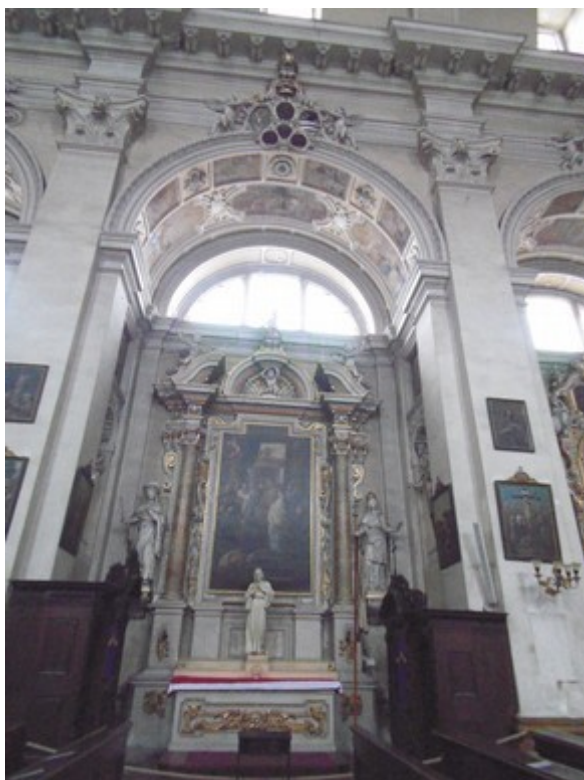
13. Stará Boleslav, kostel Nanebevzetí Panny Marie, 1617-1623, Lažanská kaple