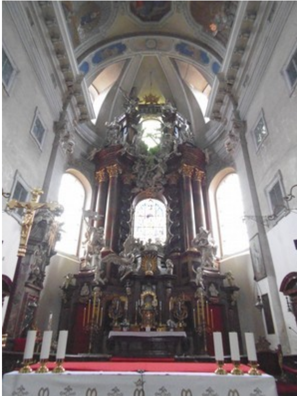
5. Stará Boleslav, kostel Nanebevzetí Panny Marie, hlavní oltář, 1717-1723