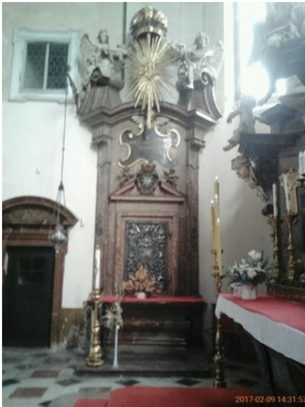
6. Stará Boleslav, kostel Nanebevzetí Panny Marie, Šternberské sanktuárium, 1727-28