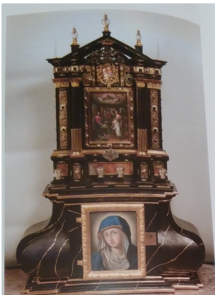
28. Stará Boleslav, Trůnek pro Paladium