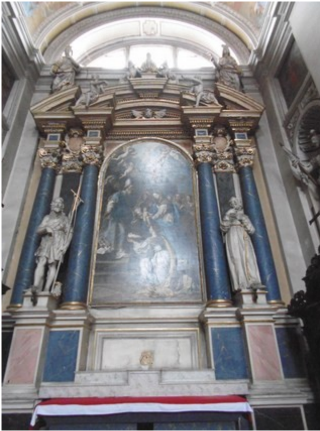
11. Stará Boleslav, kostel Nanebevzetí Panny Marie, 1617-1623, Berkovská kaple