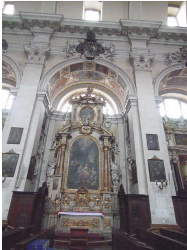
18. Stará Boleslav, kostel Nanebevzetí Panny Marie, 1617-1623, Valdštejnská kaple