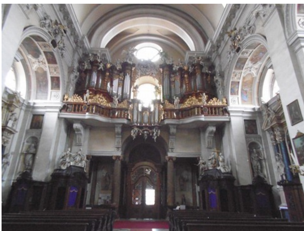
4. Stará Boleslav, kostel Nanebevzetí Panny Marie, 1617-1623, kruchta s varhany