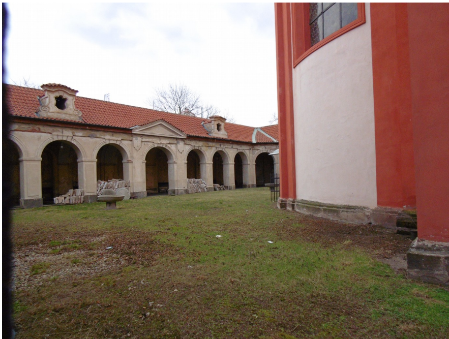
24. Stará Boleslav, ambity, 1728-1731