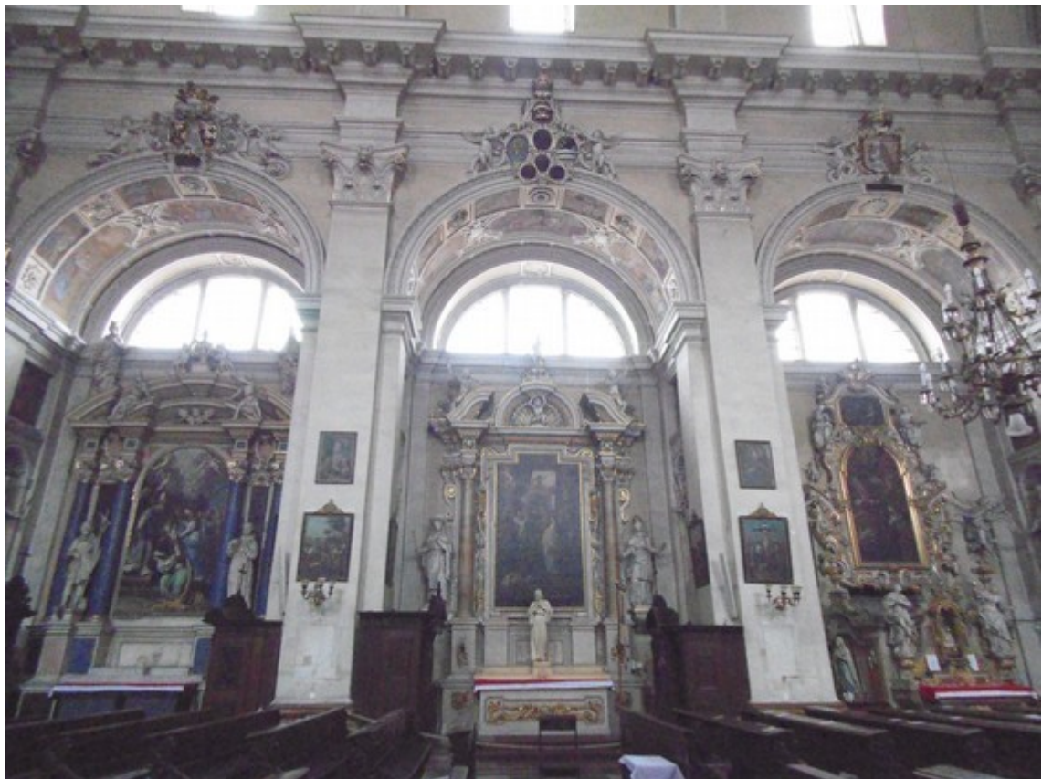
10. Stará Boleslav, kostel Nanebevzetí Panny Marie, 1617-1623, boční kaple severní strana.