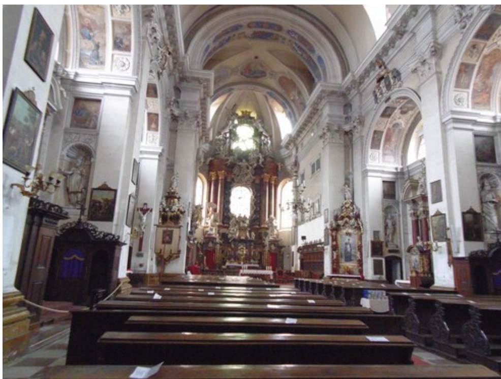
3. Stará Boleslav, kostel Nanebevzetí Panny Marie, 1617-1623, pohled do lodi