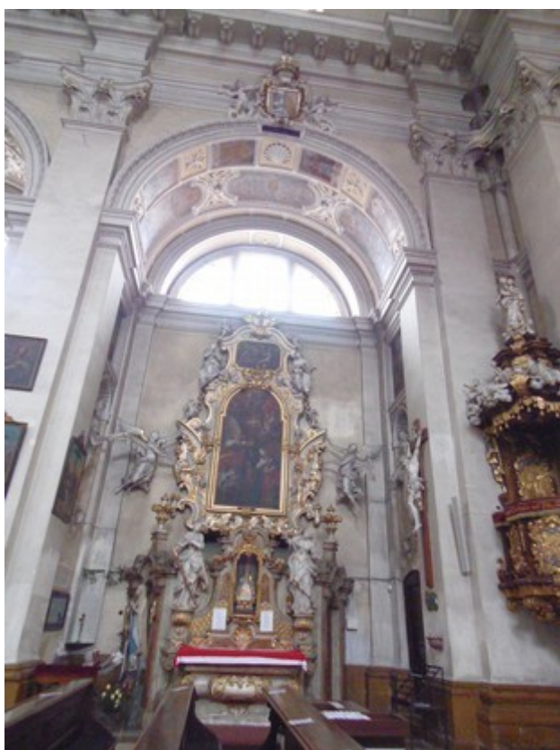
14. Stará Boleslav, kostel Nanebevzetí Panny Marie, 1617-1623, Černínská kaple