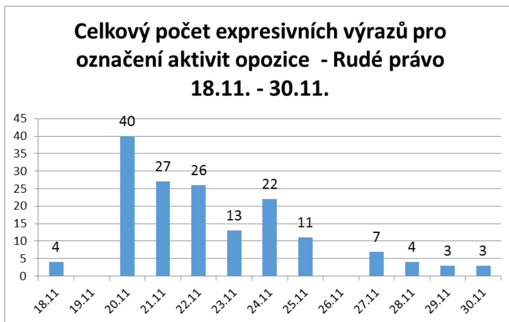
Graf č. 1: Celkový počet expresivních výrazů pro označení aktivit opozice v titulu Rudé právo ve dnech 18. 11. – 30. 11. 1989

Zdroj: Rudé právo 18. 11. – 30. 11. 1989