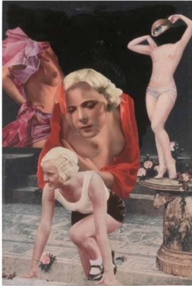
Obrazová příloha 9 Karel Teige, Koláž č. 65 (1938).