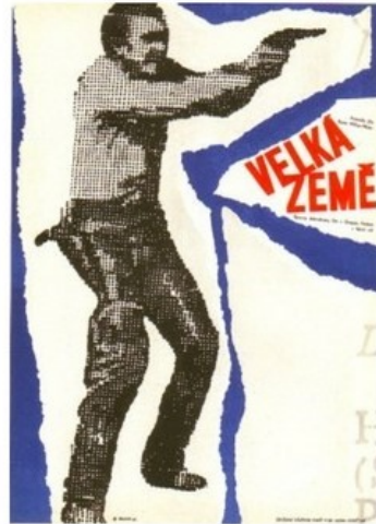
Obrazová příloha 12 Jiří Balcar, Velká země (1963), plakát (koláž).