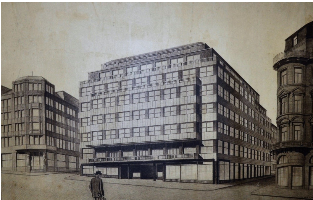
Pojišťovna Fénix (1928 – 1930)