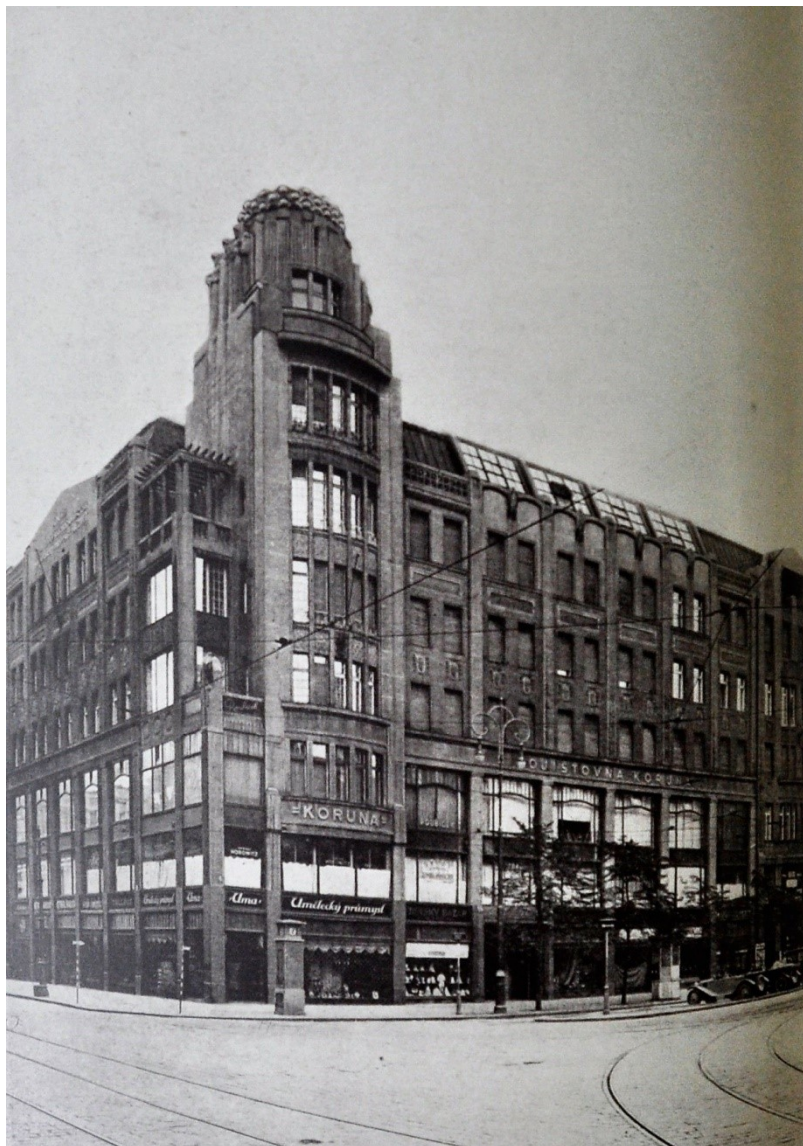
Pojišťovna Koruna (1912 – 1914) Na Příkopě 846/2 projekt: Antonín Pfeiffer, realizace: Václav Nekvasil