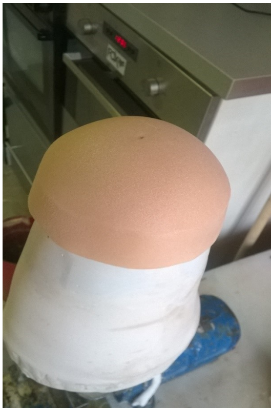
Zhotovení měkké výplně lůžka