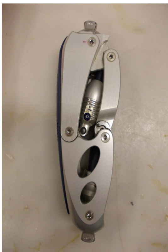
3R60, kolenní kloub