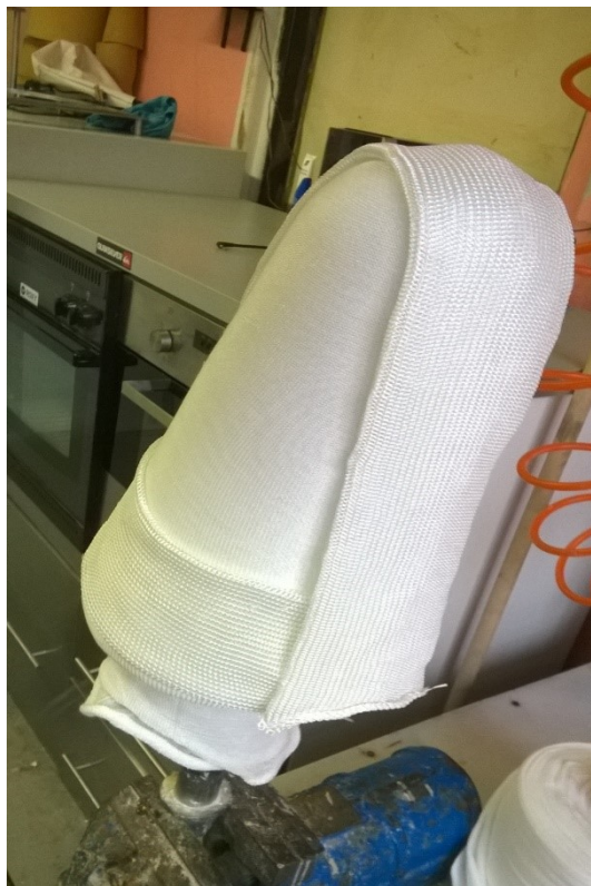
Kompozitní materiál – skelná tkanina