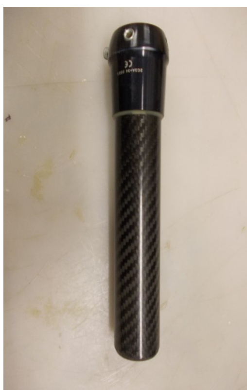
Adaptér s karbonovou trubicou