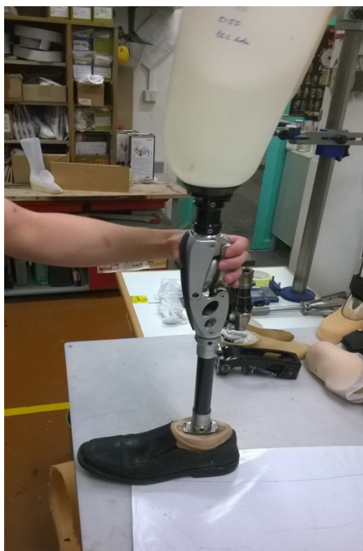
Stehenní protéza