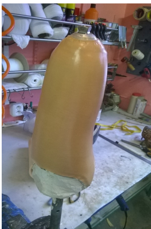
Prosycená tkanina kompozitu