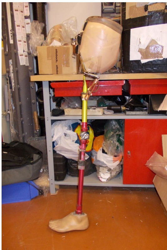
Protéza po exartikulaci kyčle