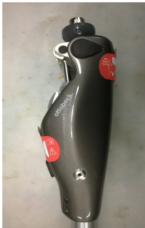
C-leg, kolenní kloub