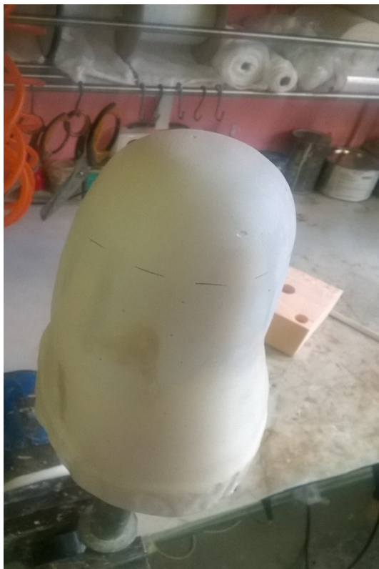
Sádrový model situace