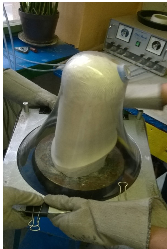
Lůžko z termoplastu Zdroj: autor práce