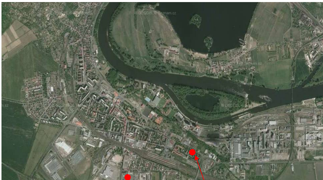
Lokalita „cukrovar“, lokalita „za nádražím“

Paní „D“ si myslí, že většina Roů se nepřihlásila buď proto, že nerozuměla zbytečně složitému formuláři nebo se cítí být Romy stejně jako Čechy, protože se v Čechách narodili, tak jsou to Češi a přitom Romové.