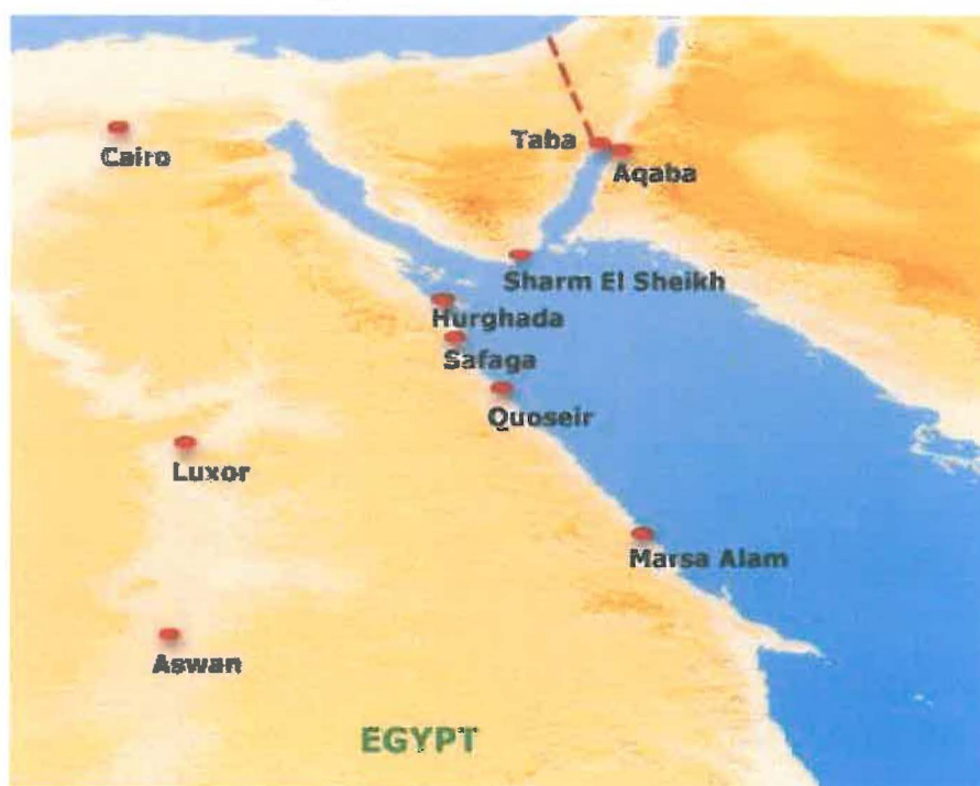
Obrázek č. 1: mapa Egypta