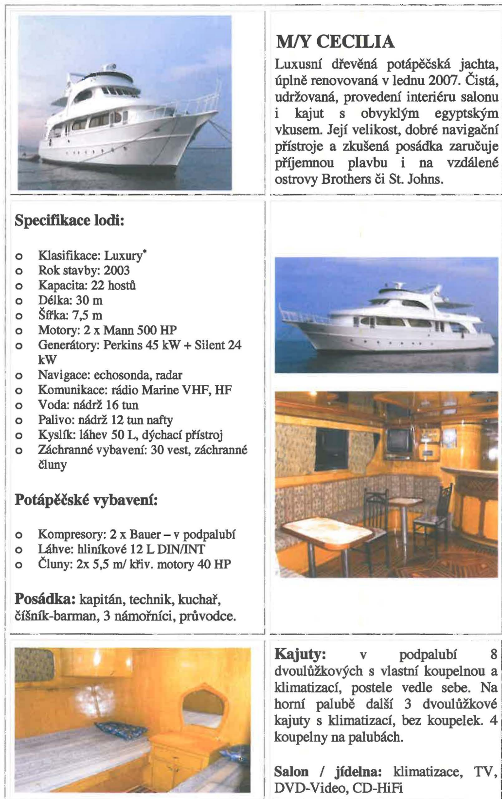
Tabulka č. 4: Popis potápěčské lodi – ubytování: