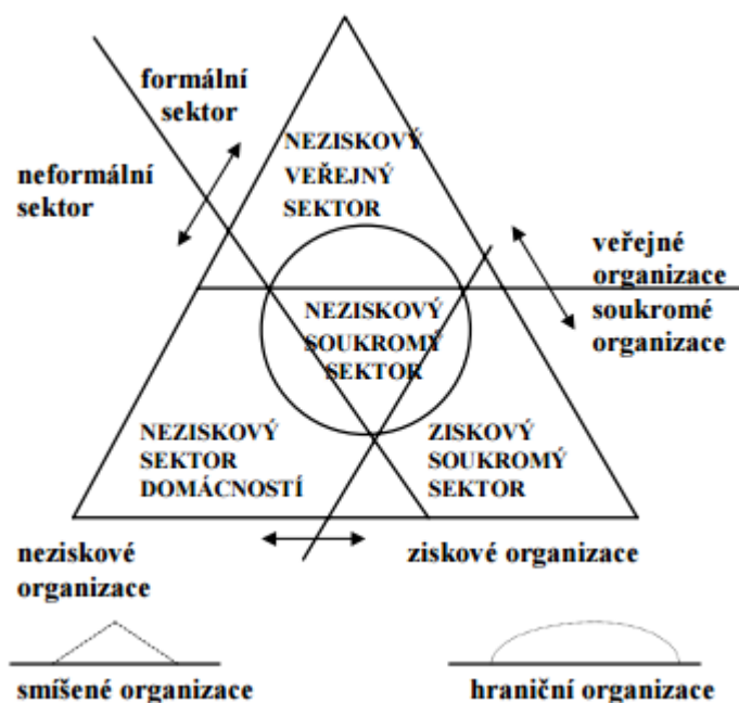
Obrázek 1: Národní hospodářství na základě sektorového rozdělení

Zdroj: Rosenmayer (s.d.) dle Rejšteř (2001) a Pestoff (1995)