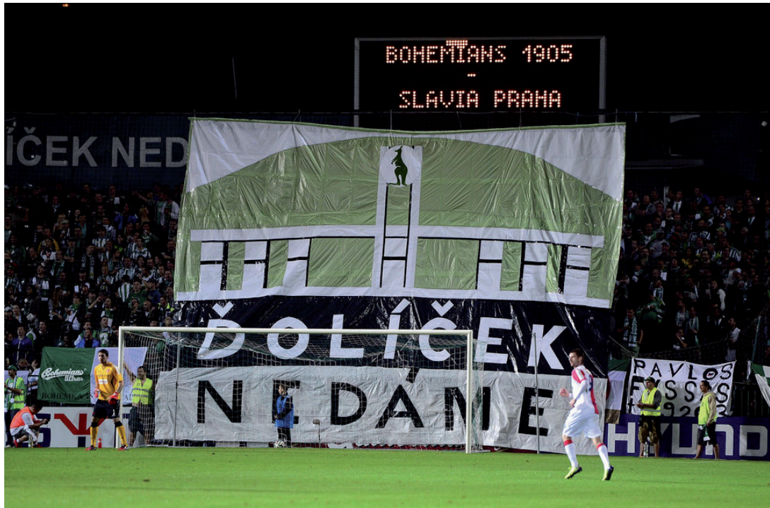
Obrázek č. 13. Choreografie na plachtě pověšené od střeby stadionu Bohemians Praha, která poukazuje na jejich kladný vztah k jejich domovskému stadionu.