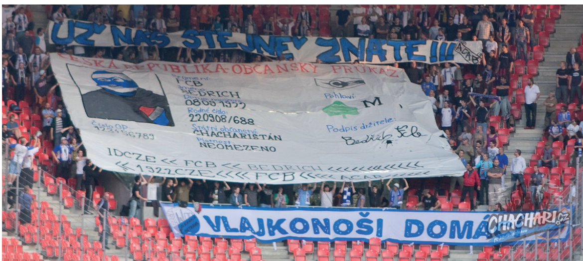
Obrázek č. 20. Choreografie příznivců Baníku Ostrava, kterou protestují proti zpřísněným bezpečnostním opatřením na fotbalových stadionech v České republice.