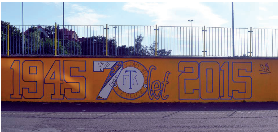
Obrázek č. 10. Graffiti vytvořené teplíckými ultras, k 70. výročí založení teplického fotbalového klubu.