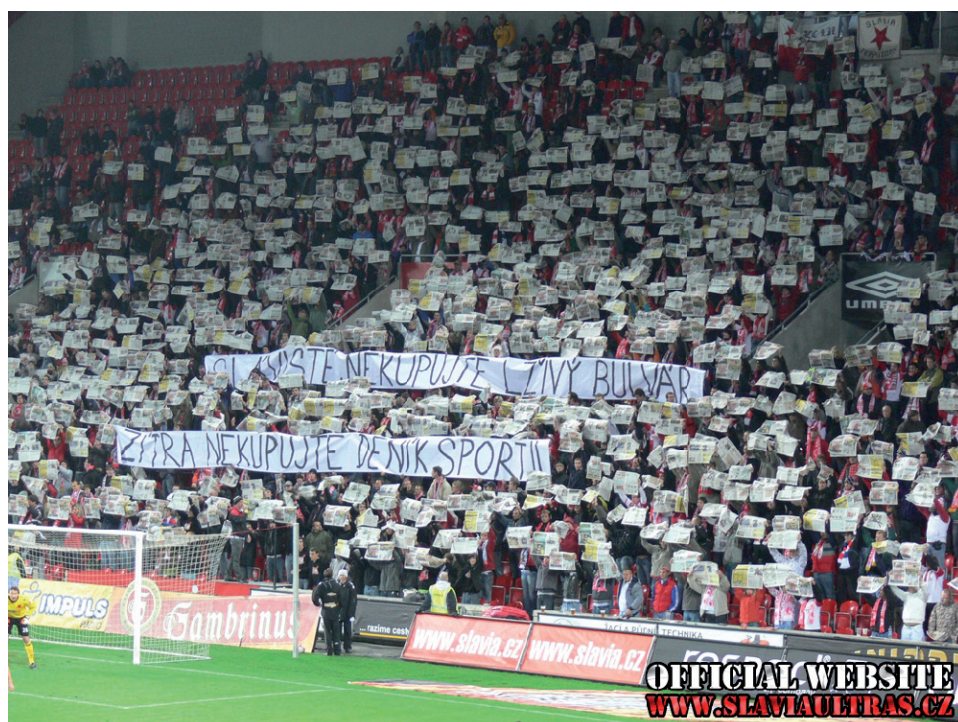
Obrázek č. 17. Choreografie fanoušků Slavie Praha nabádající všechny příznivce Slavie, aby nekupovali deník Sport, který podle nich vydává neobjektivní články.