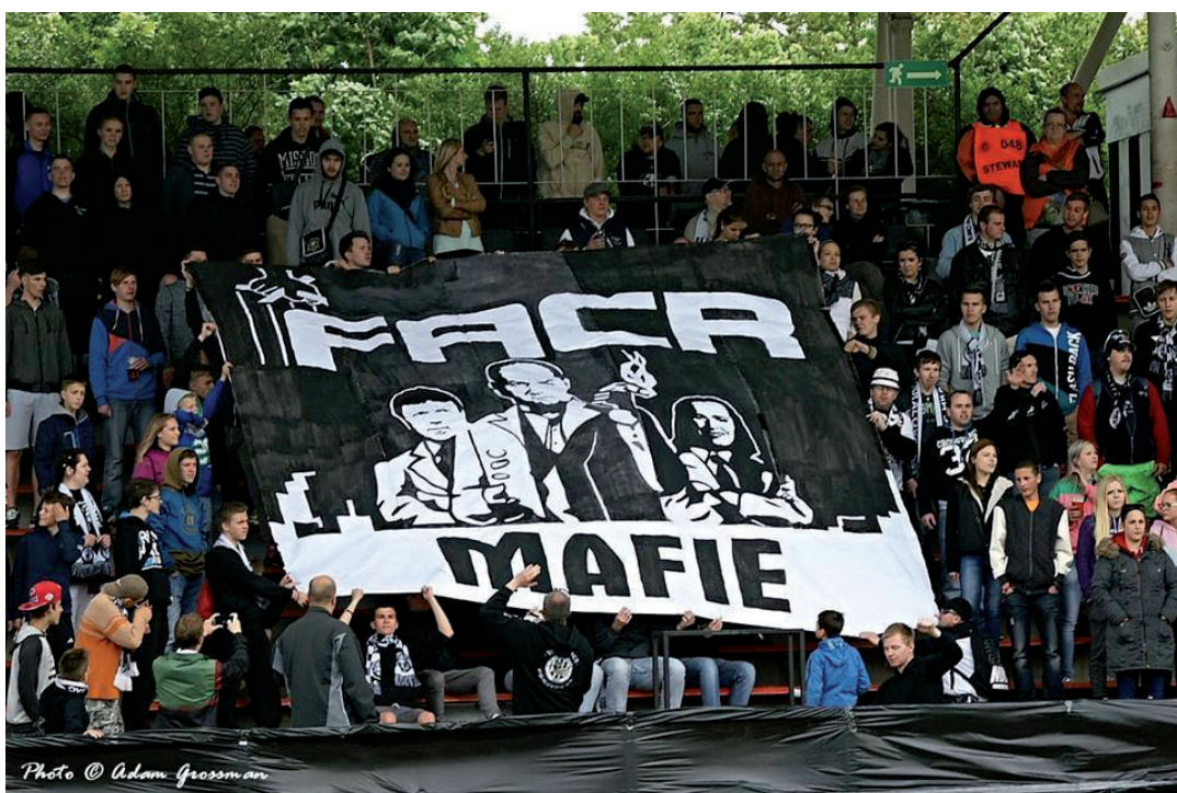
Obrázek č. 16. Choreografie proti Fotbalovému svazu vytvořená ultras Hradce Králové má upozorňovat na údajné nekalé praktiky, které ve vedení svazu panují.