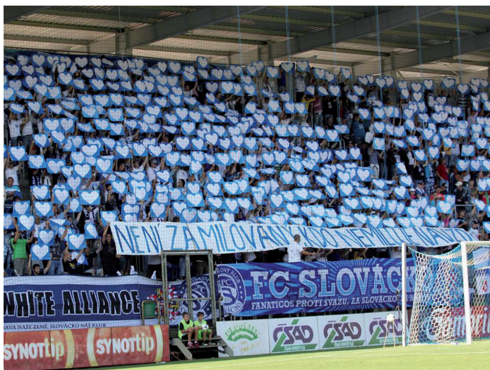
Obrázek č. 12. Velká tzv. kartoniáda, kterou vytvořili fanoušci 1. FC Slovácko, každý z nich drží nad hlavou papírové srdce, vše je ještě doplněno vysvětlujícím nápisem.