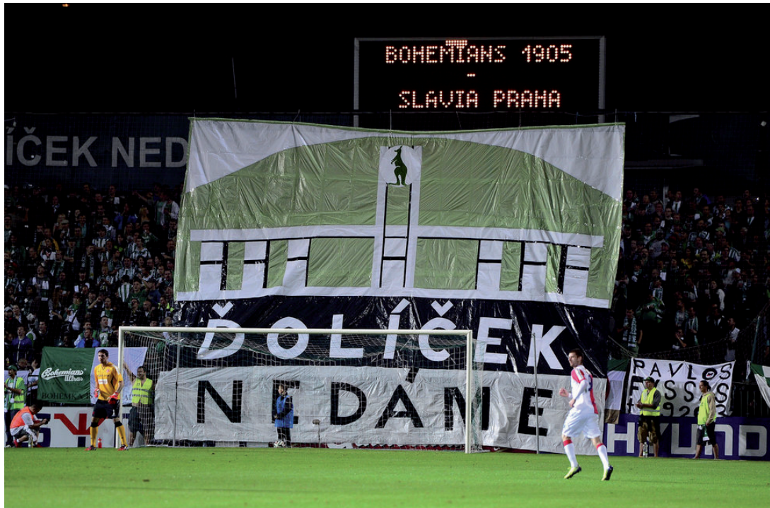
Obrázek č. 13. Choreografie na plachtě pověšené od střeby stadionu Bohemians Praha, která poukazuje na jejich kladný vztah k jejich domovskému stadionu.