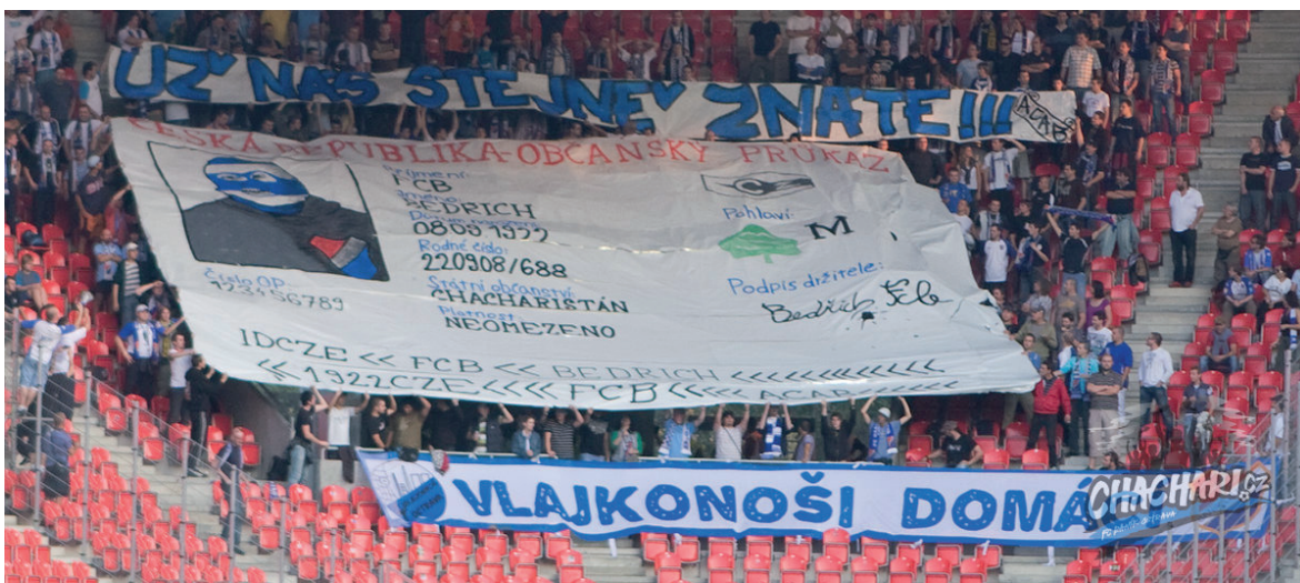
Obrázek č. 20. Choreografie příznivců Baníku Ostrava, kterou protestují proti zpřísněným bezpečnostním opatřením na fotbalových stadionech v České republice.