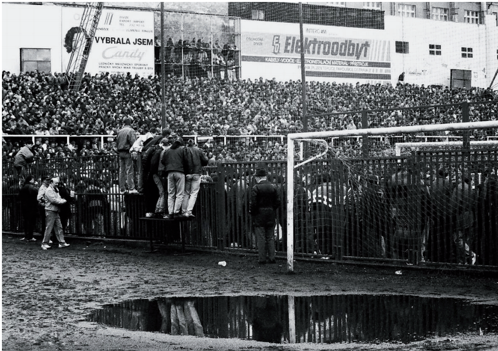
Obrázek č. 19. Návštěvnost na fotbale v minulosti – Viktoria Žižkov. Jedná se o fotografii z 60. let 20. století.