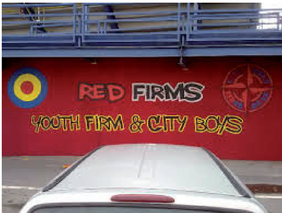
Obrázek č. 11. Graffiti z produkce fans Sparty Praha.