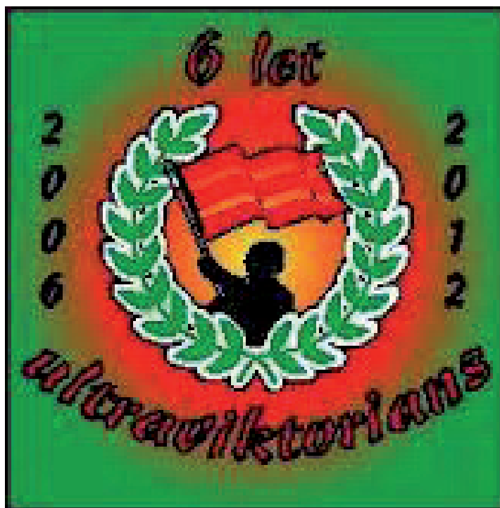
Obrázek č. 8. Samolepka, kterou vyrobili žižkovští ultras v roce 2012 k výročí šesti let svojí existence.