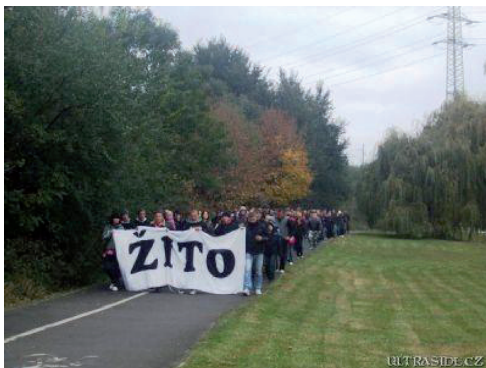
Obrázek č. 2. Pochod příznivců Plzně za tragicky zesnulého fanouška Žita.