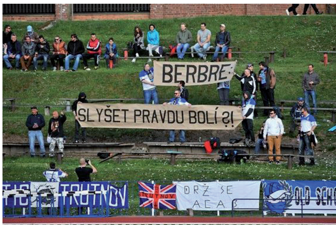
Obrázek č. 1. Operace Žumpa v podání fanoušků Trutnova (Divize C).