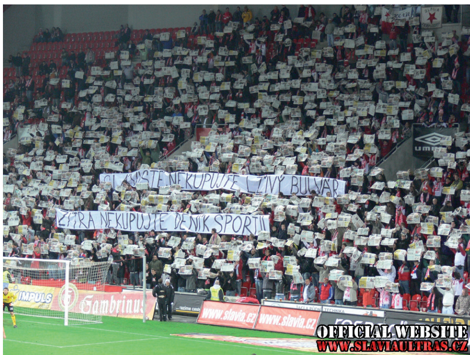
Obrázek č. 17. Choreografie fanoušků Slavie Praha nabádající všechny příznivce Slavie, aby nekupovali deník Sport, který podle nich vydává neobjektivní články.