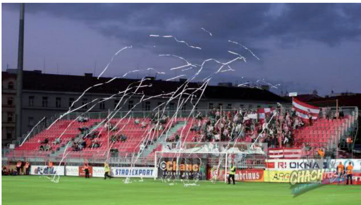
Obrázek č. 21. Fotografie letících konfet z kotle fanoušků Viktorie Žižkov.