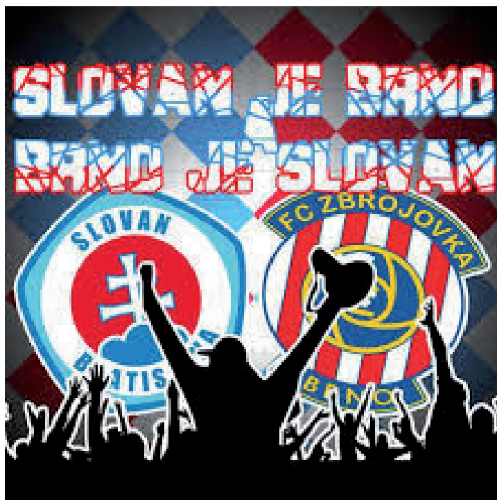
Obrázek č. 4. Samolepka reprezentující tzv. družbu fanoušků Slovanu Bratislava a Zbrojovky Brno.