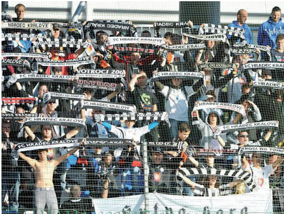
Obrázek č. 7. Klubová šála patří k nejtradičnějším fanouškovským předmětům, na obrázků hromadně vytažení šál v podání fanoušků Hradce Králové.