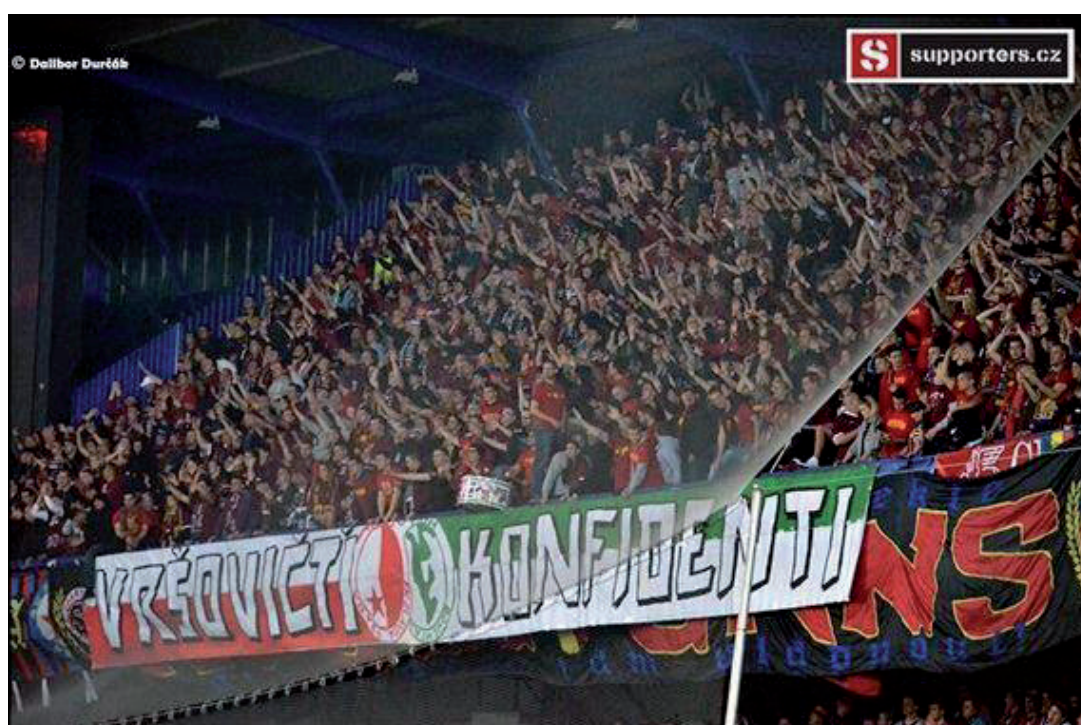
Obrázek č. 6. Choreografie fanoušků Sparty s tematikou hooligans, kde je kritizováno jejich údajné udavačství.