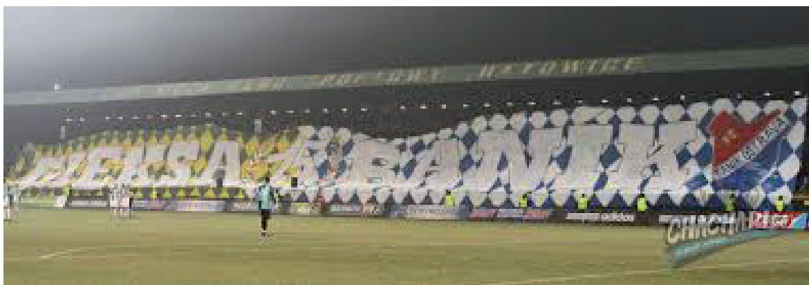
Obrázek č. 5. Velká choreografie oslavující družbu mezi fanoušky Baníku Ostrava a GKS Katowice.