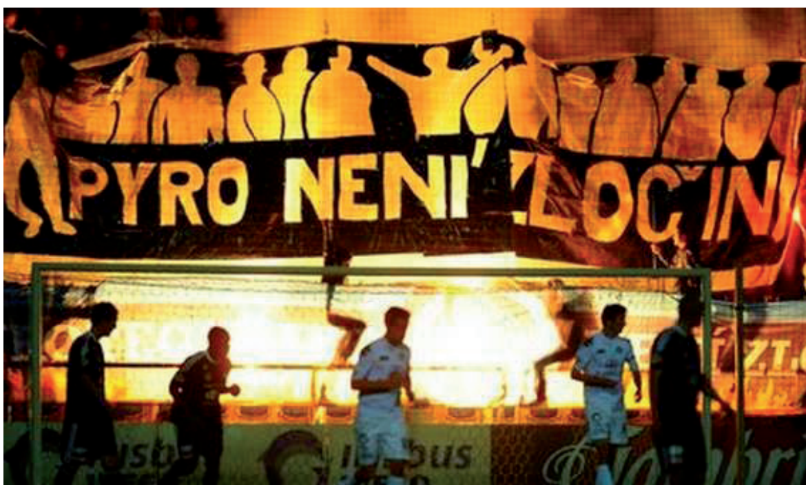
Obrázek č. 22. Pyrotechnika použitá fanoušky Slovácka.