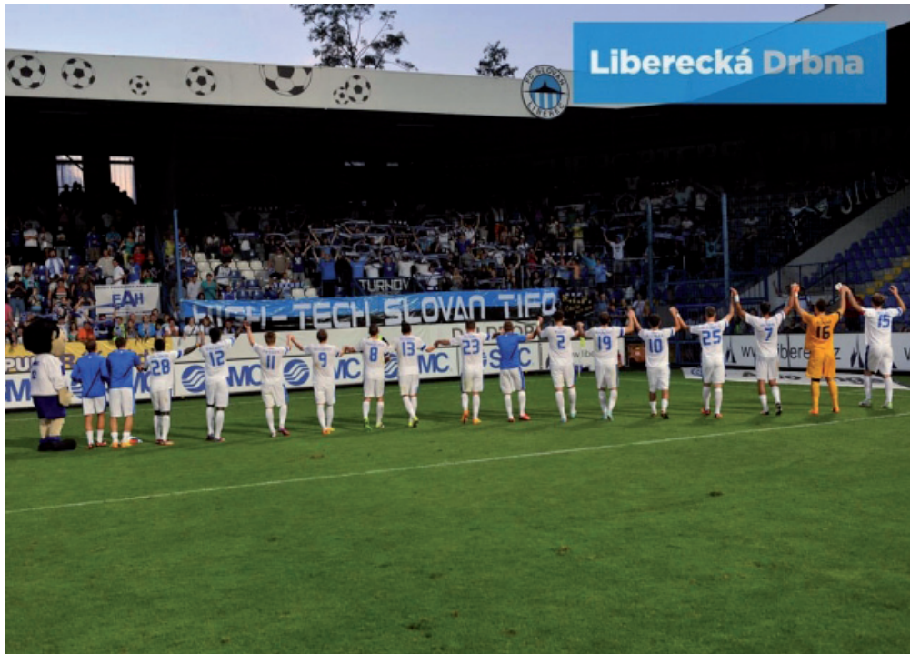
Obrázek č. 3. Tradiční děkovačka probíhající mezi hráči a fanoušky Slovanu Liberec.