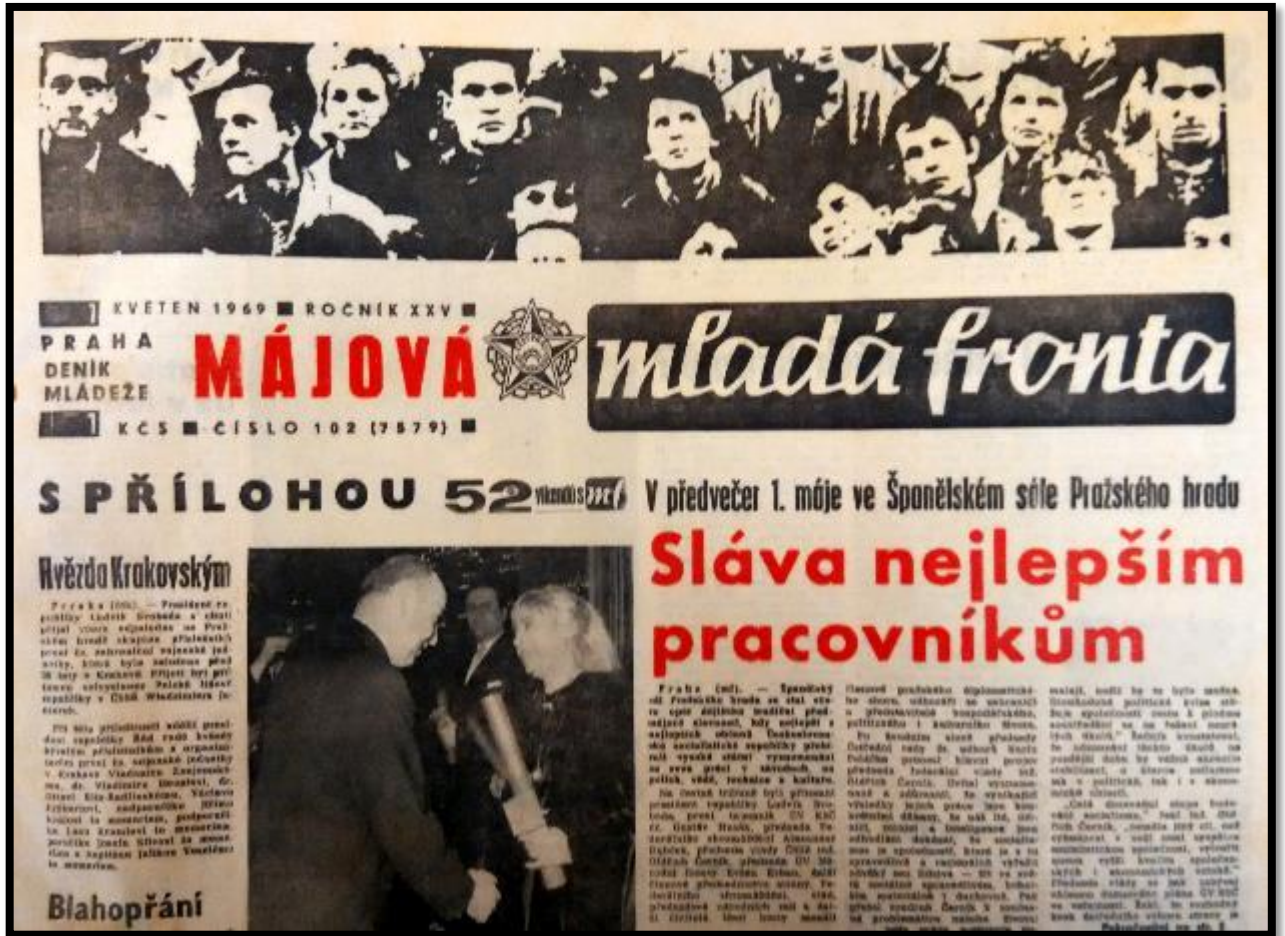
Obrázek 11 - Prvomájové vydání MF z roku 1969 s černým nádechem jako znak odporu