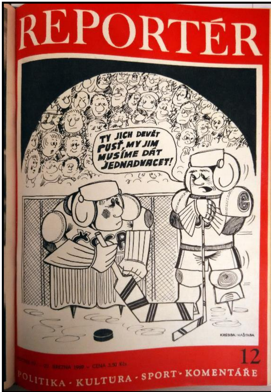
Obrázek 10 - Břežnové vydání Reportéra, které vyšlo po MS v ledním hokeji 1969