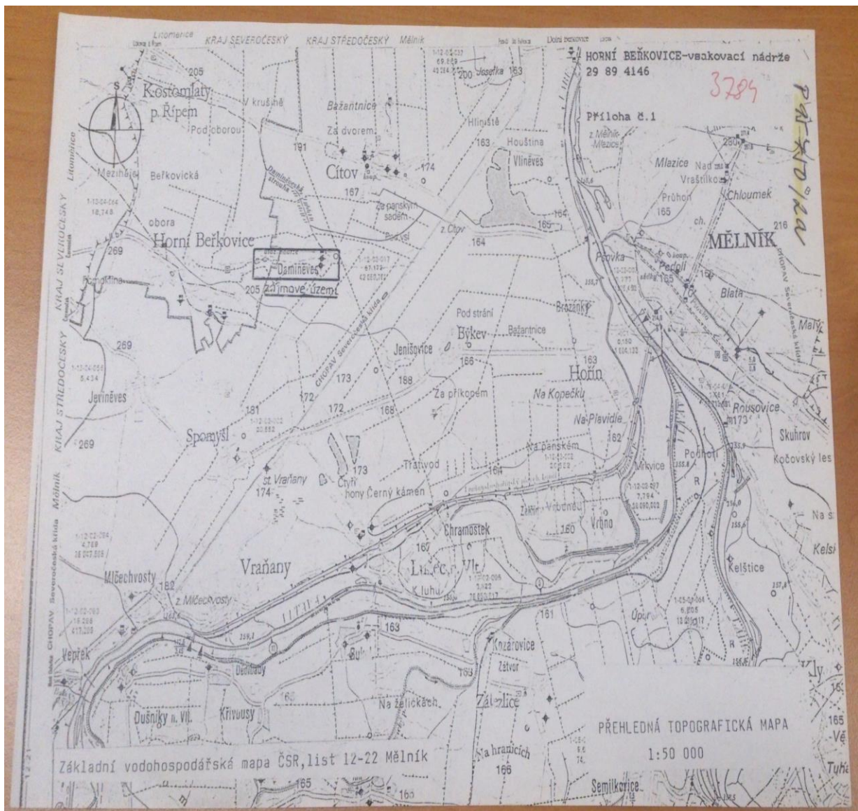
Příloha č. 1: Přehledná topografická mapa zájmového území v měřítku 1 : 50 000 (Pljasková, 1991)