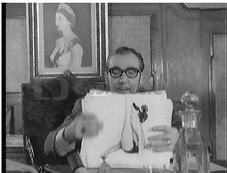
Obr. 7. Snímek PSÍČČCI LORDA CARLTONA je také zřejmou parodií cenzurních mechanismů nastupující normalizace v Československu. Natáčení snímku probíhalo v roce 1969 a jako jednomu z mála produkcí II. programu se podařilo získat povolení k natáčení v zahraničí – exteriérové záběry byly pořízeny v Londýně.