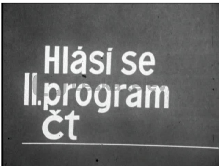
Obr. 14. HLÁSÍ SE II. PROGRAM ČT (1970) byl cyklus krátkých publicistických pořadů určených k propagaci vysílání II. programu mezi diváckou veřejností. Pořad byl vysílán před pátečními hlavními televizními novinami v prvních měsících roku 1970.