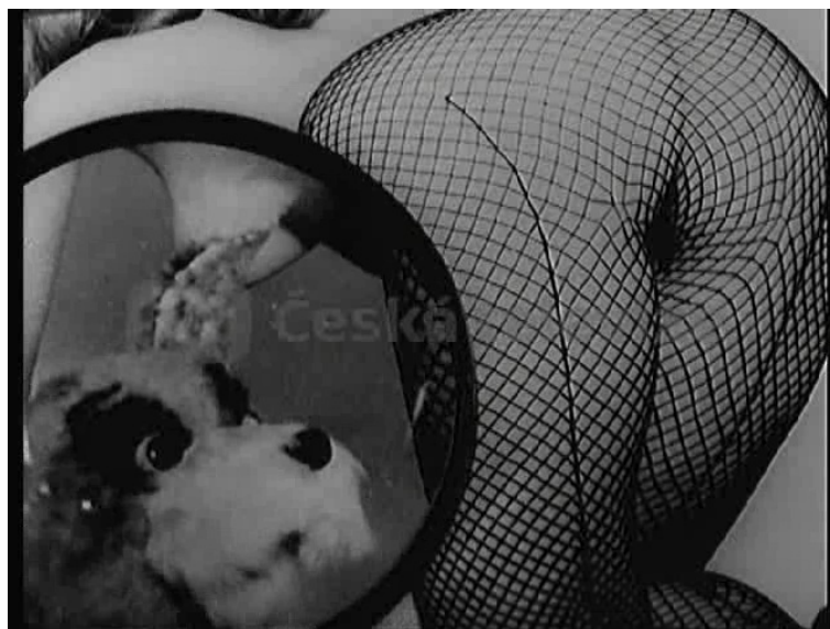
Obr. 6. PSÍČCI LORDA CARLTONA (Jiří Krejčík, 1970) Detail jedné z inkriminovaných fotografií, které dostane k posouzení královský cenzor lord Carlton (Miloš Kopecký). Erotický náboj snímku byl jedním z argumentů pro zákaz jeho dalšího uvedení na televizní obrazovce.