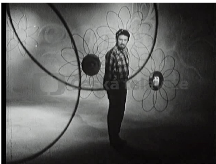
Obr. 13. Waldemar Matuška v jednom z televizních hudebních klipů, ze kterých se skládal hudebně zábavný pořad ČTVRT STOLETÍ V PÍSNI A TANCI III – JÁ MÁM KYTKY RÁD (I. Paukert, 1970). Pořad byl uveden ke slavnostnímu zahájení vysílání II. programu 10. května 1970.