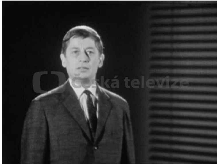
Obr. 11. Vyprávění na pokračování – PRAŽSKÁ OPERACE (1970). Šlo primárně rozhlasový formát upravený pro televizní vysílání, nejdůležitější složkou pořadu bylo vždy mluvené slovo. Herci či vybrané osobnosti televizním divákům předčítaly ukázky literárních děl či recitovali poesii.