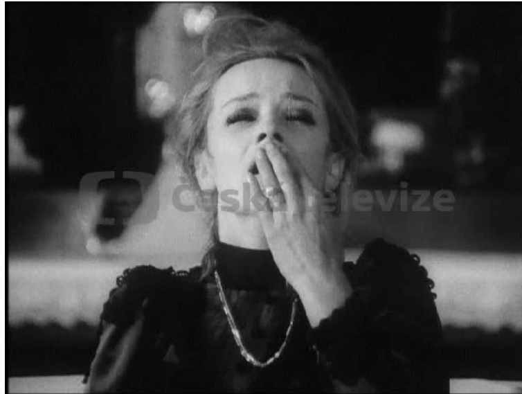
Obr. 3. Jana Brejchová v hlavní ženské roli snímku ROMANETTO, jejími hereckými partnery byli Vlastimil Brodský, Jan Kačer a Jiří Adamíra.

psychického zhroucení. Skrze roztříštěnou naraci, stylizaci obrazové složky a důraz na mimické herectví (podpořený absencí dialogů a užitím velkých detailů) snímek dosahuje introspektivního pohledu na psychický rozpad hlavní ženské hrdinky, která trpí výčitkami svědomí po domnělé manželské nevěře.