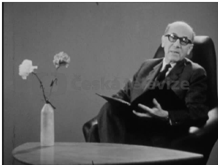
Obr. 12. Vyprávění na pokračování – PRAŽSKÁ OPERACE vznikla podle memoárů maršála Koněva a je zástupcem politicky angažované tvorby II. programu ČST po květnu 1970.