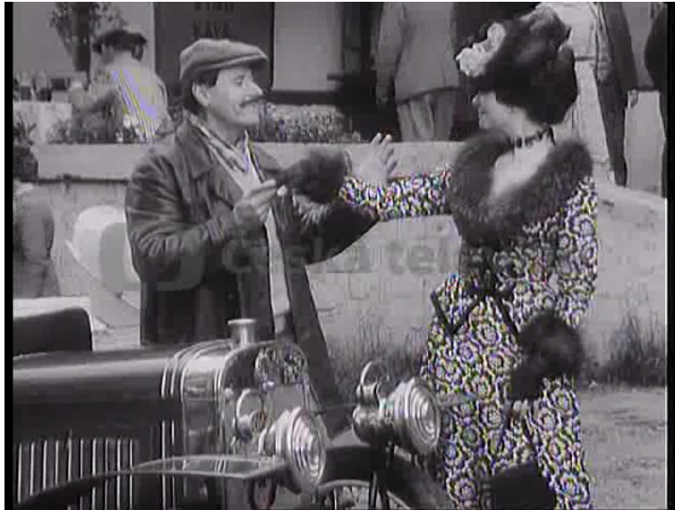
Obr. 17. Kostýmní kabaretní zpěvohra LÁSKY EMANUELA PŘIBYLA (Z. Podskalský, 1969) podle scénáře J. Dietla.