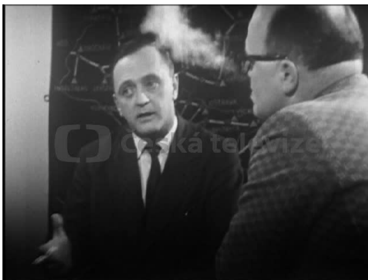
Obr. 19. Bývalý ÚŘ ČST Adolf Hradecký sděluje divákům plán na zahájení vysílání II. programu v roce 1965 v pořadu KDO ZA TO MŮŽE? (Čs. televize, 1961).