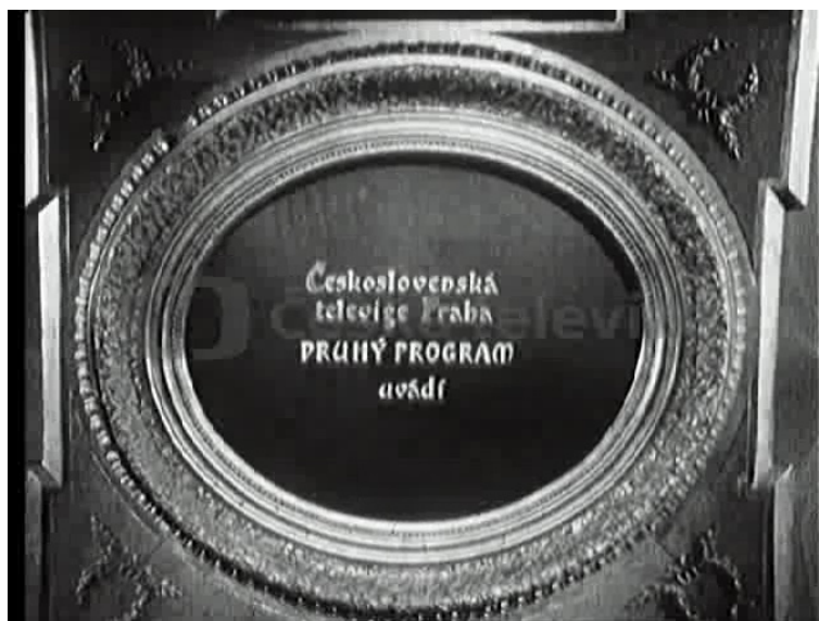
Obr. 23. Pořady II. programu byly vždy uváděny za celek redakce, nikoliv s příslušností ke konkrétnímu jejímu vysílání.

Prohlášení: všechny přiložené obrázky jsou snímky obrazu z citovaných pořadů pořízené autorkou diplomové práce. Snímky byly pořízeny výhradně pro potřeby této diplomové práce a veškerá autorská práva jsou v držení České televize.