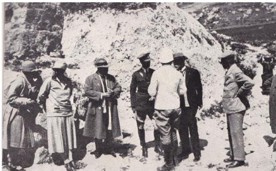
Obr. 2. – Tomáš Garrigue Masaryk na návštěvě v Rišon Lecion

Zdroj: RYCHNOVSKY A., Masaryk a židovství, str. 288.