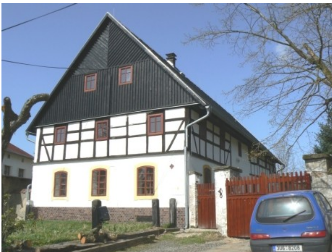
3 b) Velké Chvojno (okr. Ústí nad Labem), č. p. 12.