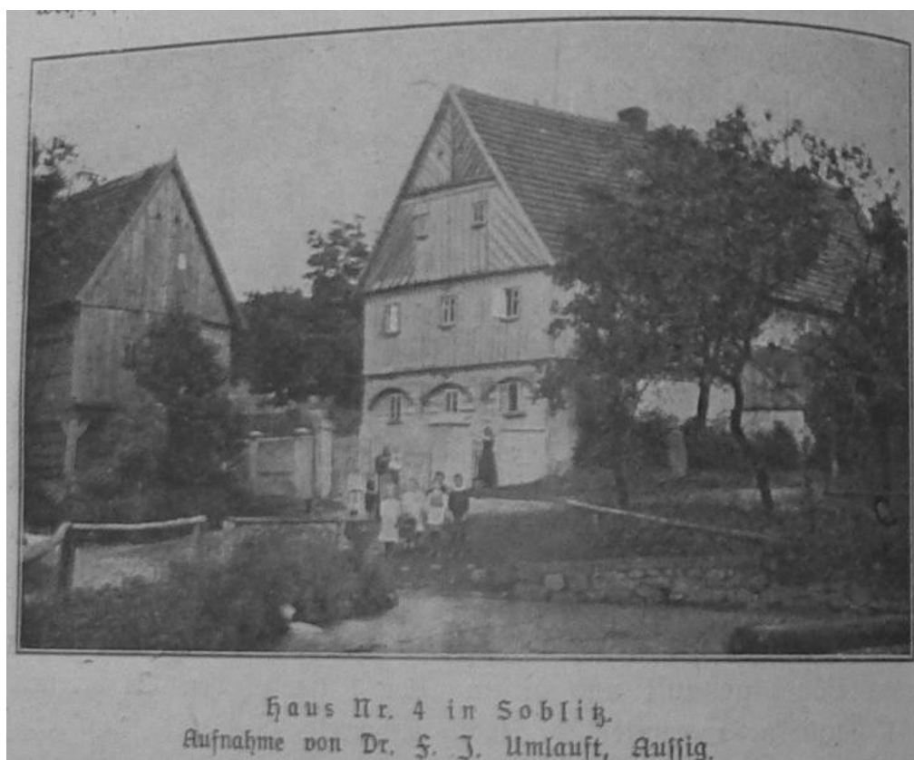
5 a) Sovolusky (okr. Ústí nad Labem), č. p. 4.