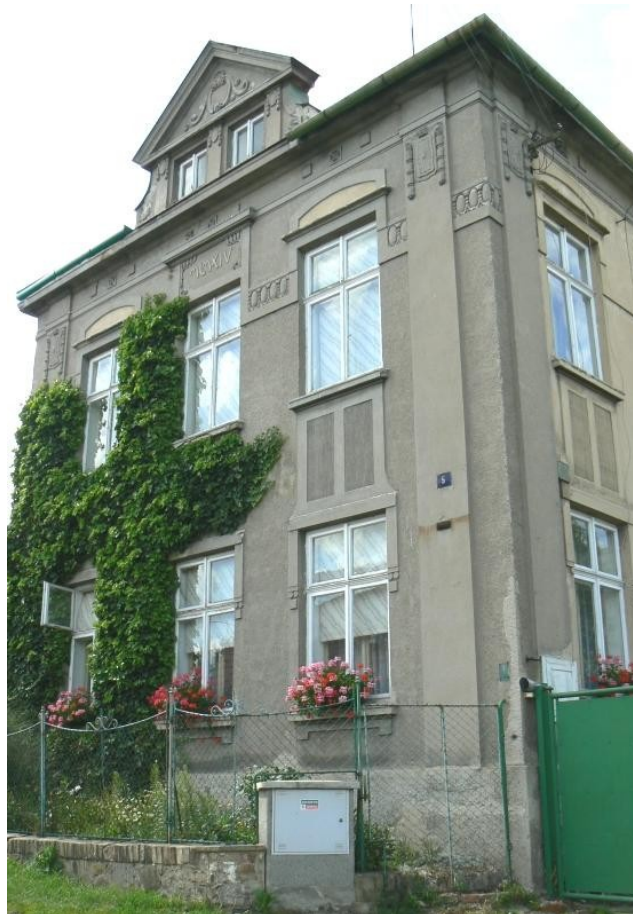
7 c) Maškovice (okr. Litoměřice) č. p. 5, datace 1914.