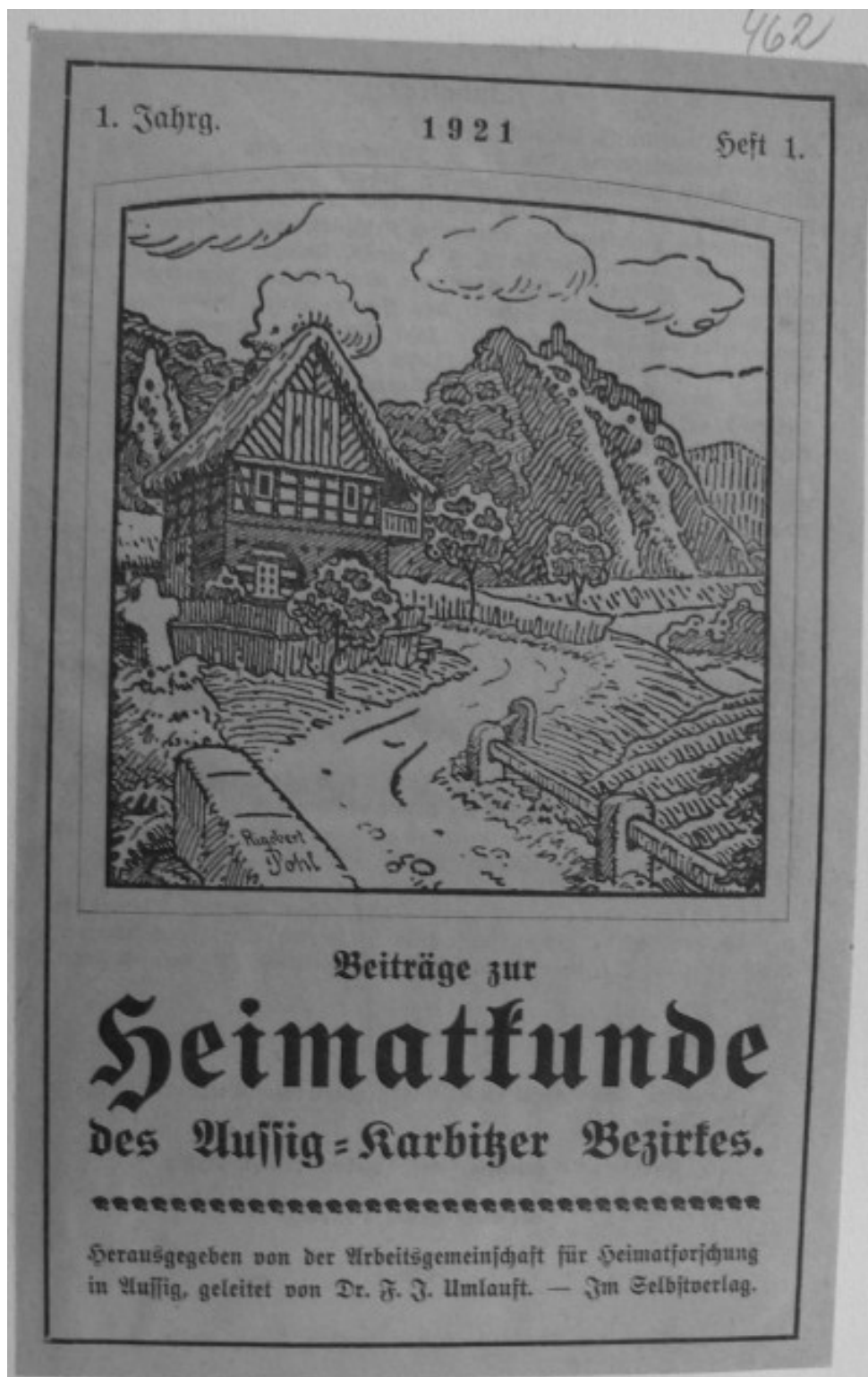
10 a) Obálka vlastivědného sborníku Beiträge zur Heimatkunde des Aussig-Karbitzer Bezirkes, 1921.