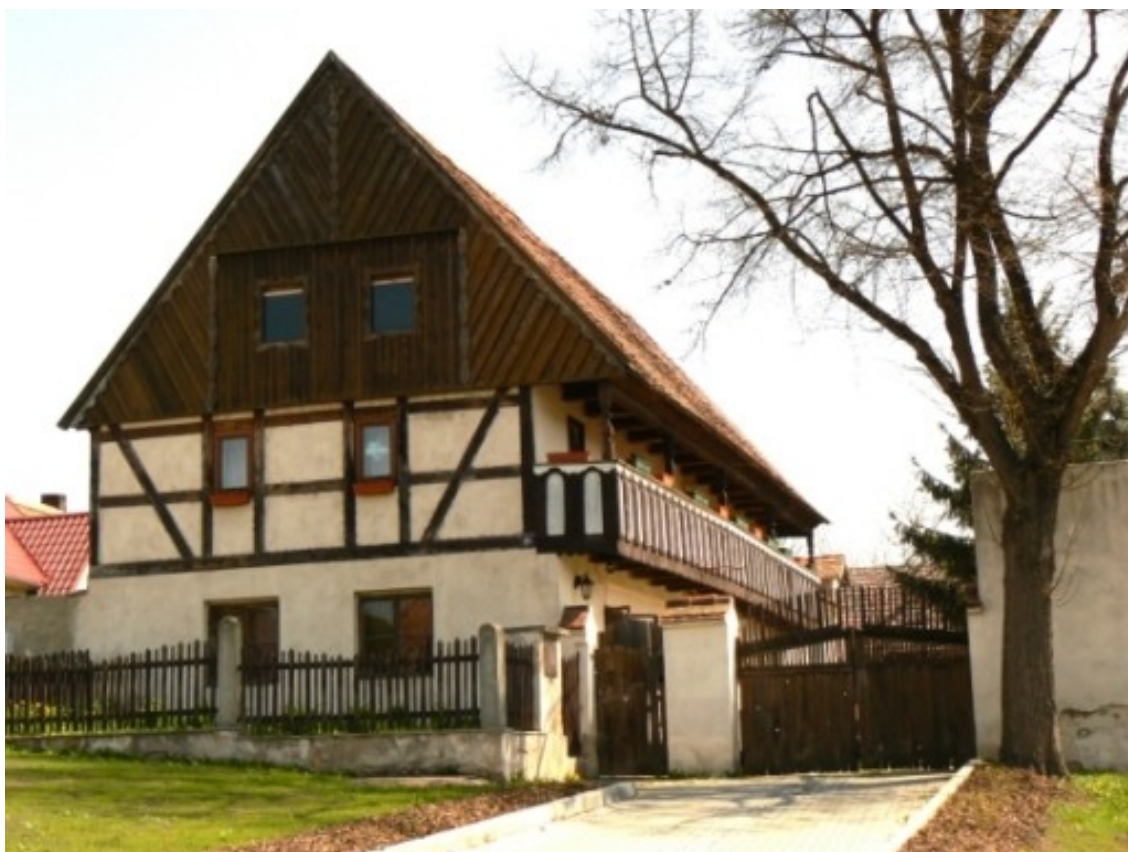
2 a) Mirošovice (okr. Teplice), č. p. 21.