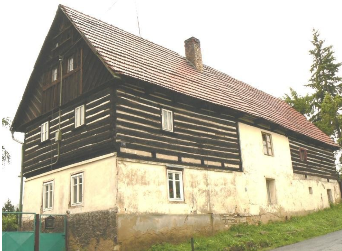
7 d) Maškovice (okr. Litoměřice) čp. 10.