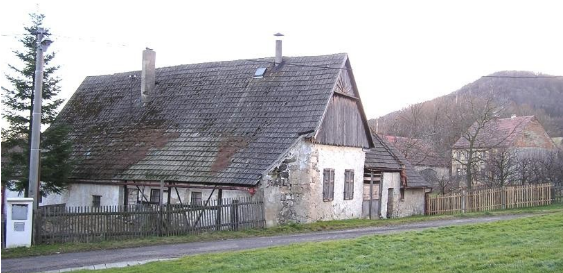
9 b) Staňkovice (okr. Litoměřice) č. p. 16.