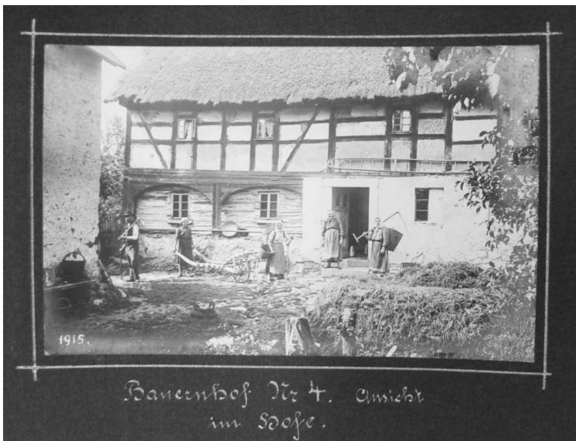
6 a) Lipová (okr. Ústí nad Labem) č. p. 4 v r. 1915.