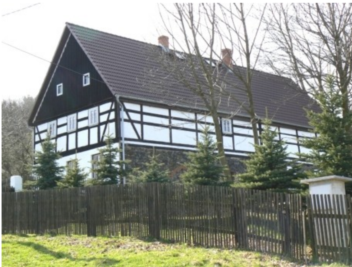
3 a) Arnultovice (okr. Ústí nad Labem), č. e. 100.