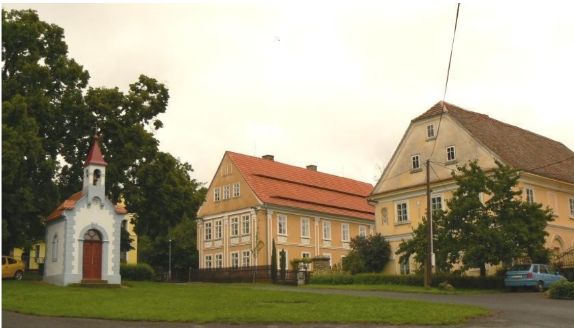
8 b) Dolní Nezly (okr. Litoměřice) návės II.