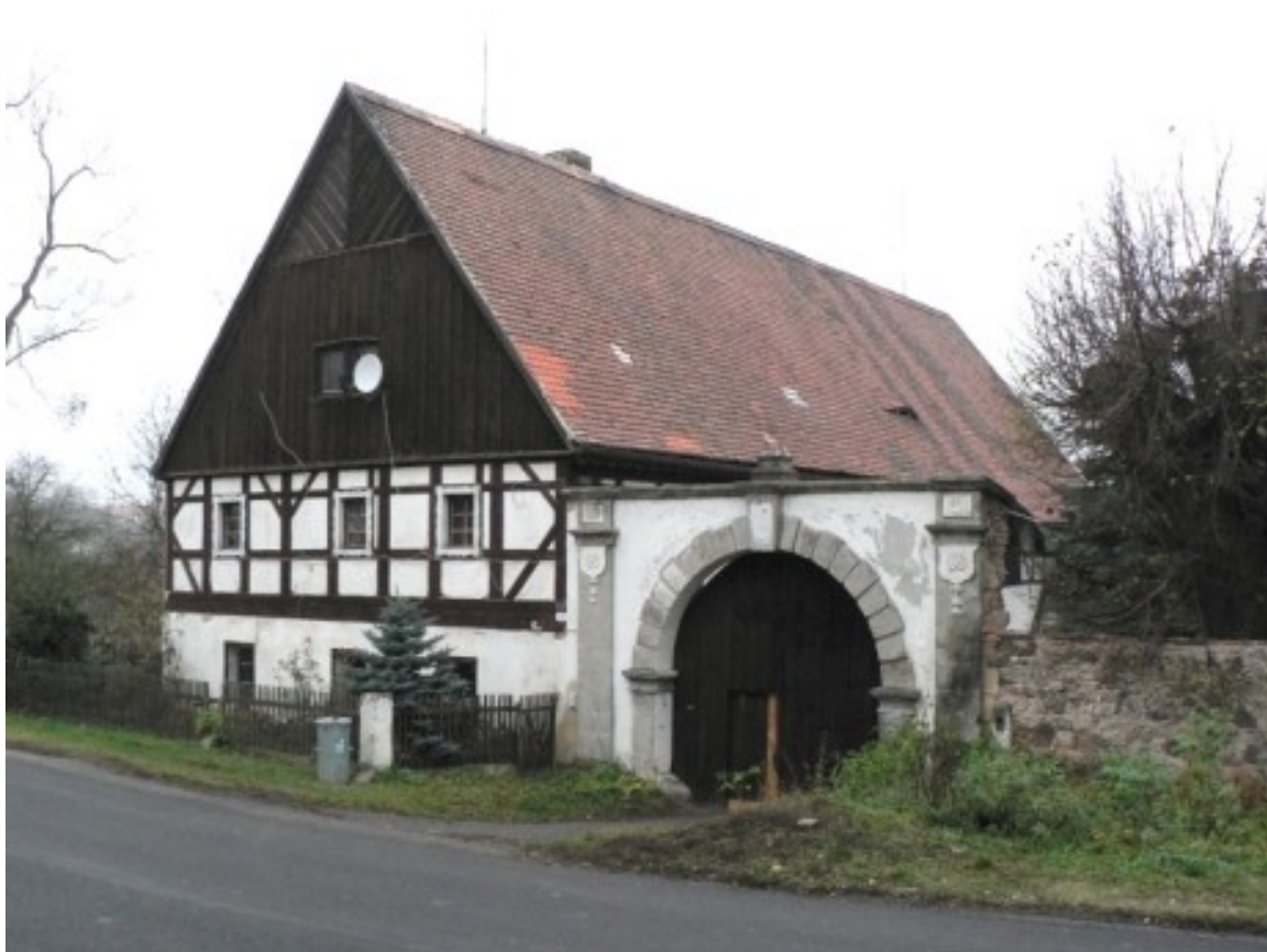
2 d) Žim (okr. Teplice), č. p. 9 s datací 1792 na klenáku brány.