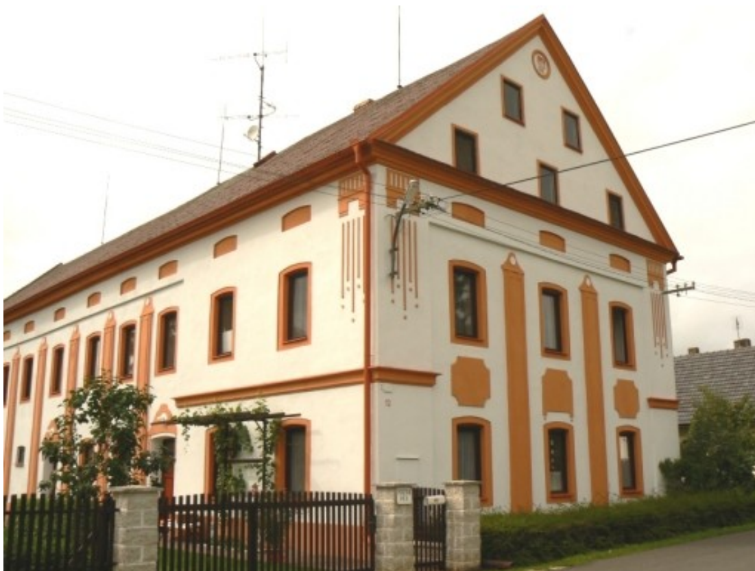
8 f) Třebutičky (okr. Litoměřice) č. p. 12.