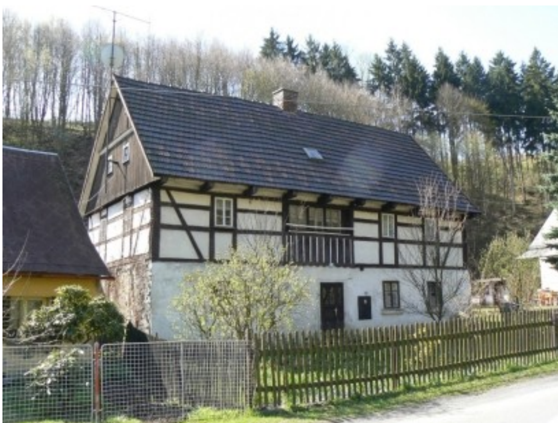
4 b) Heřmanov (okr. Děčín), č. p. 229.