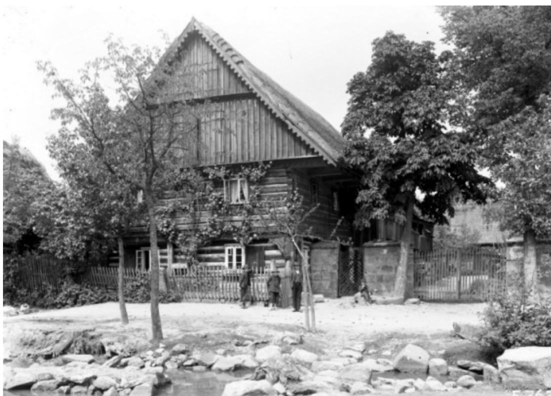
5 b) Habří (okr. Ústí nad Labem) v r. 1914.