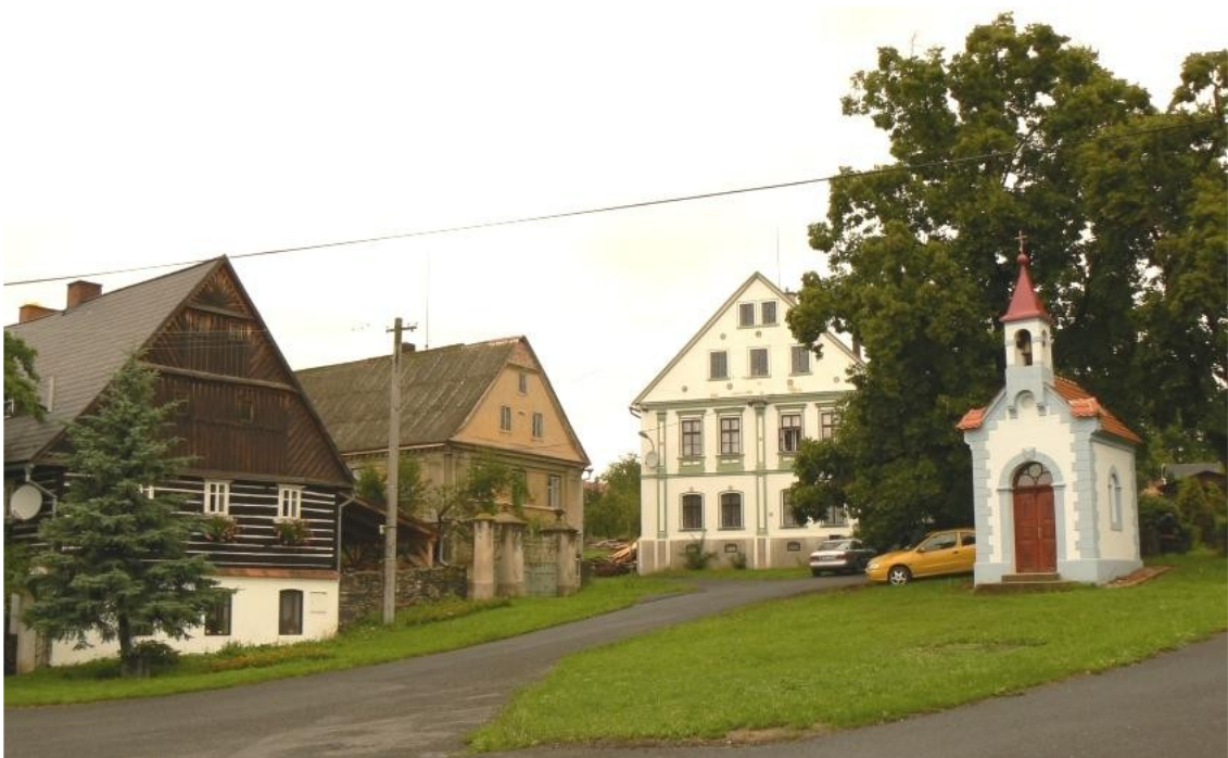
8 a) Dolní Nezly (okr. Litoměřice) návės.