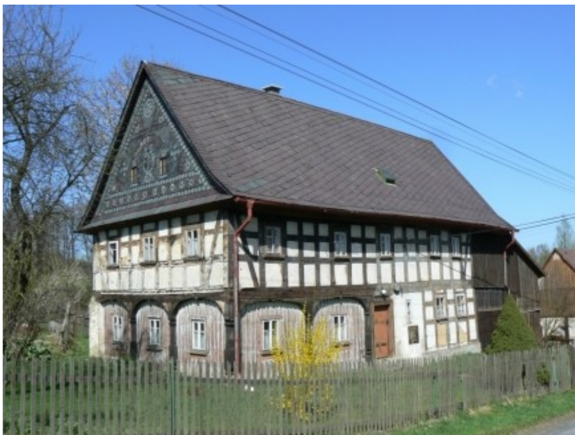
4 a) Huntířov (okr. Děčín), č. e. 3.