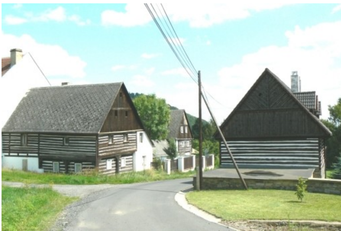
5 d) Řepčice (okr. Litoměřice), návės.