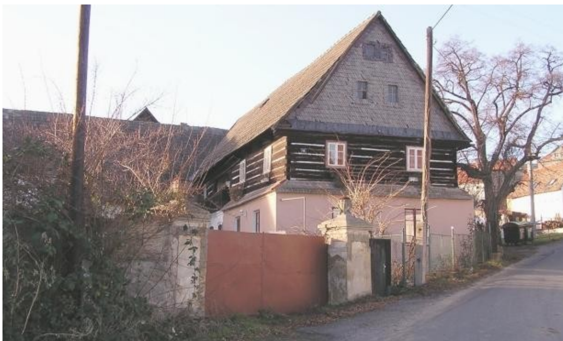
7 f) Maškovice (okr. Litoměřice) č. p. 18.