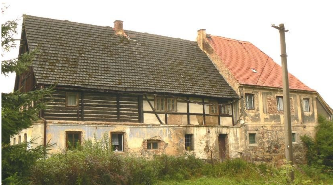
9 d) Haslice (okr. Ústí nad Labem) č. p. 1.