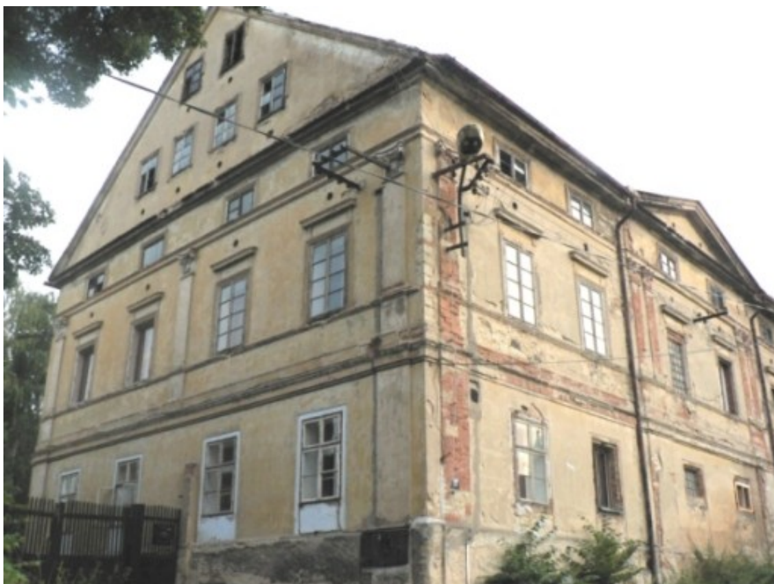
8 c) Srdov (okr. Litoměřice) č. p. 26.