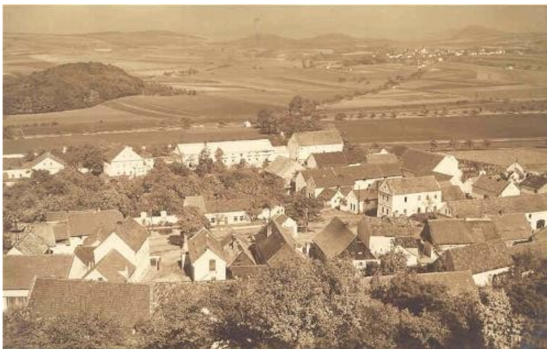
1 b) Bělúšice (okr. Most), kolem r. 1930.