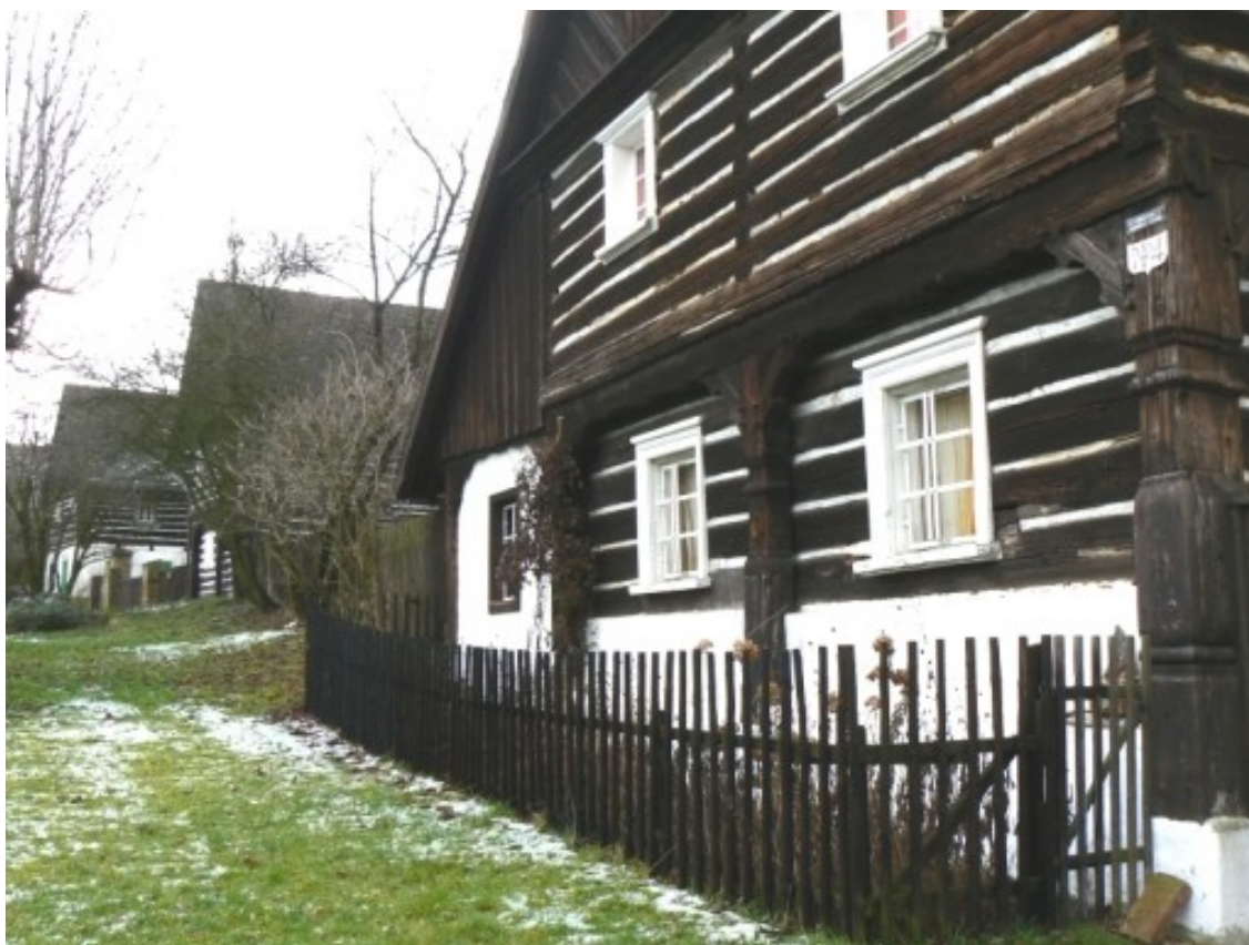
5 c) Lhota u Úštěka (okr. Litoměřice), č. p. 4.