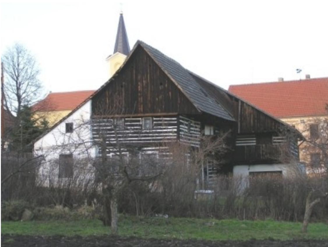
9 a) Staňkovice (okr. Litoměřice) č. p. 3.