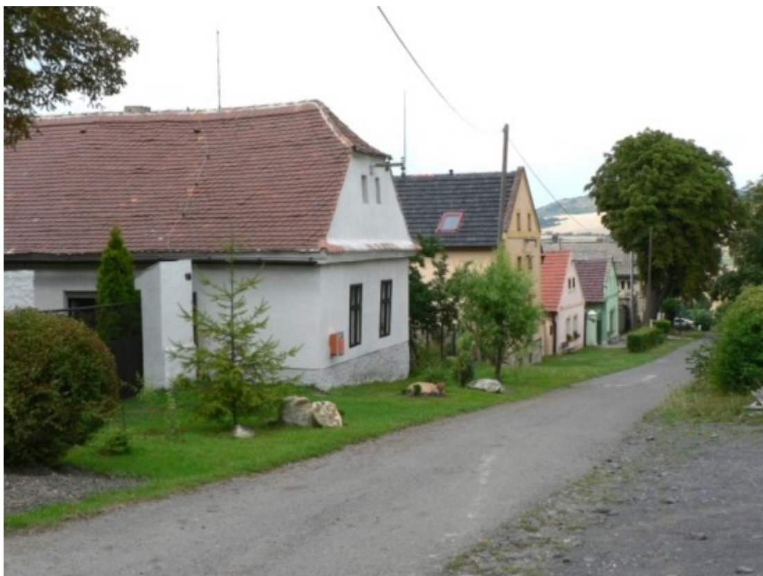
1 e) Mnichov (okr. Louny), jádro obce.