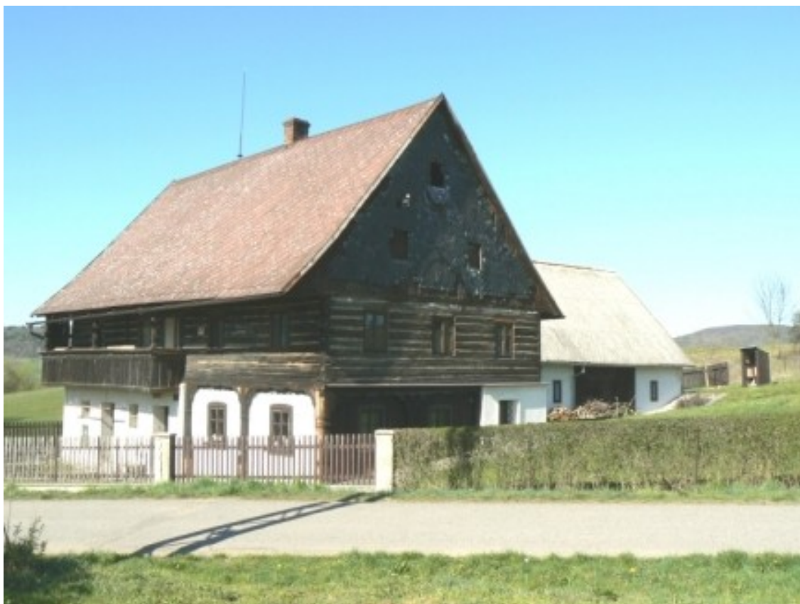
9 c) Kravaře (okr. Česká Lípa), Nádražní 1.