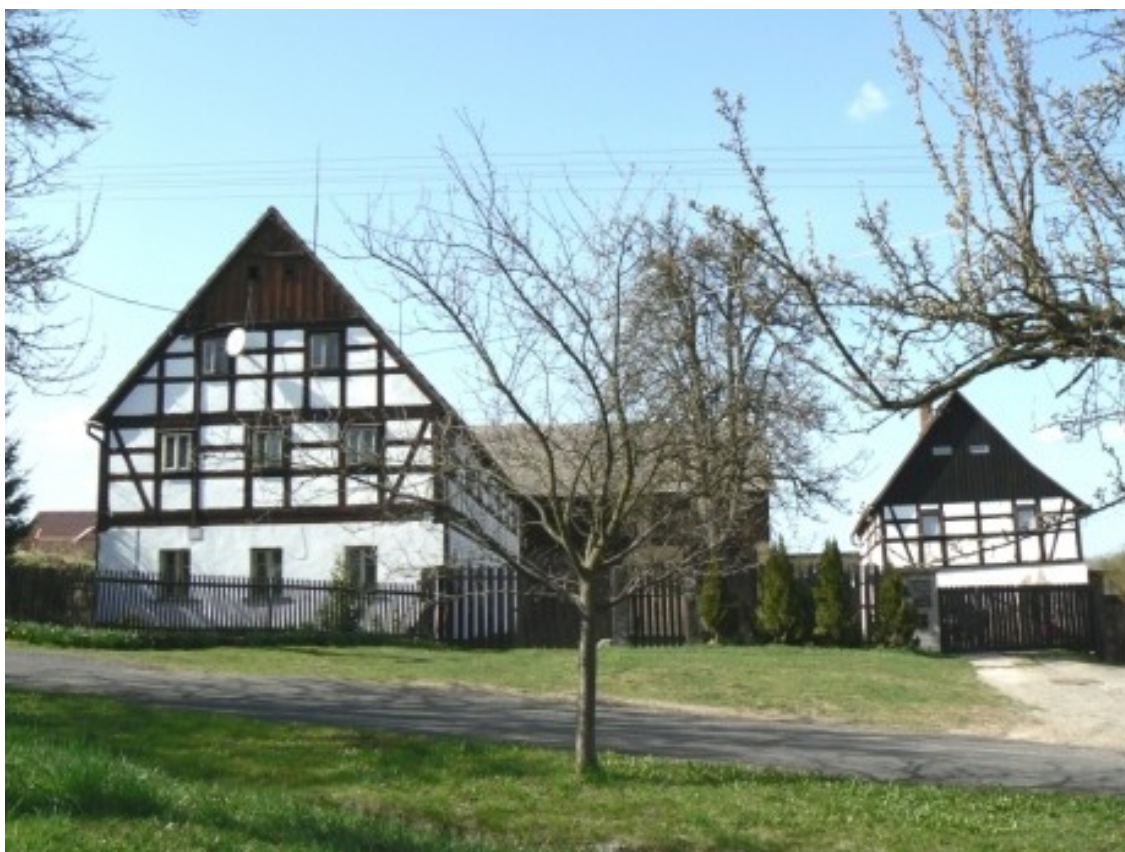
3 c) Radešín (okr. Ústí nad Labem), č. p. 11.