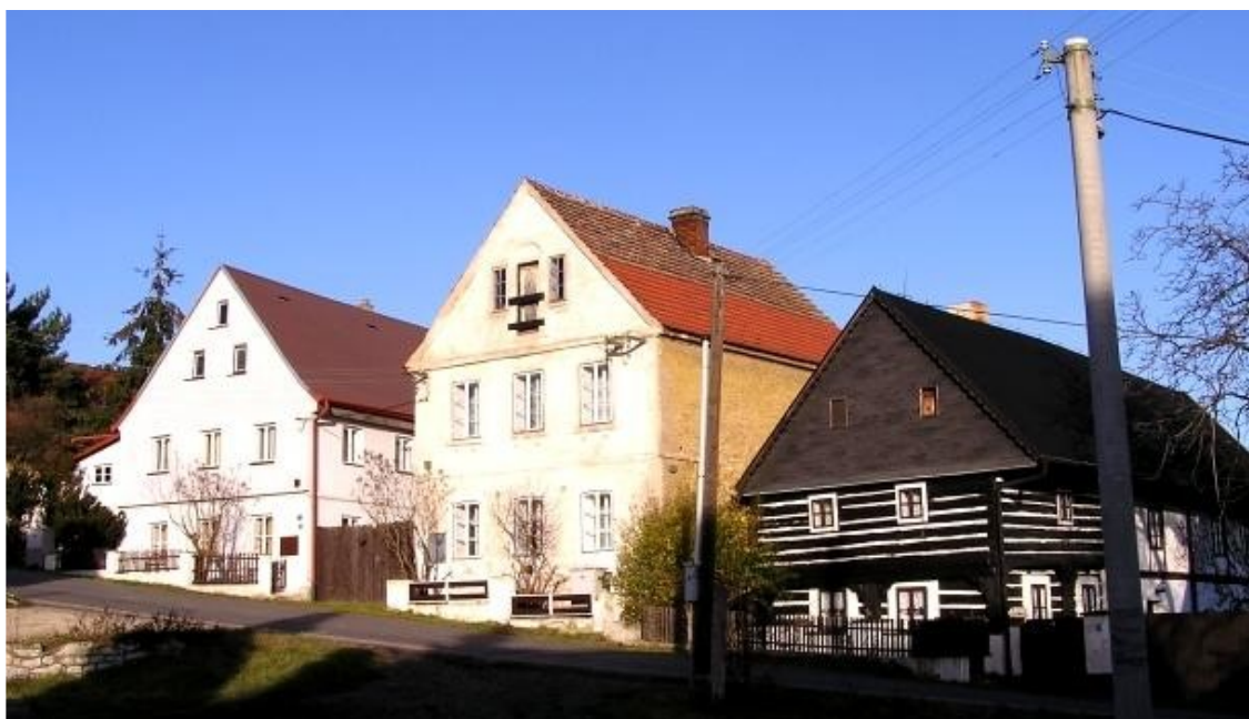
7 a) Maškovice (okr. Litoměřice) č. p. 1 a 2.