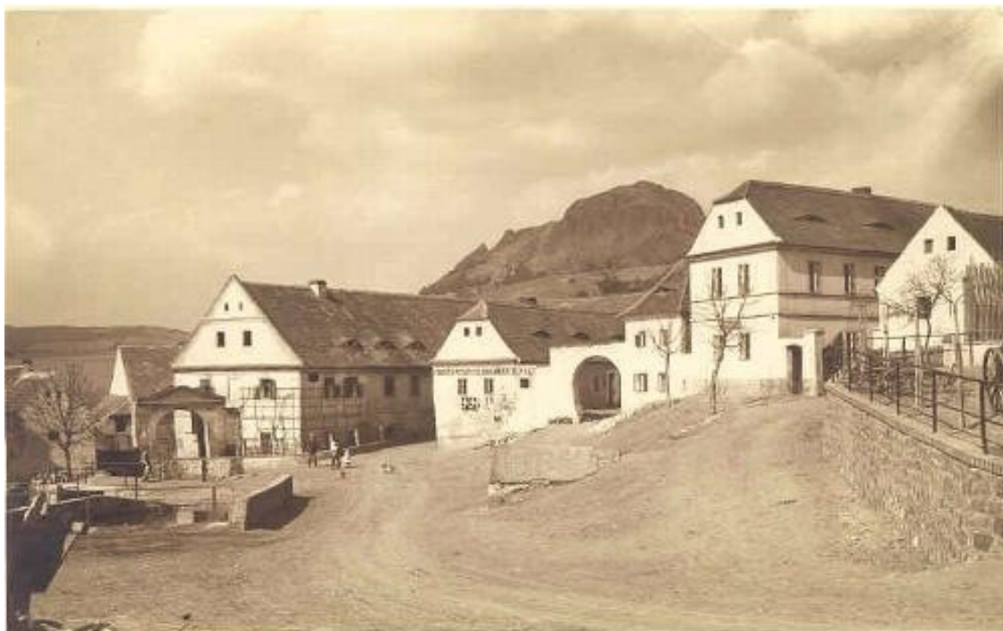
1 a) Chouč (okr. Teplice), kolem r. 1930.