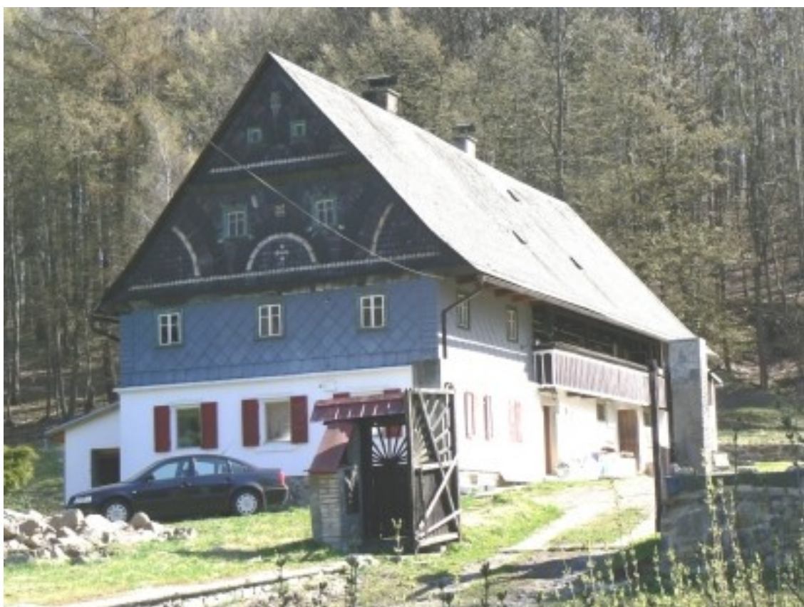
4 d) Fojtovice (okr. Děčín), č. p. 17.