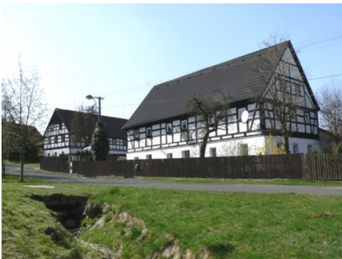
3 d) Radešín (okr. Ústí nad Labem), č. p. 12.