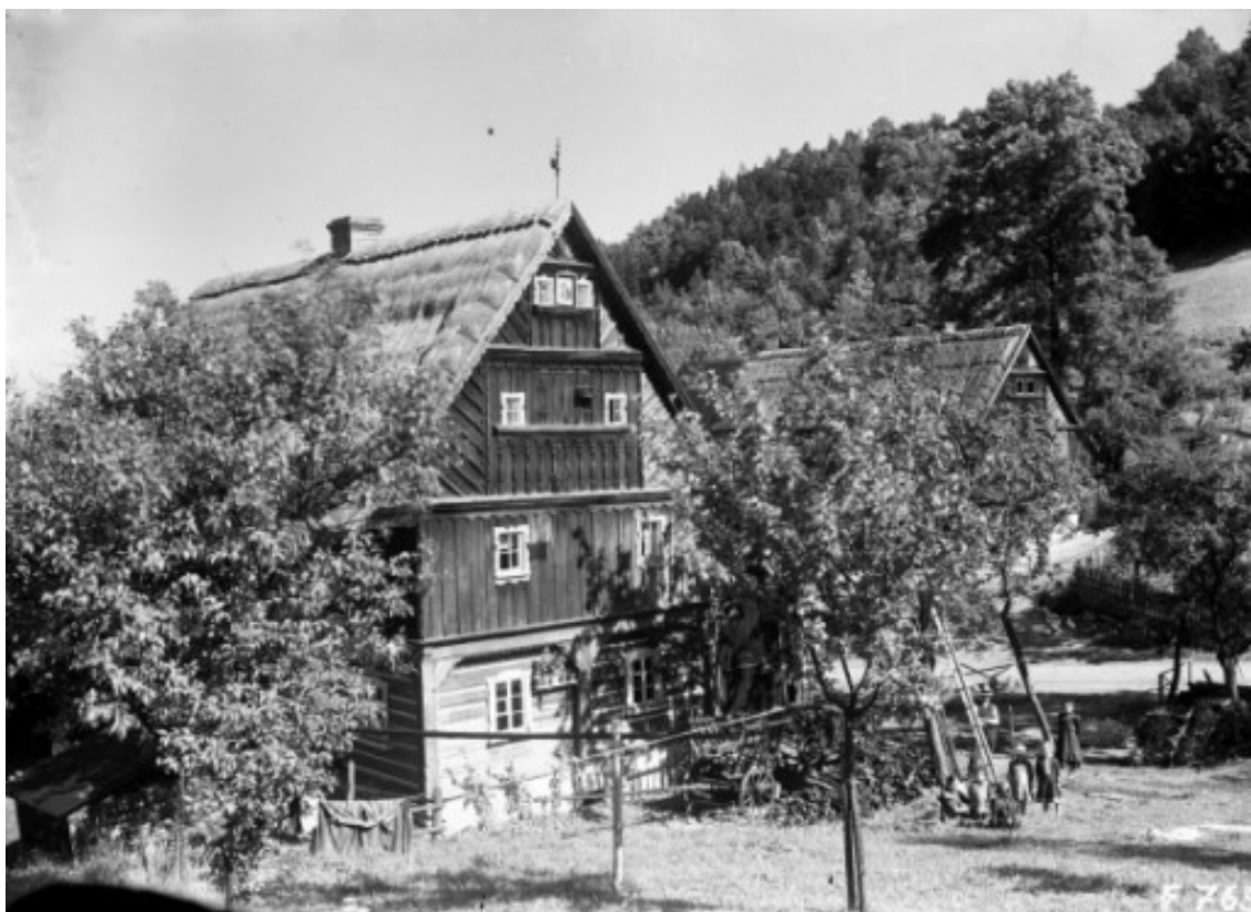
4 c) Rychnov (okr. Ústí nad Labem) v r. 1914.