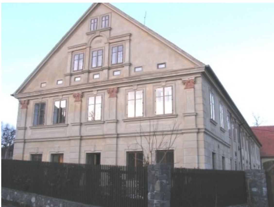
8 d) Staňkovice (okr. Litoměřice) č. p. 10, datace 1882.