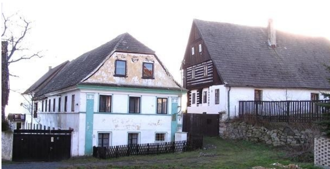
7 e) Maškovice (okr. Litoměřice) č. p. 17, datace 1845, a č. p. 16.