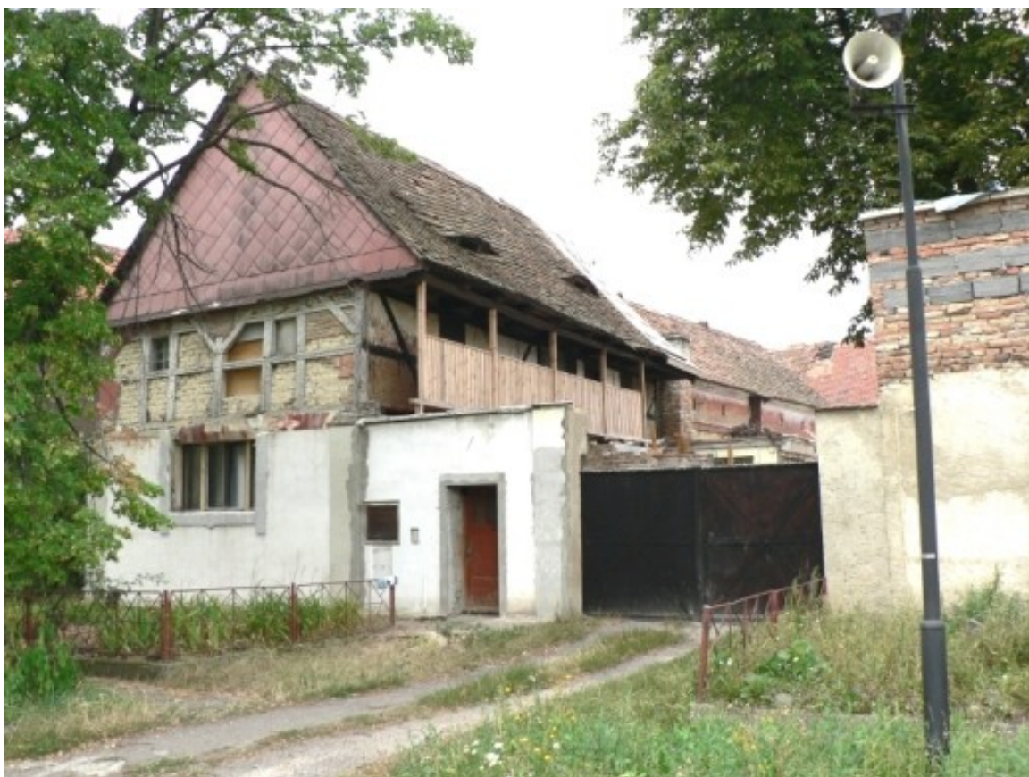
2 c) Židovice (okr. Louny), č. p. 6.