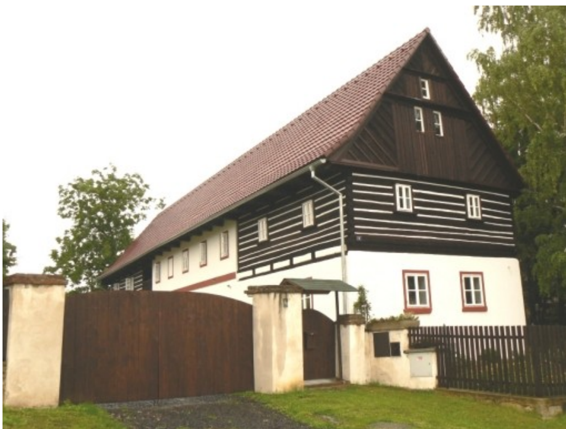
7 b) Maškovice (okr. Litoměřice) č. p. 4.