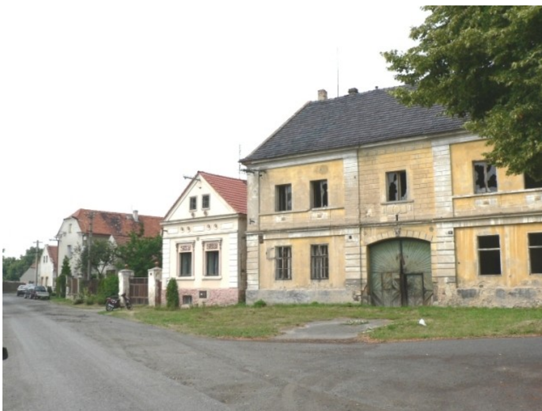
1 f) Libčeves (okr. Louny), Lipová ulice.