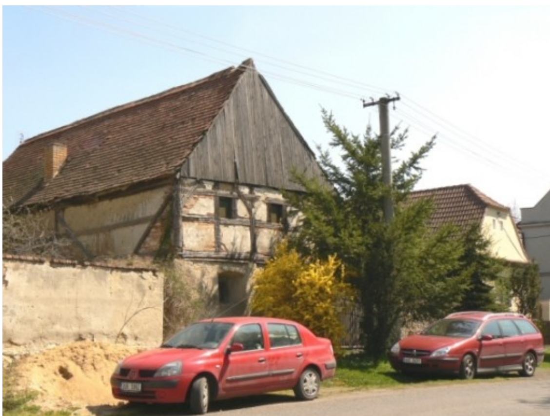
2 b) Žichov (okr. Teplice), č. p. 33 na návsi.