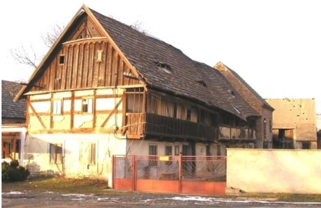
5 e) Třebenice (okr. Litoměřice), č. p. 18.