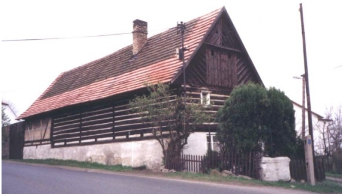
6 b) Žitenice (okr. Litoměřice) č. p. 129.