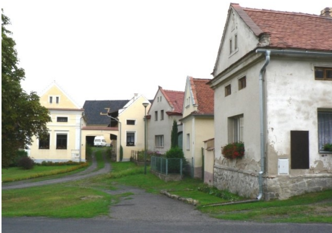
1 c) Charvatce (okr. Louny), návės.