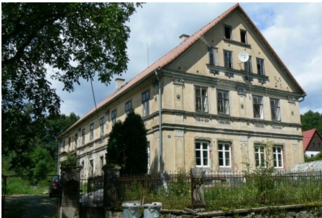
8 e) Dolní Šebířov (okr. Litoměřice) č. p. 18.