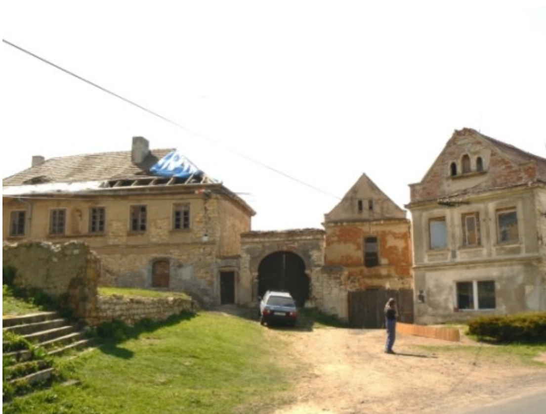
1 d) Kozly (okr. Louny), č. p. 5 a č. p. 6 na návsi.