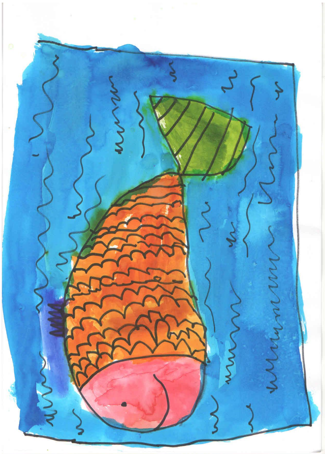
Zdařilá kresba šestileté dívky „Co děláš, než přijde Ježíšek?“ představuje kapra, kterého měli před Ježíškem doma ve vaně a pak ho snědli.