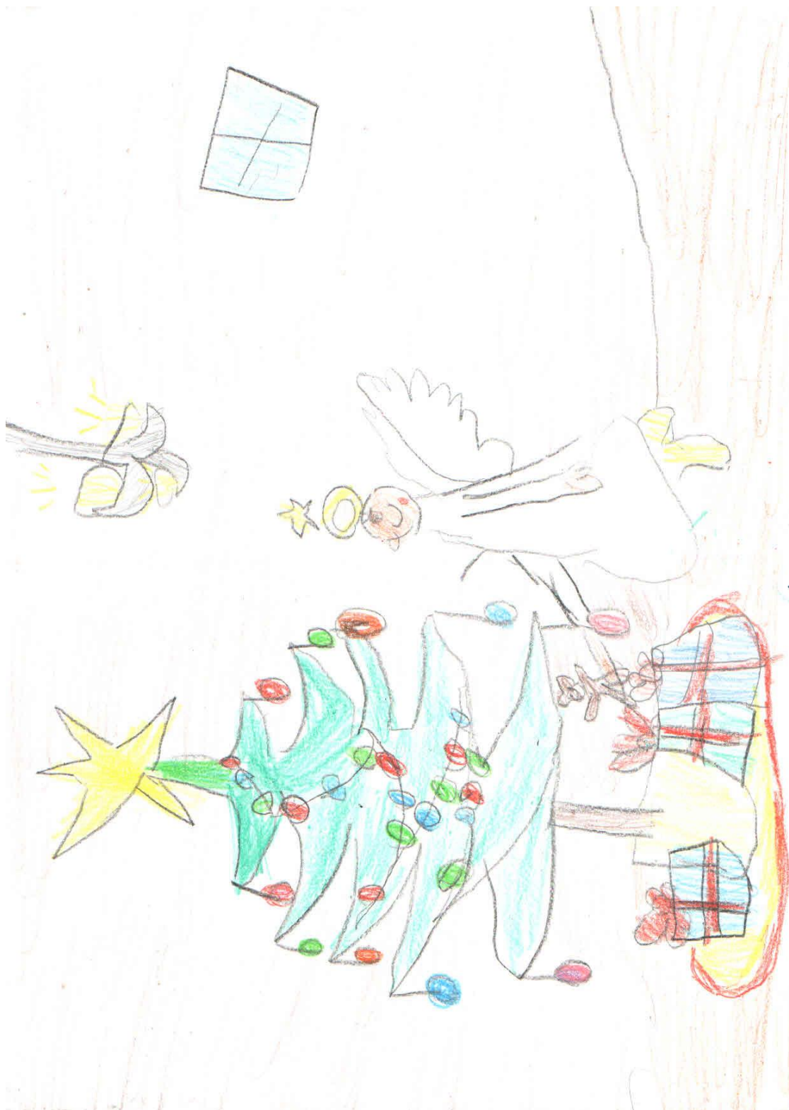
Nejzdařilejší kresba šestiletého chlapce „Co děláš, když přijde Ježíšek?“ představuje štědrovečerní nadílku. Dárky podle dětského malíře přináší pod stromeček anděl. Dále bylo uvedeno, že všechno svítí.