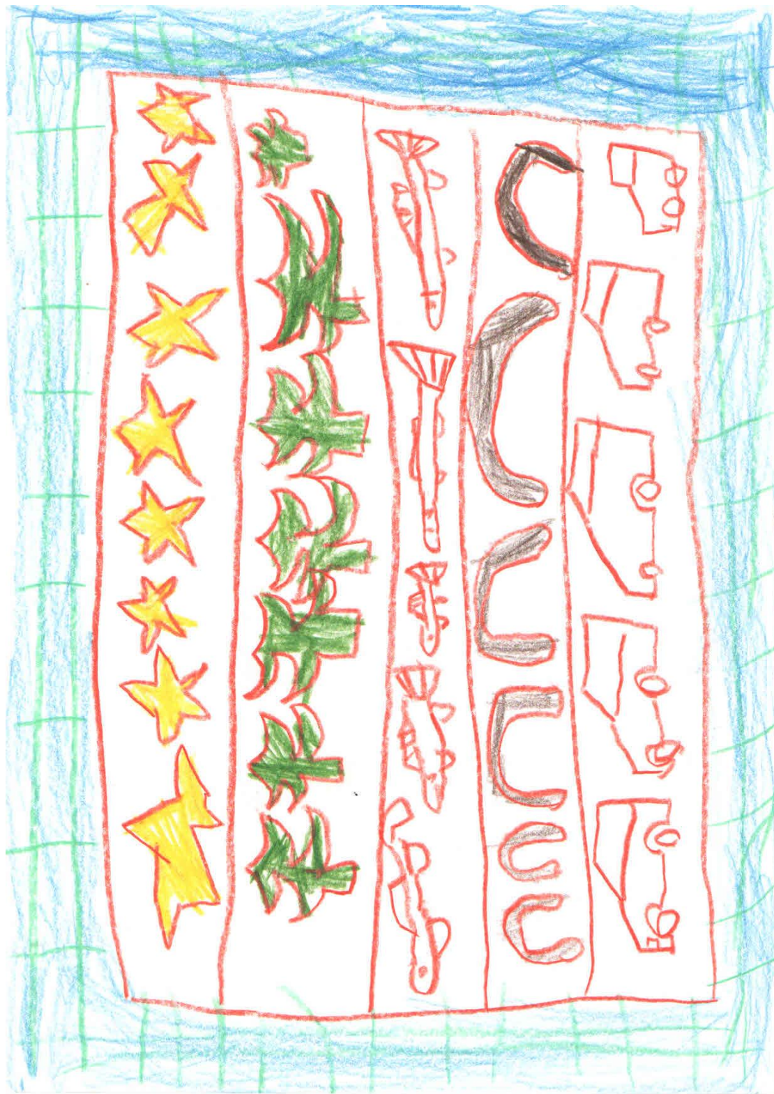
Zdařilá kresba šestiletého chlapce „Co děláš, než přijde Ježíšek?“ zachycuje plech s cukrovím, které chlapec před Ježíškem pomáhá péct. Cukroví podle výpovědi pekl v MŠ i doma.