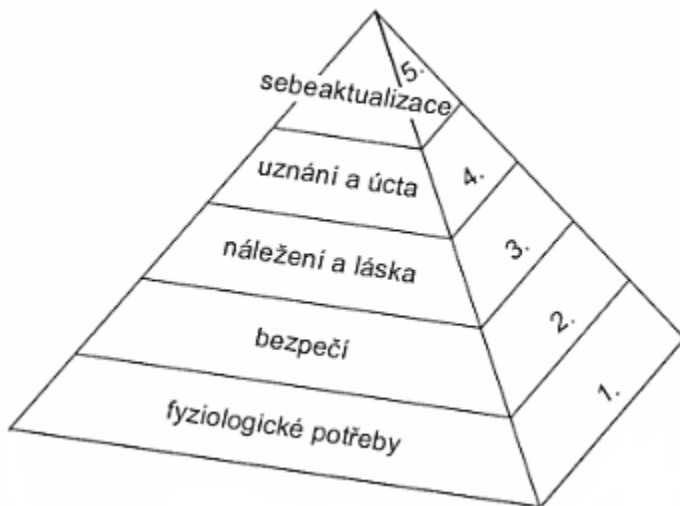
Obrázek 2: Maslowova hierarchie potřeb