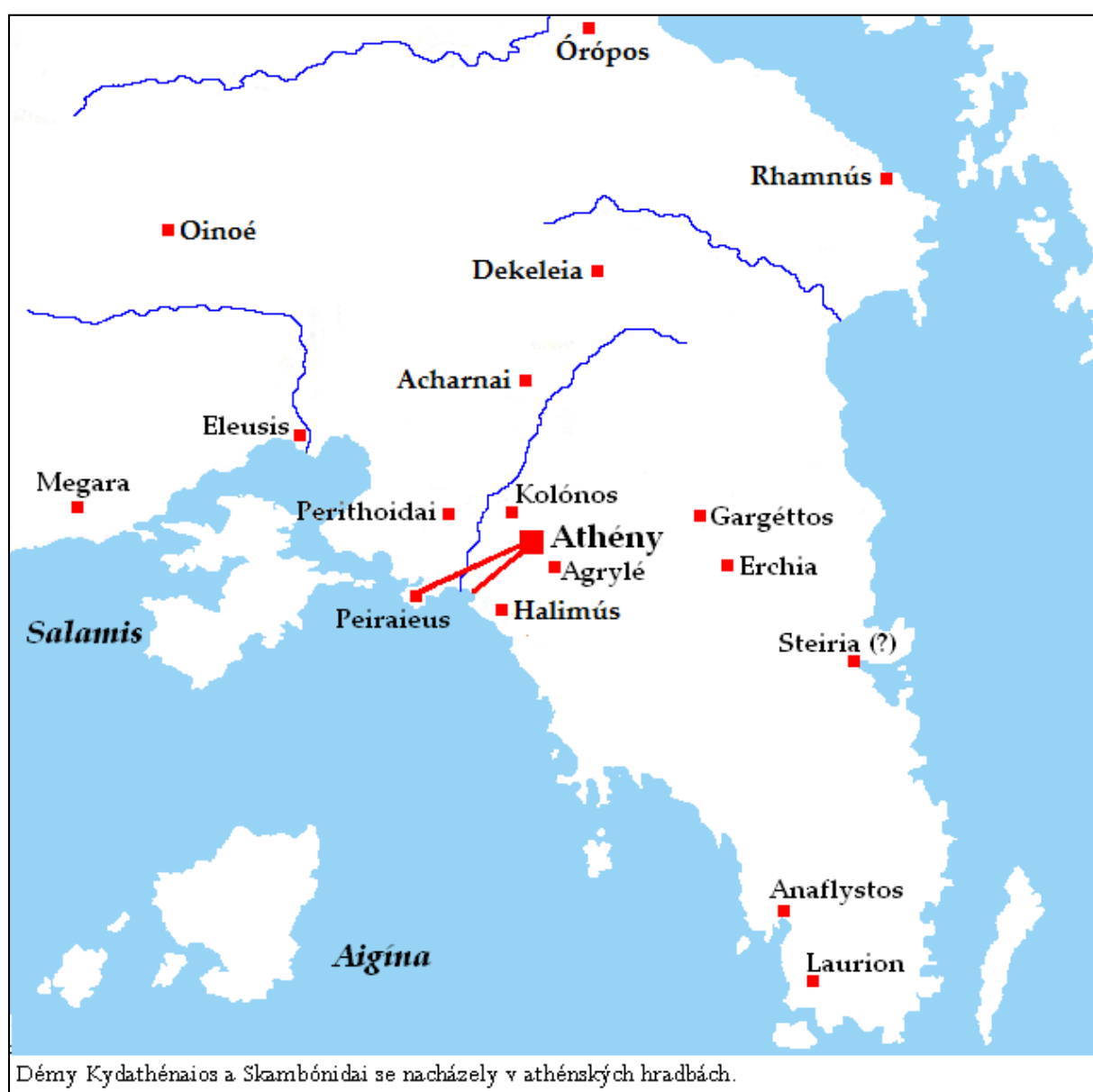
Mapa 3: Attika

Iónie na stranu Sparty byla naděje na ukončení války v nedohlednu. Nepolevující finanční zátěž musela být významným motivem odporu bohatých Athéňanů proti pokračování ve válce pod demokratickou správou. 54