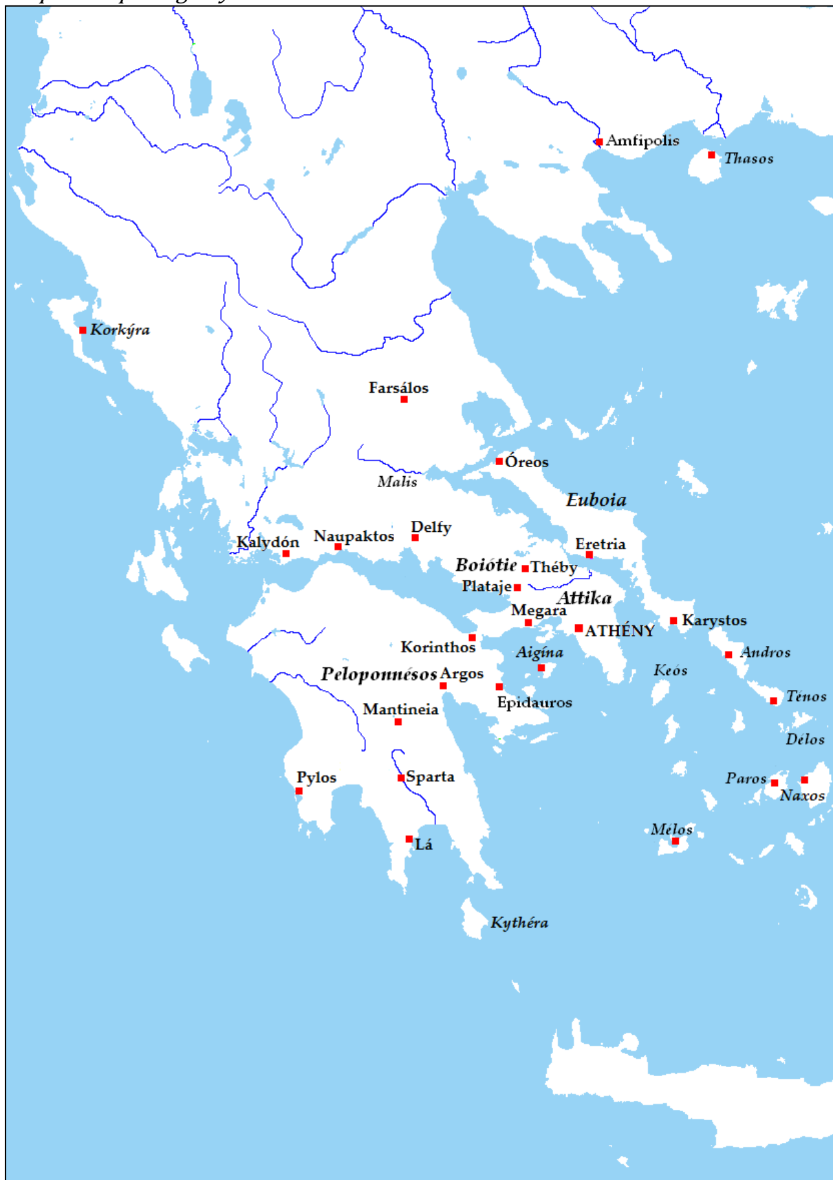
Mapa 1: Západ Egeidy.