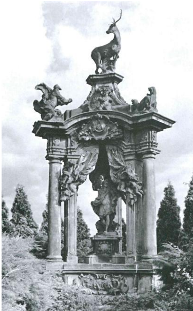
7. Matyáš Bernard Braun a František Maxmilián Kaňka: Pomník císaře Karla VI. se sv. Hubertem u Hlavence, 1724–1725, pískovec, snímek Zdeněk Helfert