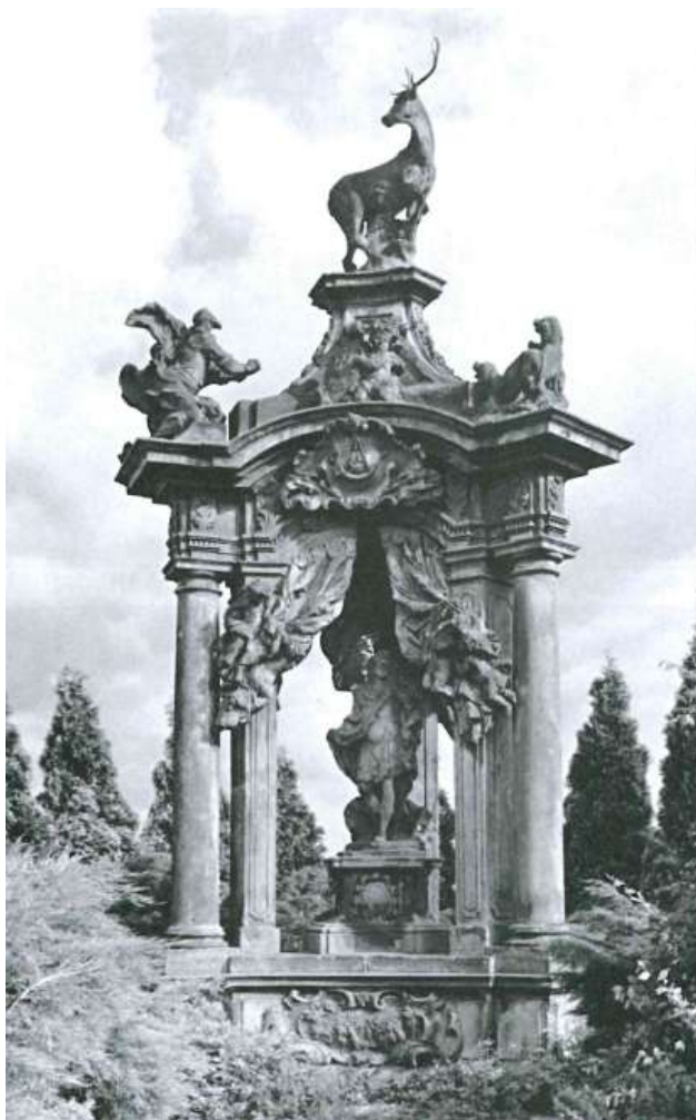
7. Matyáš Bernard Braun a František Maxmilián Kaňka: Pomník císaře Karla VI. se sv. Hubertem u Hlavence, 1724–1725, pískovec