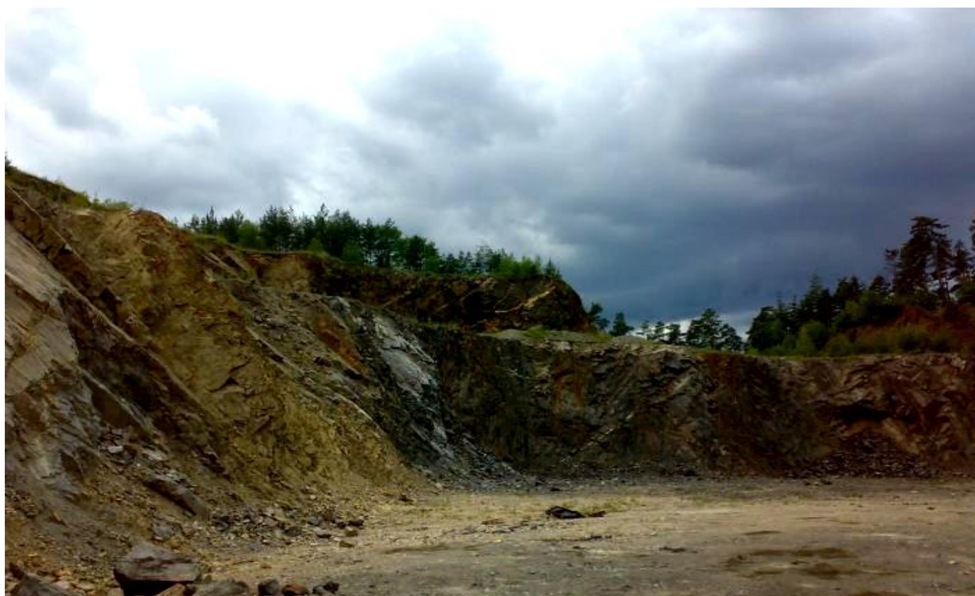
Příloha č. 4 Lom ve Vlastějovicích (www.geology.cz, Březina, 2009).