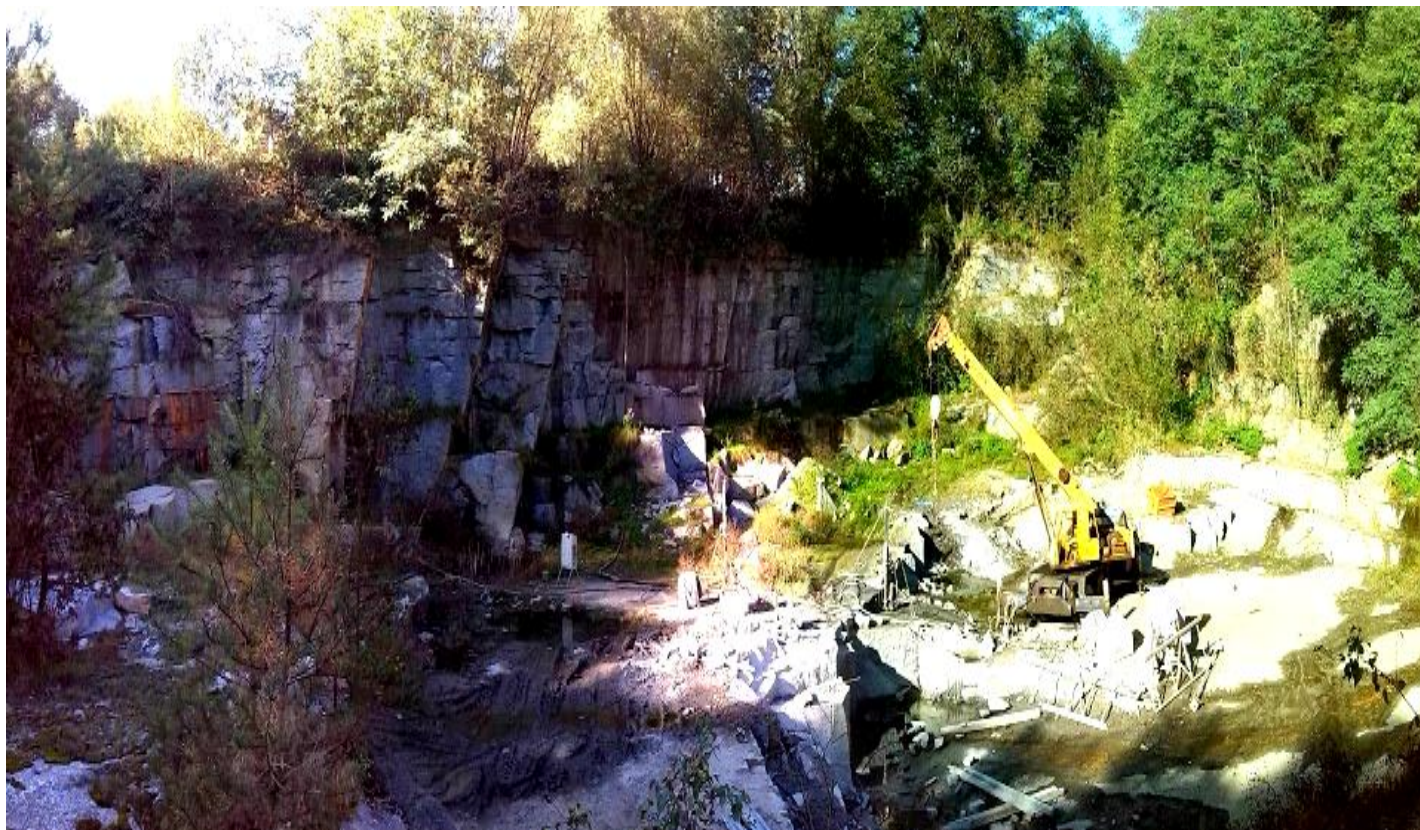
Příloha č. 3 Lom ve Vepicích.