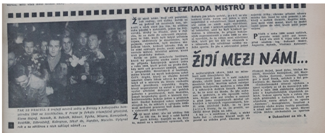
Zdroj: NOVOTNÝ Pavel, Jiří Černý a Jan Popper. Žijí mezi námi . Československý sport . 5.4.1968, roč. 16, č. 83., s. 1.