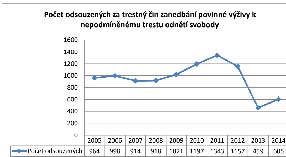
Graf 1 – Počet odsouzených za trestný čin zanedbání povinné výživy k nepodmíněnému trestu odnětí svobody

Z grafu je jasně patrný výrazný pokles takto trestaných osob po již zmíněné novele č. 390/2012 Sb., která nejenom zmírnila trestní sazby, ale dále doplnila § 55 odst. 2 TZ o podmínku, že za trestný čin zanedbání povinné výživy lze uložit nepodmíněný trest pouze v případě, že uložení takového trestu vyžaduje účinná ochrana společnosti nebo pokud není naděje, že by pachatele bylo možno napravit jiným trestem. S odkazem na statistické údaje se tento krok jeví jako velmi účinný, neboť pokles za poslední dva roky, kdy je předmětná novela účinná (vzhledem k nabytí účinnosti se nedá počítat s jejím výrazným prominutím do roku 2012), klesl počet nepodmíněně odsouzených osob za tento trestný čin o bezmála dvě třetiny. Lehce znepokojivý je opětovný nárůst takto sankcionovaných osob v posledním roce měření, avšak vzhledem ke skutečnosti, že se jedná o jediný rok, nelze z daného zvýšení vyvozovat žádné dlouhodobější závěry.