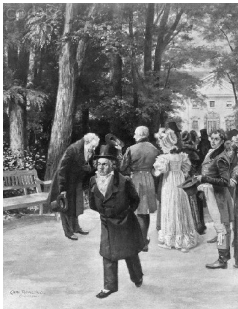
Obr. 1 – obraz Carl Röhlinga