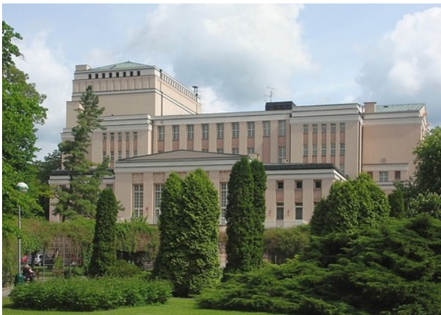
Obr. 9 – Krušnohorské divadlo