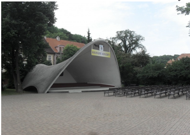
Obr. 14 – Šanovská mušle