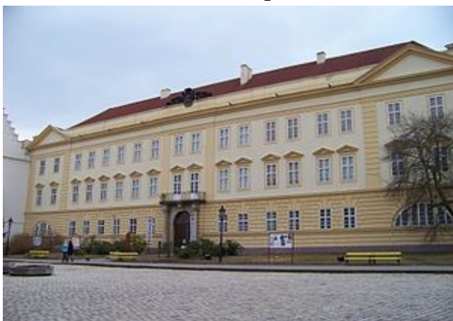
Obr. 4 – Zámek Teplice