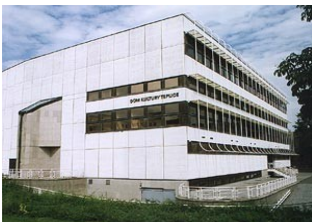
Obr. 12 – Dům kultury Teplice