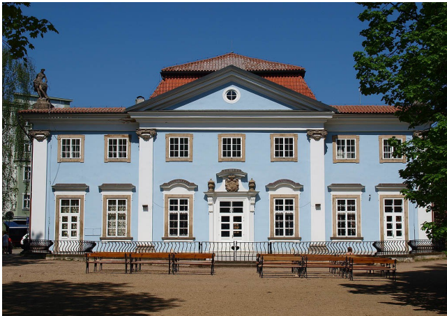
Obr. 7 – Zahradní dům