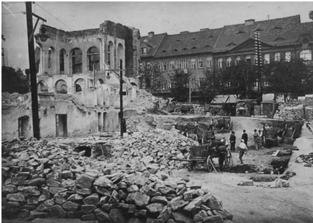
Obr. 8 – městské divadlo po požáru v roce 1919