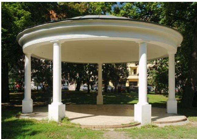
Obr. 3 – altán v zámeckém parku