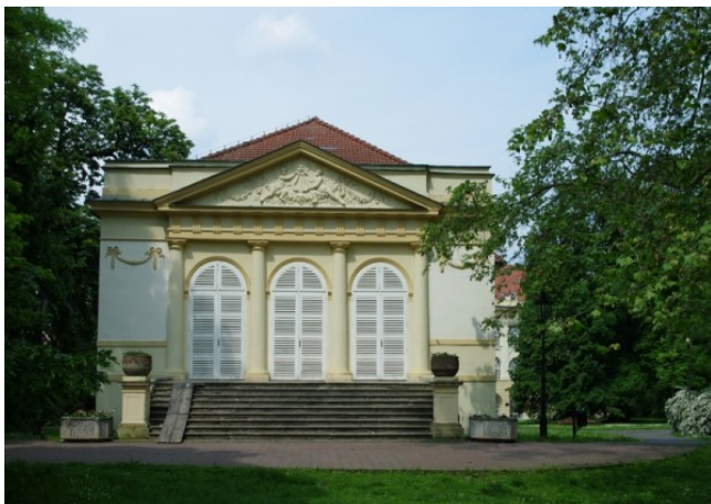
Obr. 2 – Zámecké divadlo