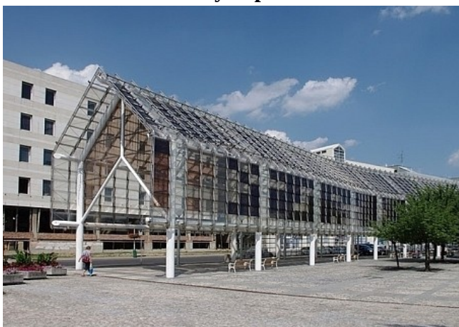
Obr. 13 – skleněná kolonáda u Domu kultury