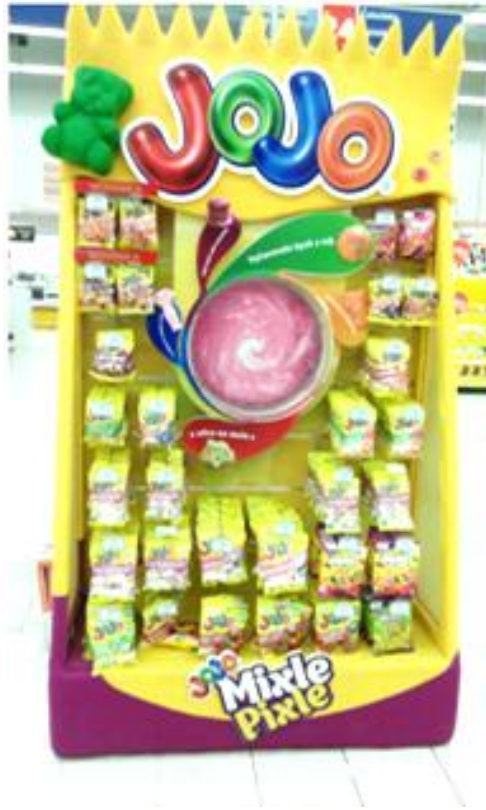
Příloha č. 4: Příklad barevného spojení a prostředí vyvolávající emoce (obrázek)