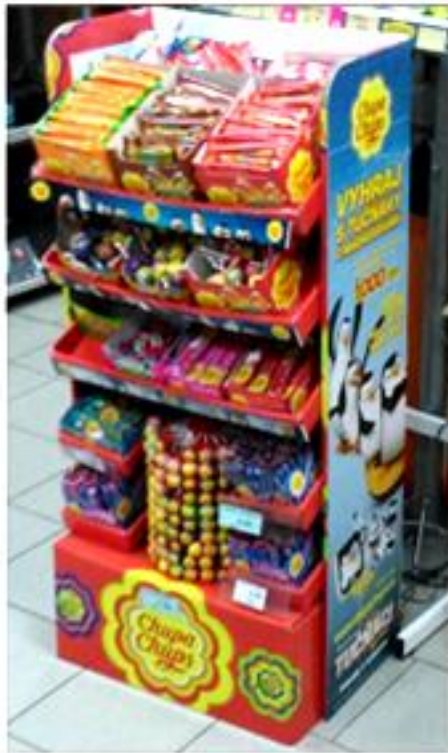
Příloha č. 2: Dárek zdarma (obrázek)