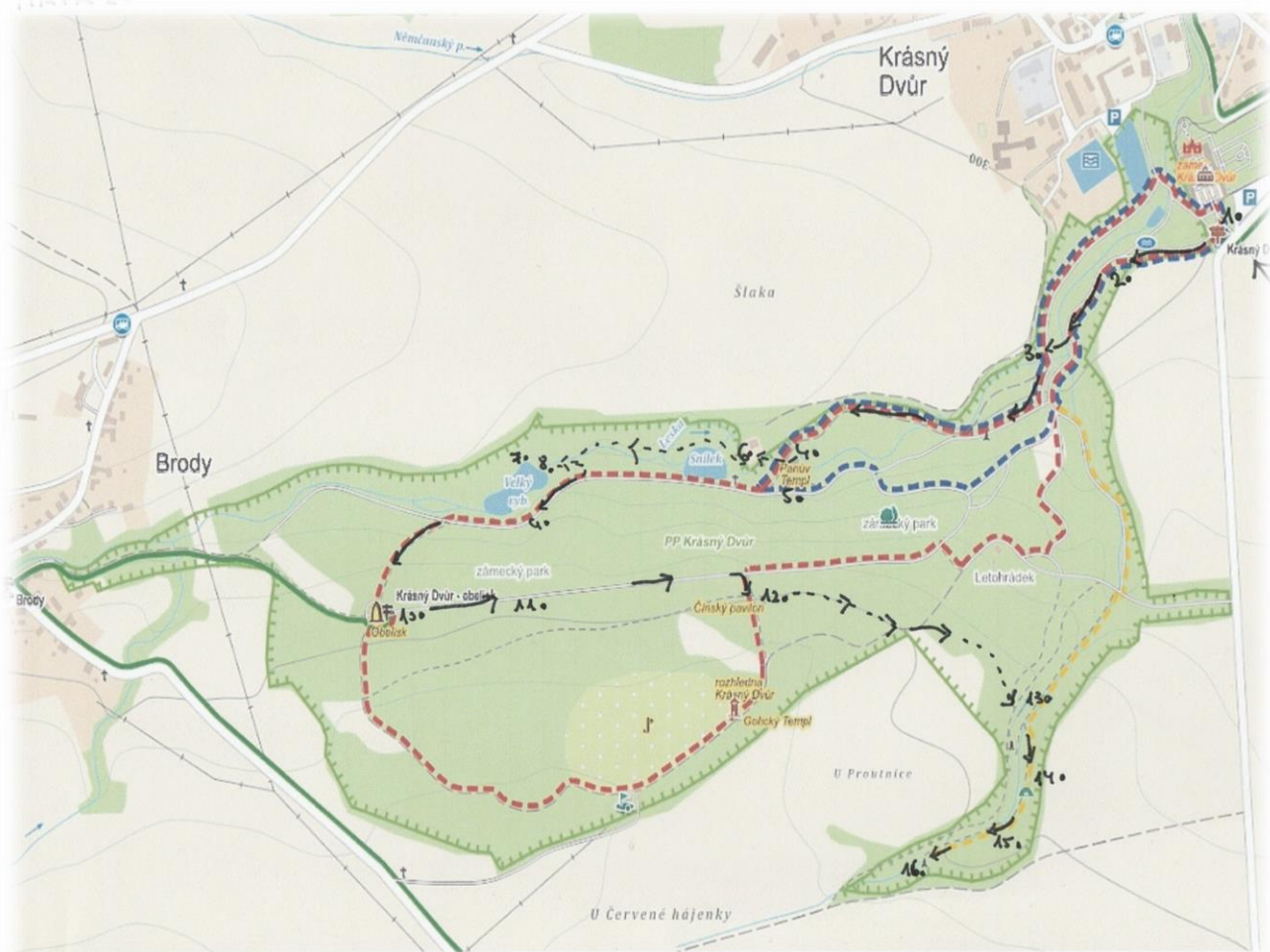
Obrázek 55 - mapa2 (cesta Franze Alexandra von Kleista parkem)