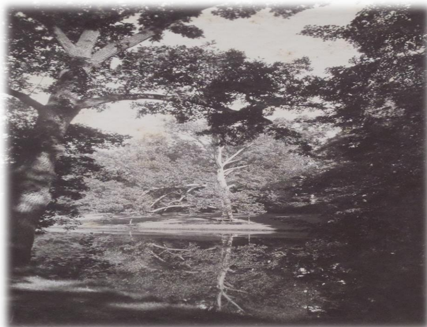
Obrázek 20b - rybník Snílek ve dvacátých letech 20. století