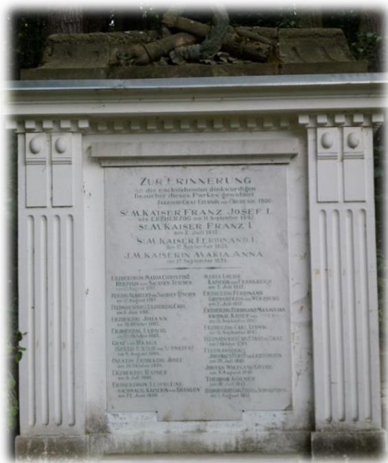
Obrázek 11a - Pamětní deska (, 30. 7. 2015)