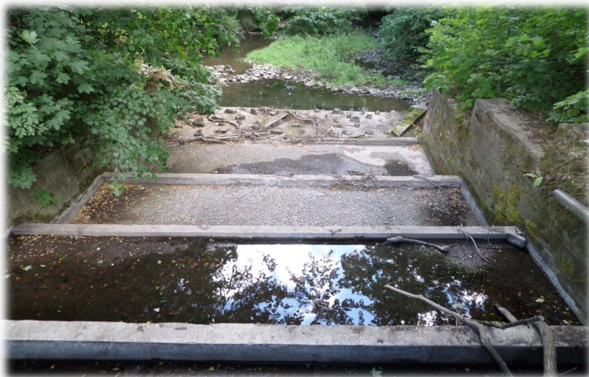
Obrázek 23a - stavídko Velkého rybníka v místech Rybárny (foto: autor, 30. 7. 2015)