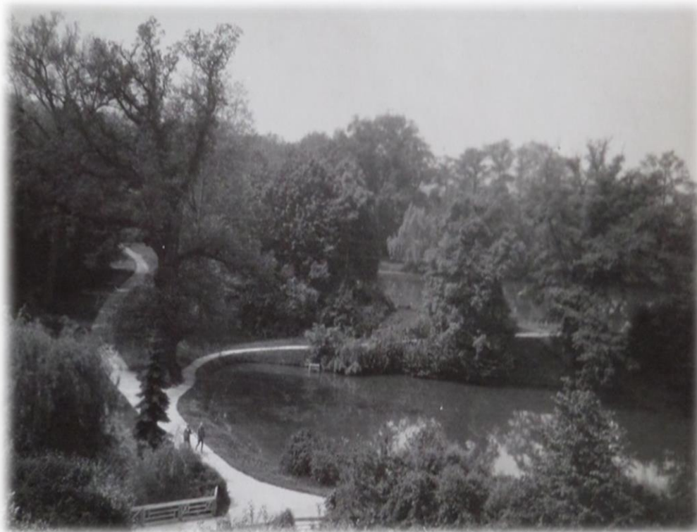
Obrázek 52b - Podzámecké rybníky ve dvacátých letech 20. století