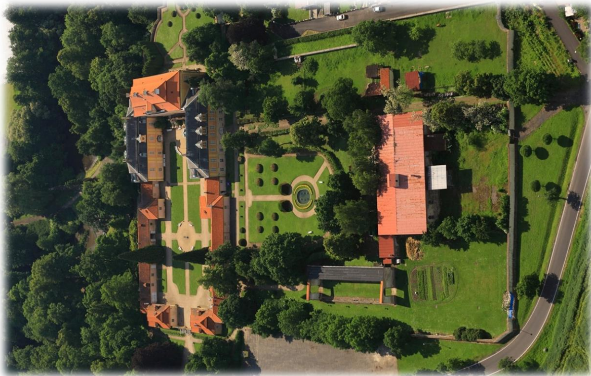
Obrázek 5a - letecký pohled na francouskou zahradu s jízdnou a oranžerií (vpravo)