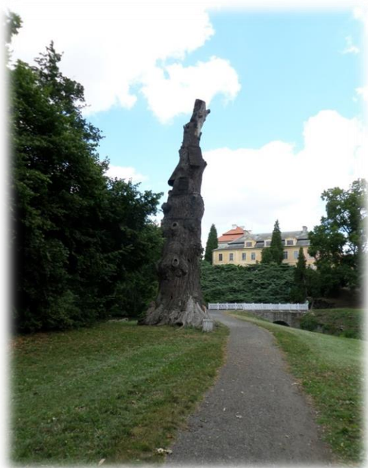
Obrázek 7a - Goethův dub na hrázi Podzámeckého rybníka