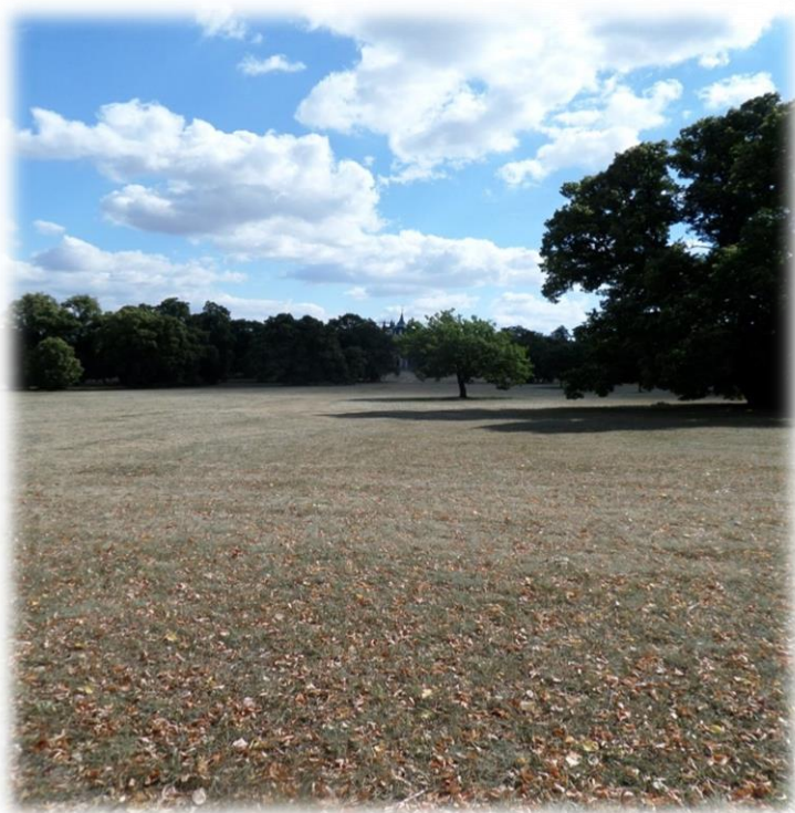
Obrázek 31a - Velká louka u Gotické věže