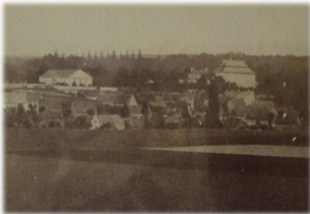
Obrázek 53b - zámek s francouzskou zahradou ve dvacátých letech 20. století