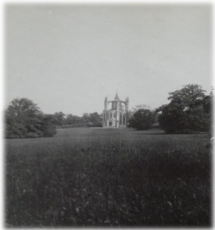
Obrázek 32b - Velká louka u Gotické věže ve dvacátých letech 20. století