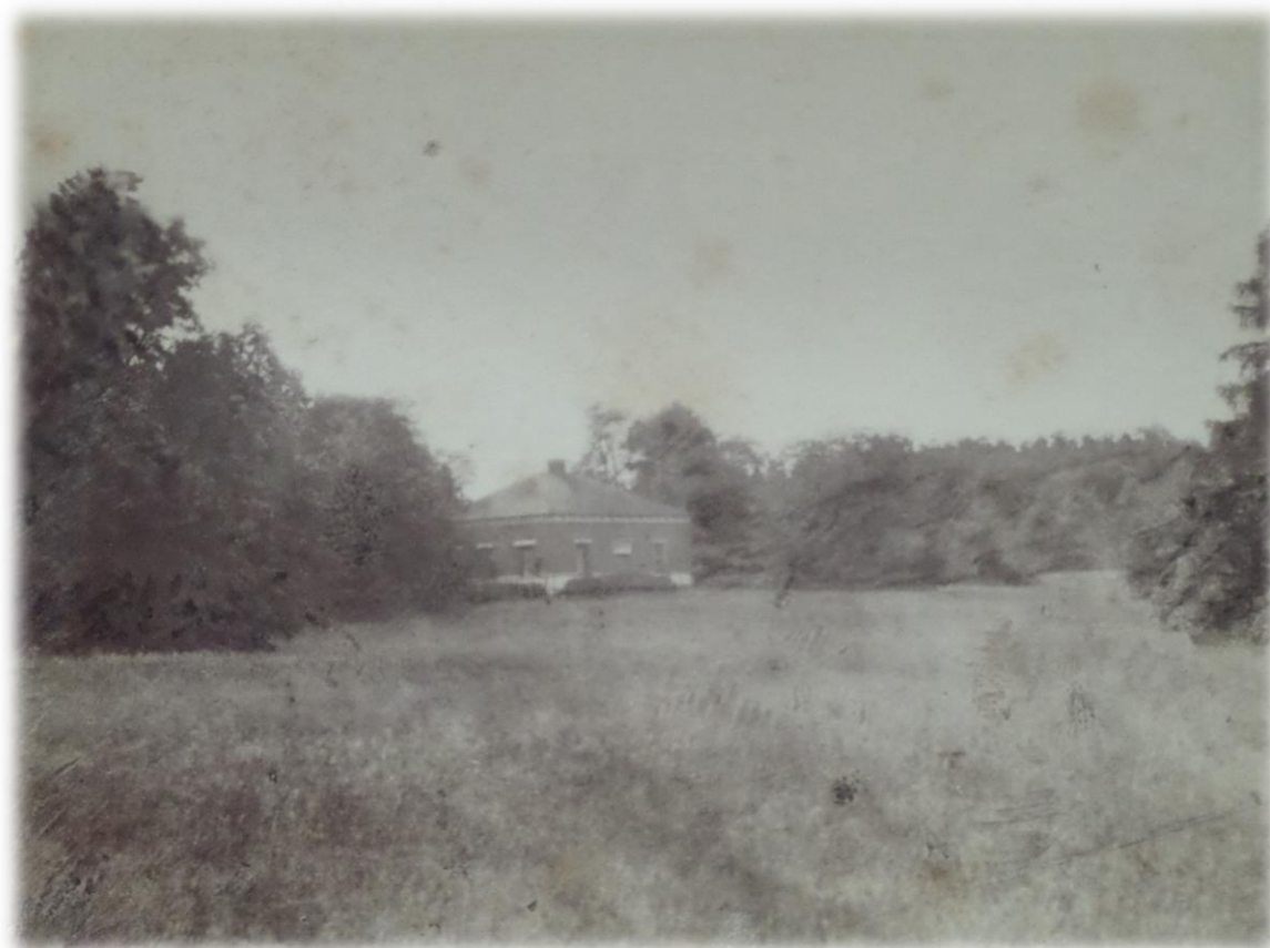
Obrázek 36b - Holandský statek ve dvacátých letech 20. století (zdroj: SOkA Jindřichův Hradec, Vs. Krásný Dvůr, kart. 139, sign. VI. B beta.)