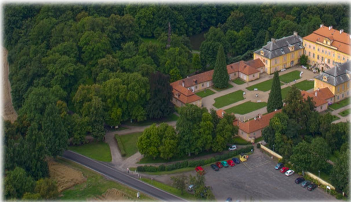
Obrázek 6a - letecký pohled na zámek a část parku