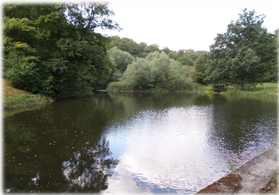
Obrázek 21a - Velký rybník