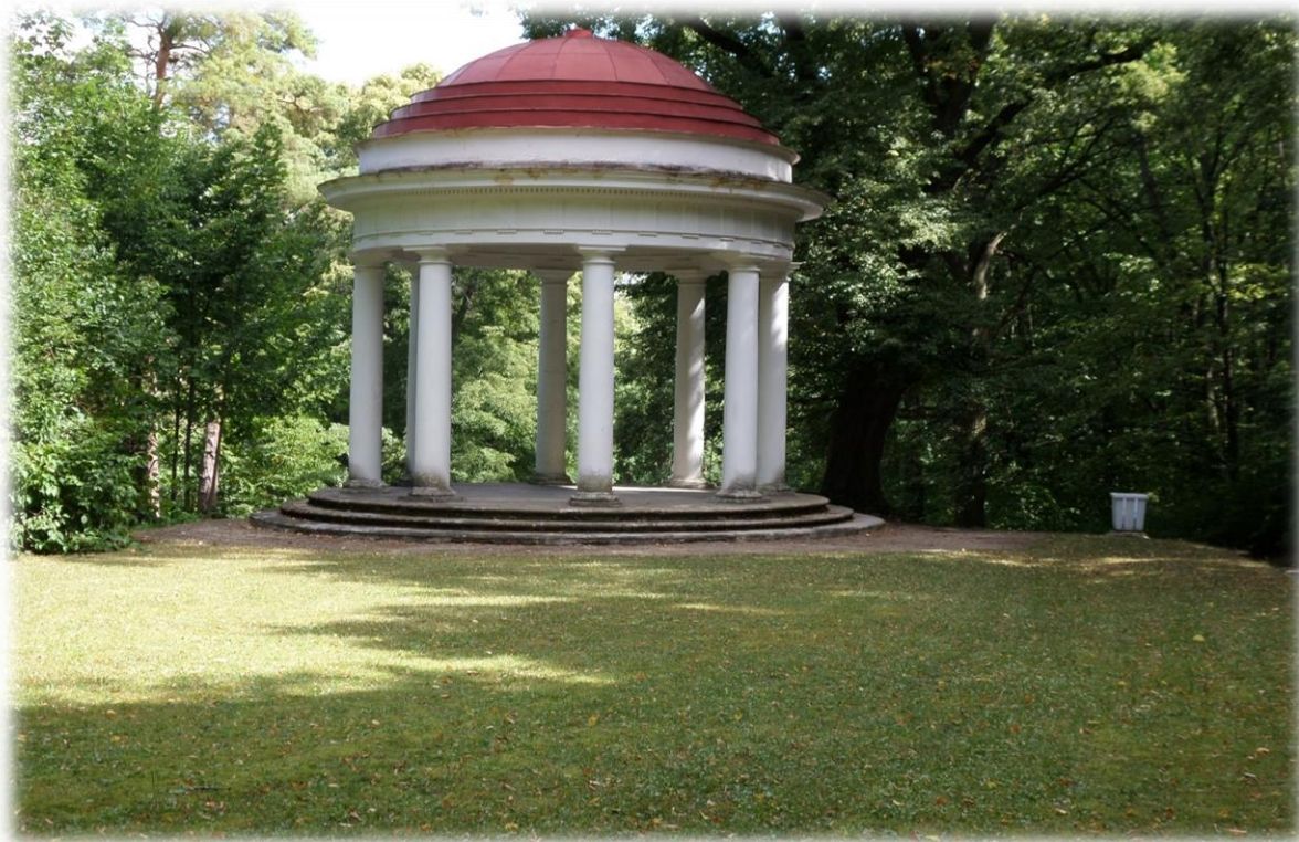
Obrázek 25a - Gloriet - Malý templ