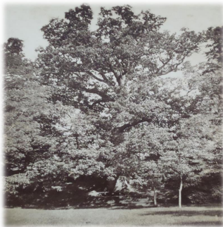
Obrázek 14b - Duby u Panova - Velkého templu ve dvacátých letech 20. století