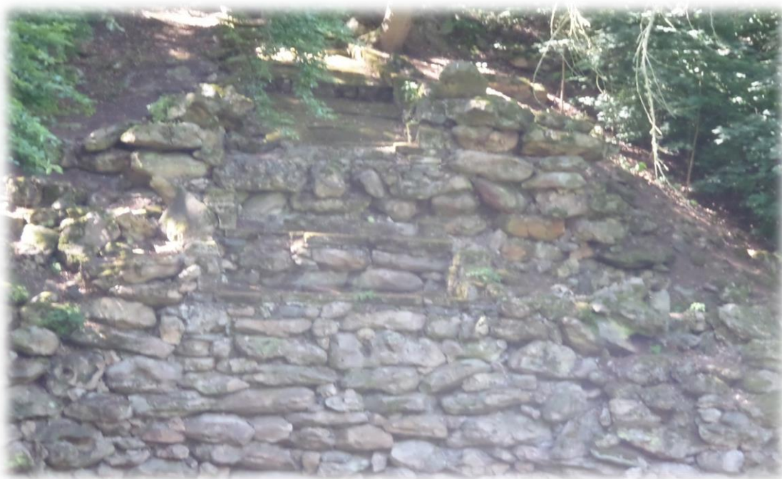
Obrázek 18a - terasa Velkých kaskád