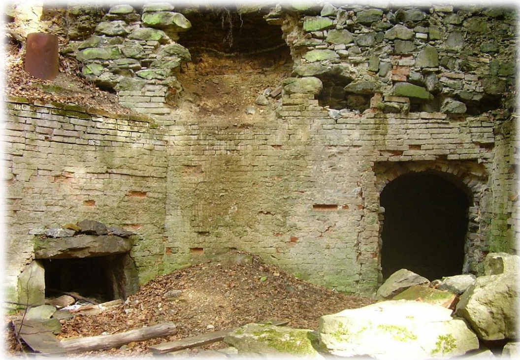
Obrázek 45a – Rokle Rachel - Eremitáž