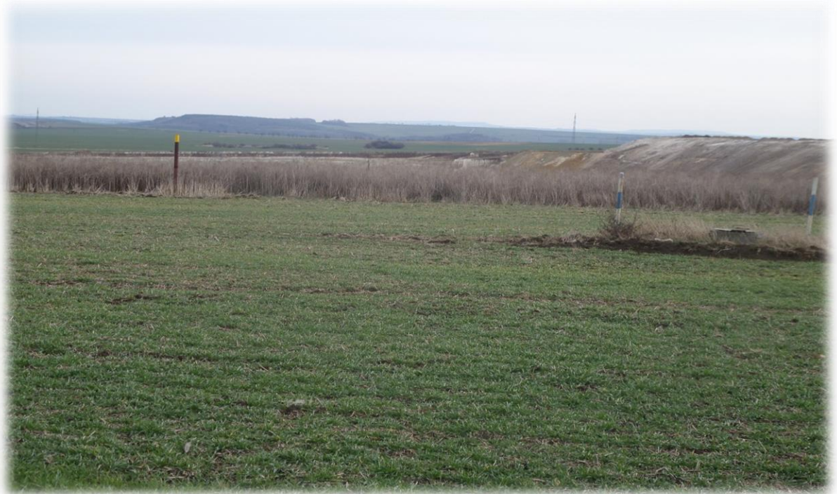
Obrázek 2a - Pohled na důl u lipové aleje (1,3 km od zámku – foto: autor, současnost)