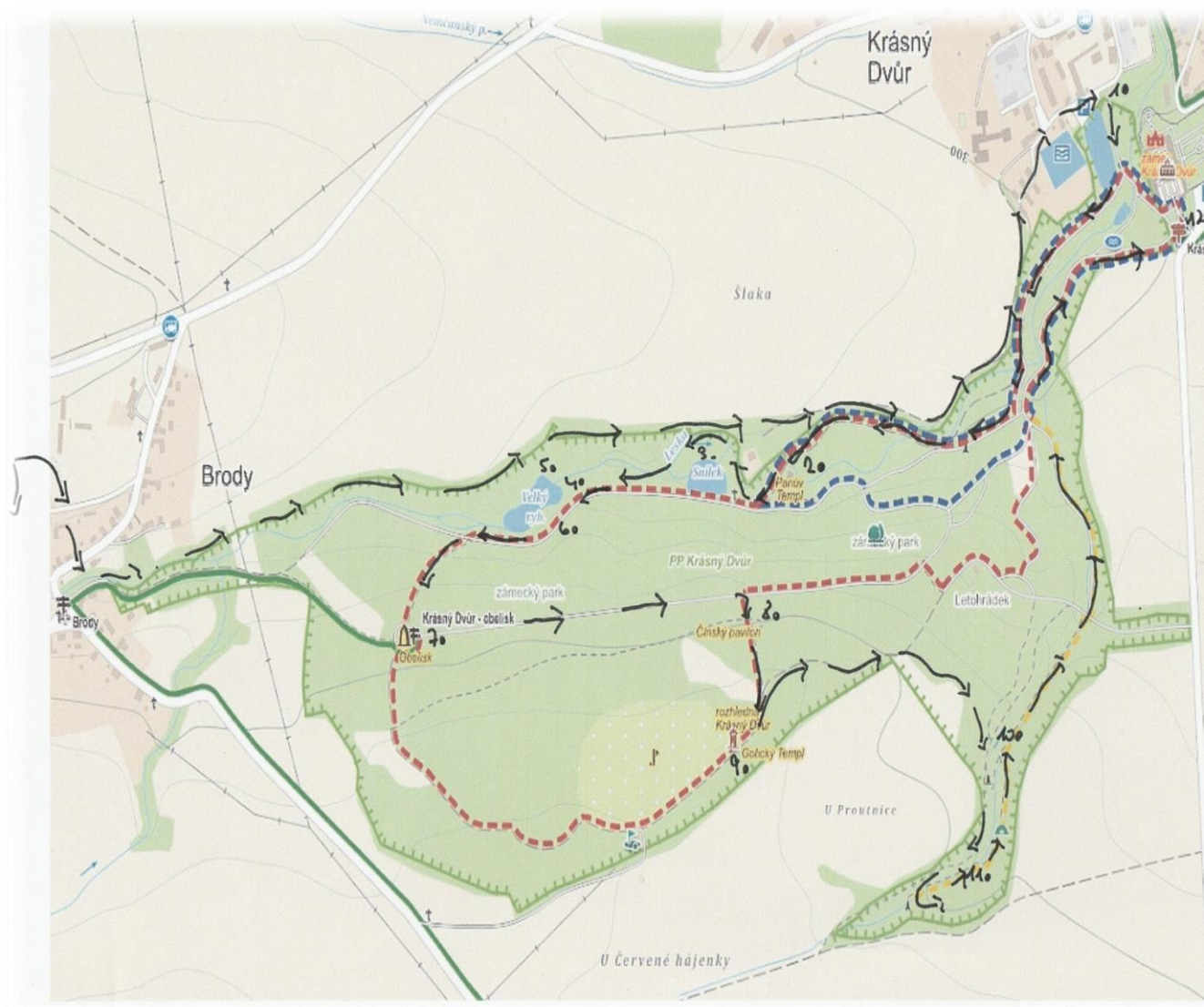
Obrázek 57 - mapa4 (cesta Bedřicha Bernaua parkem)