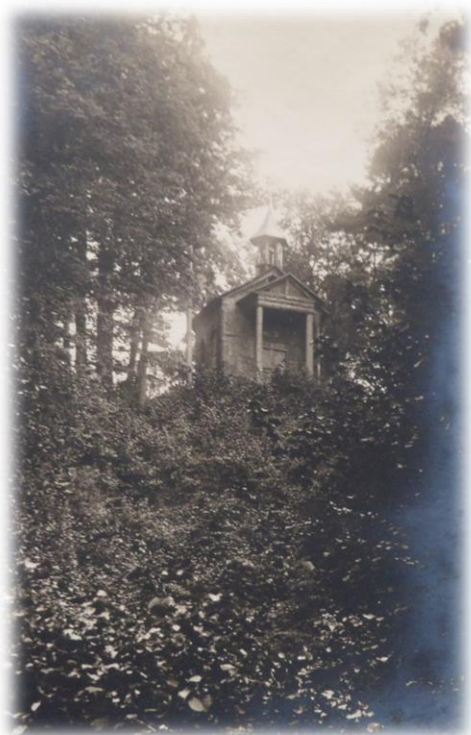
Obrázek 48b - Rokle Rachel - Kostelík ve dvacátých letech 20. století