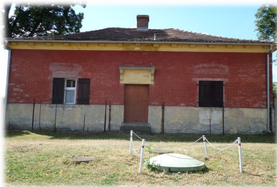
Obrázek 35a - Holandský statek