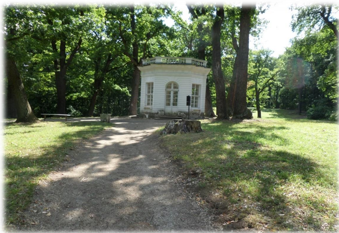
Obrázek 41a - Lusthaus - Gloriet - Goethův pavilon (, 30. 7. 2015)