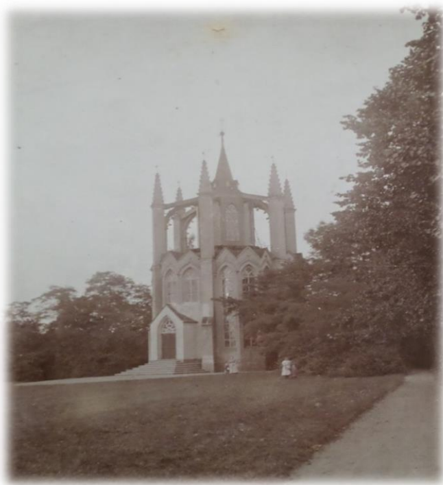
Obrázek 34b - Gotická věž ve dvacátých letech 20. století