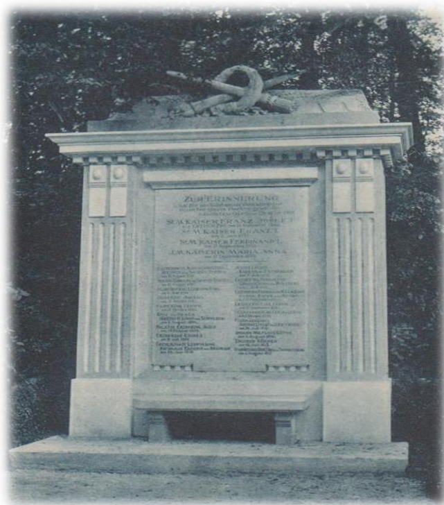
Obrázek 12b - Pamětní deska ve dvacátých letech 20. století