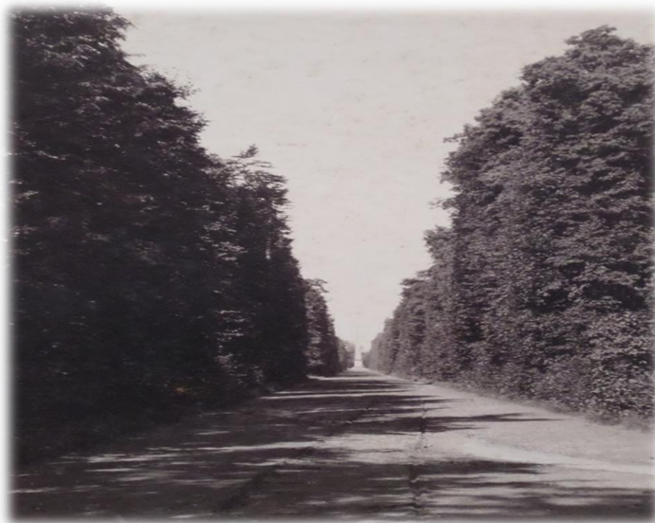
Obrázek 30b - Milovka ve dvacátých letech 20. století