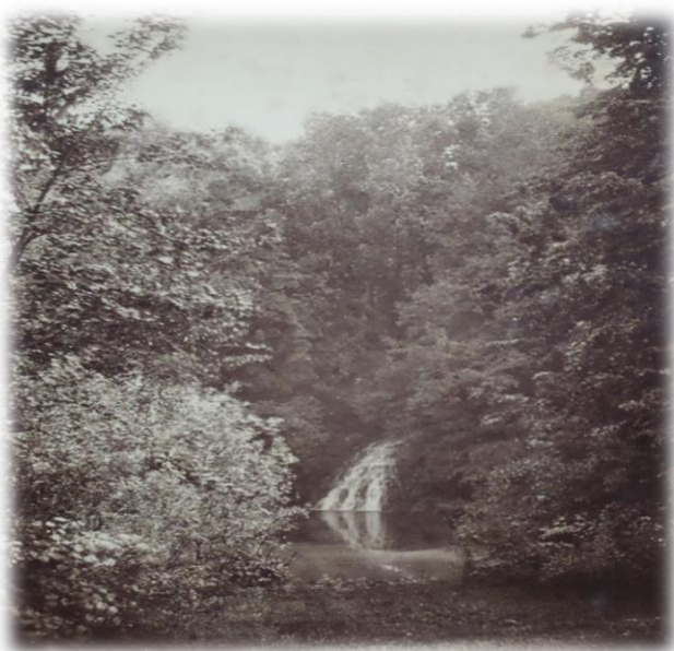
Obrázek 22b - Velký rybník s Malým vodopádem ve dvacátých letech 20. století