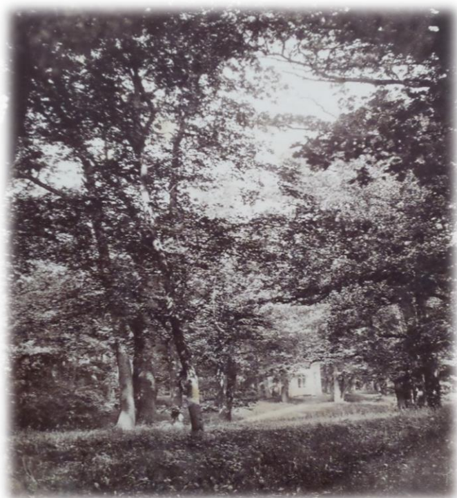
Obrázek 42b - Lusthaus ve dvacátých letech 20. století (zdroj: SOKA Jindřichův Hradec, Vs. Krásný Dvůr, kart. 139, sign. VI. B beta.)