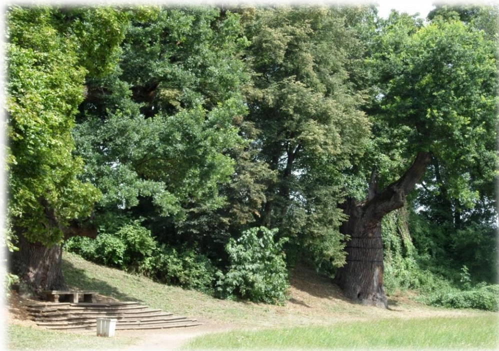
Obrázek 13a - Duby u Panova - Velkého templu