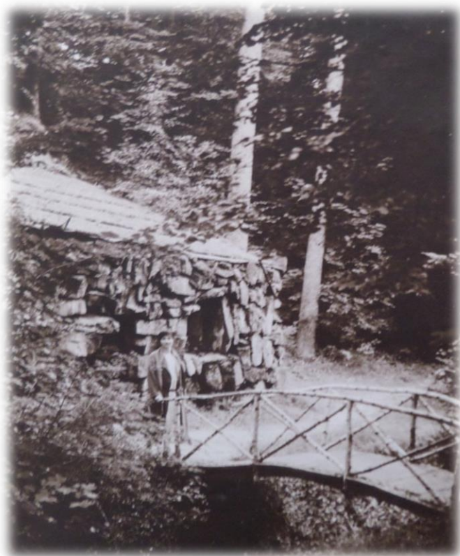
Obrázek 46b – Rokle Rachel - Eremitáž ve dvacátých letech 20. století (zdroj: SOkA Jindřichův Hradec, Vs. Krásný Dvůr, kart. 139, sign. VI. B beta.)