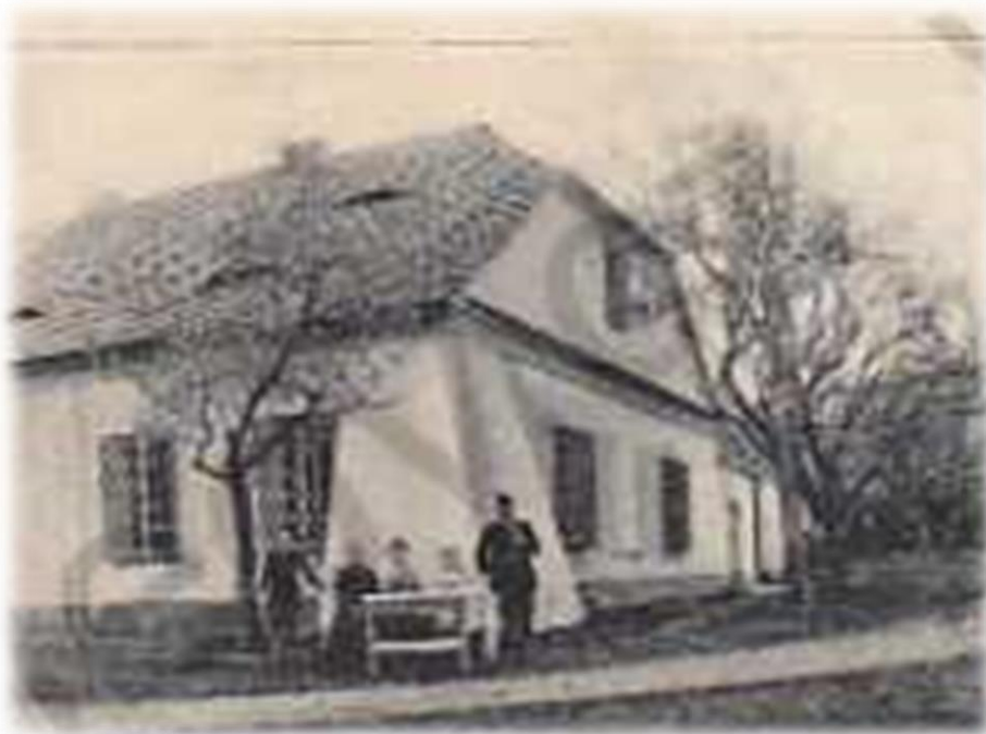
Obrázek 40b - Barokní hájovna v roce 1908