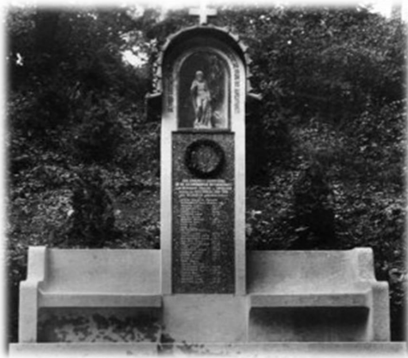
Obrázek 44b – Rokle Rachel - Pomník padlých ve dvacátých letech 20. století