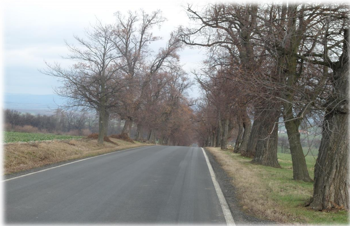
Obrázek 1a - Průhled lipovou alejí (1,3 km od zámku –, současnost 20. 2. 2016)