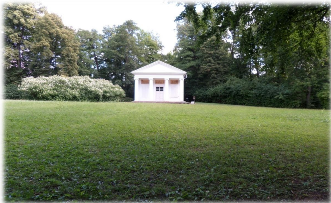
Obrázek 15a - Panův templ