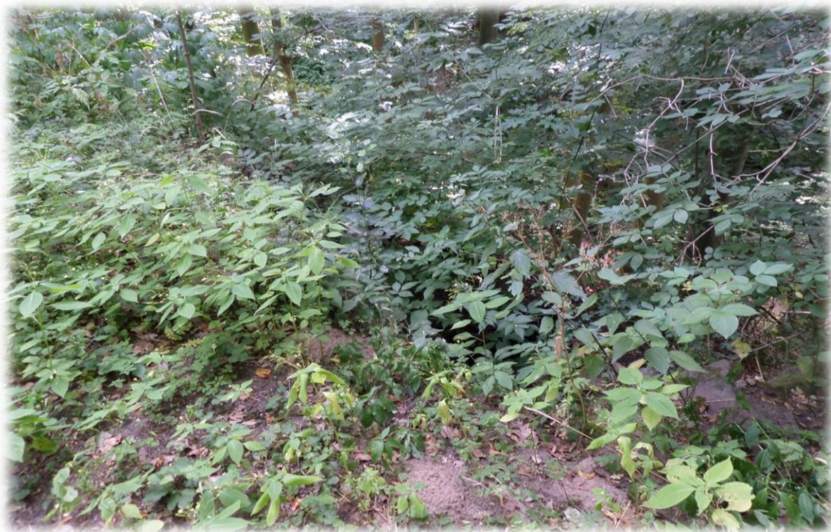
Obrázek 47a - Rokle Rachel - zarostlý vchod do chodby pod kostelíkem