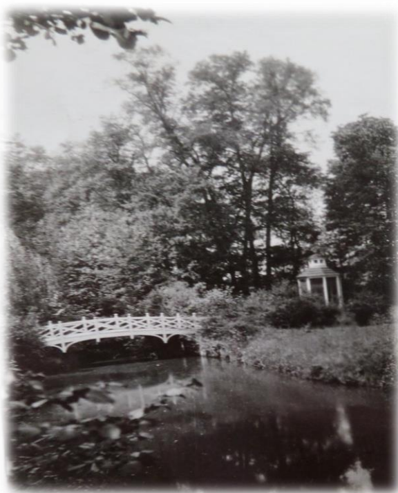
Obrázek 10b - Ptačí voliéra ve dvacátých letech 20. století