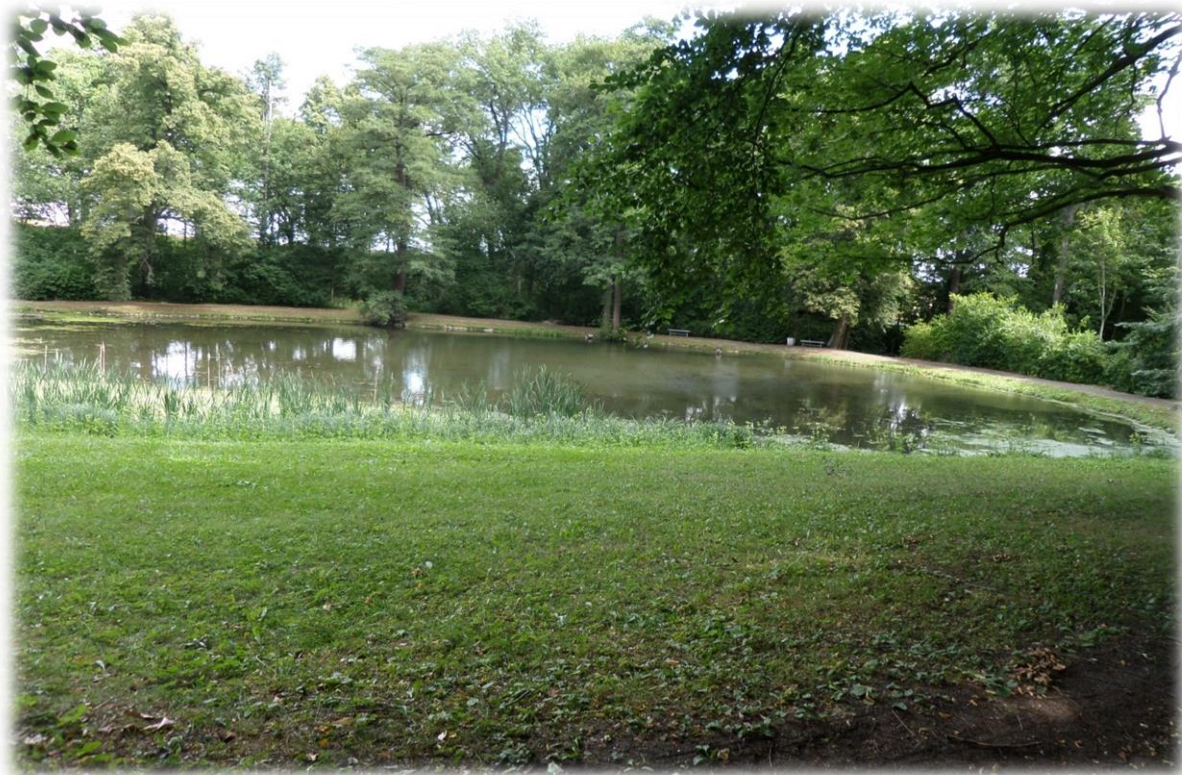
Obrázek 19a - rybník Snílek