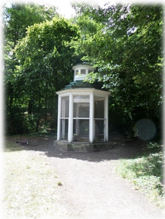
Obrázek 9a - Ptačí voliéra