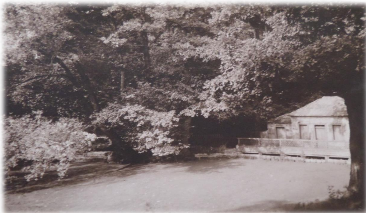
Obrázek 24b - Rybárna ve dvacátých letech 20. století