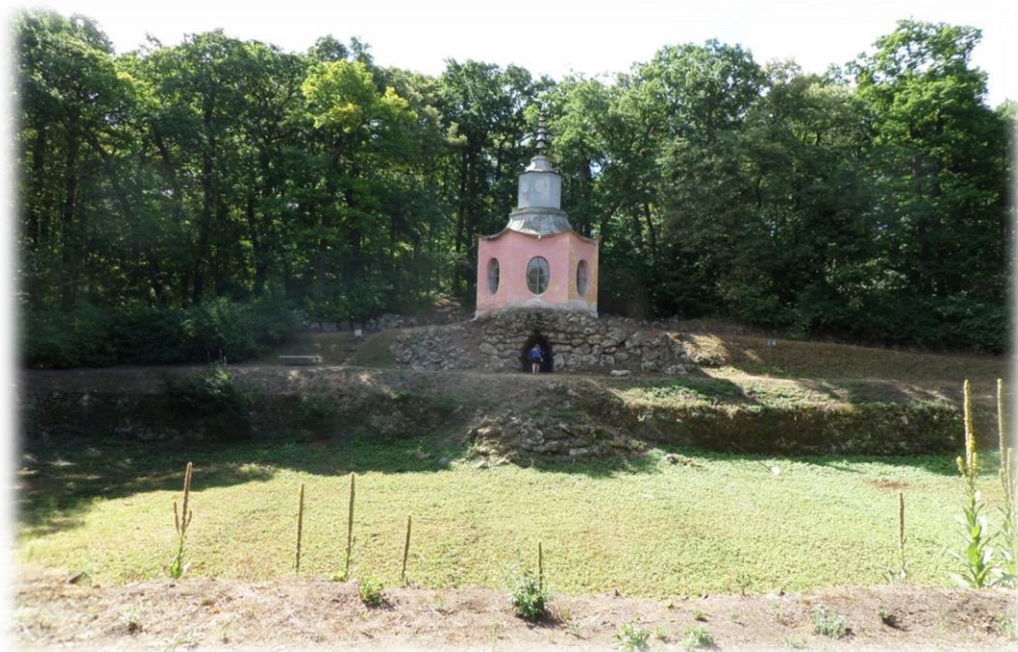
Obrázek 37a - Čínský pavilon