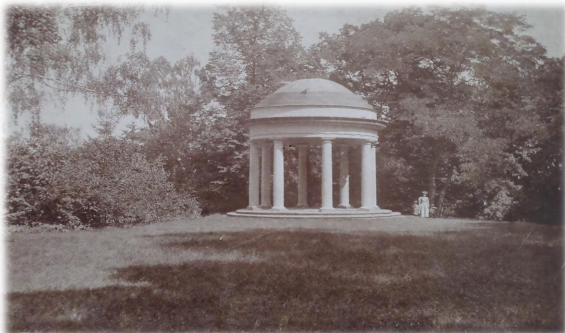
Obrázek 26b - Malý templ ve dvacátých letech 20. století