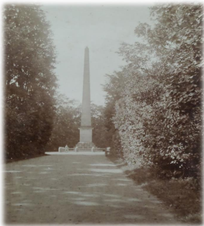
Obrázek 28b - Obelisk ve dvacátých letech 20. století