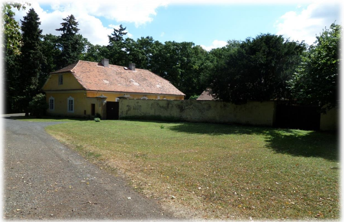
Obrázek 39a - Barokní hájovna