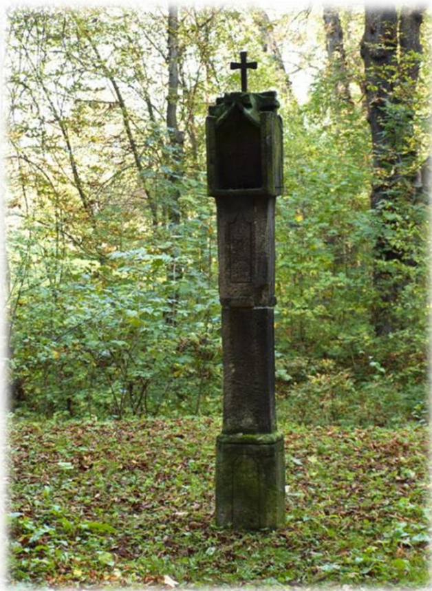
Obrázek 17a - Boží muka za Panovým templem