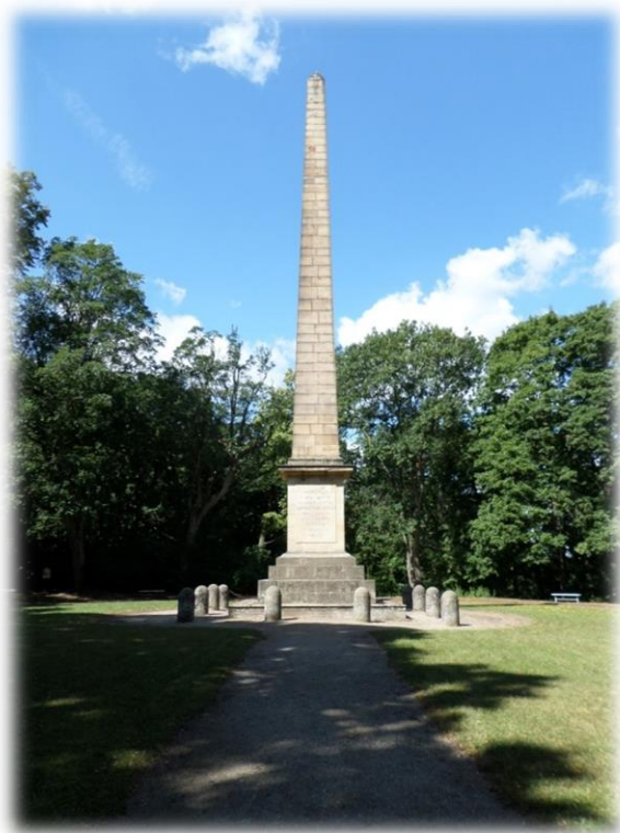
Obrázek 27a - Obelisk