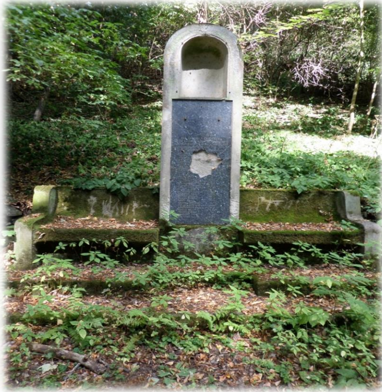
Obrázek 43a – Rokle Rachel - Pomník padlých