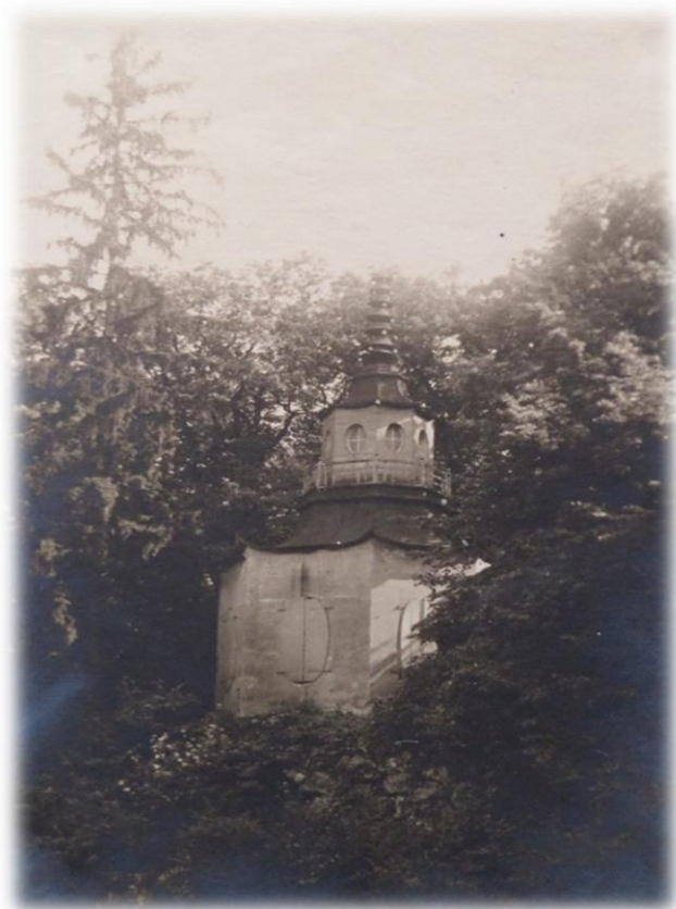
Obrázek 38b - Čínský pavilon ve dvacátých letech 20. století