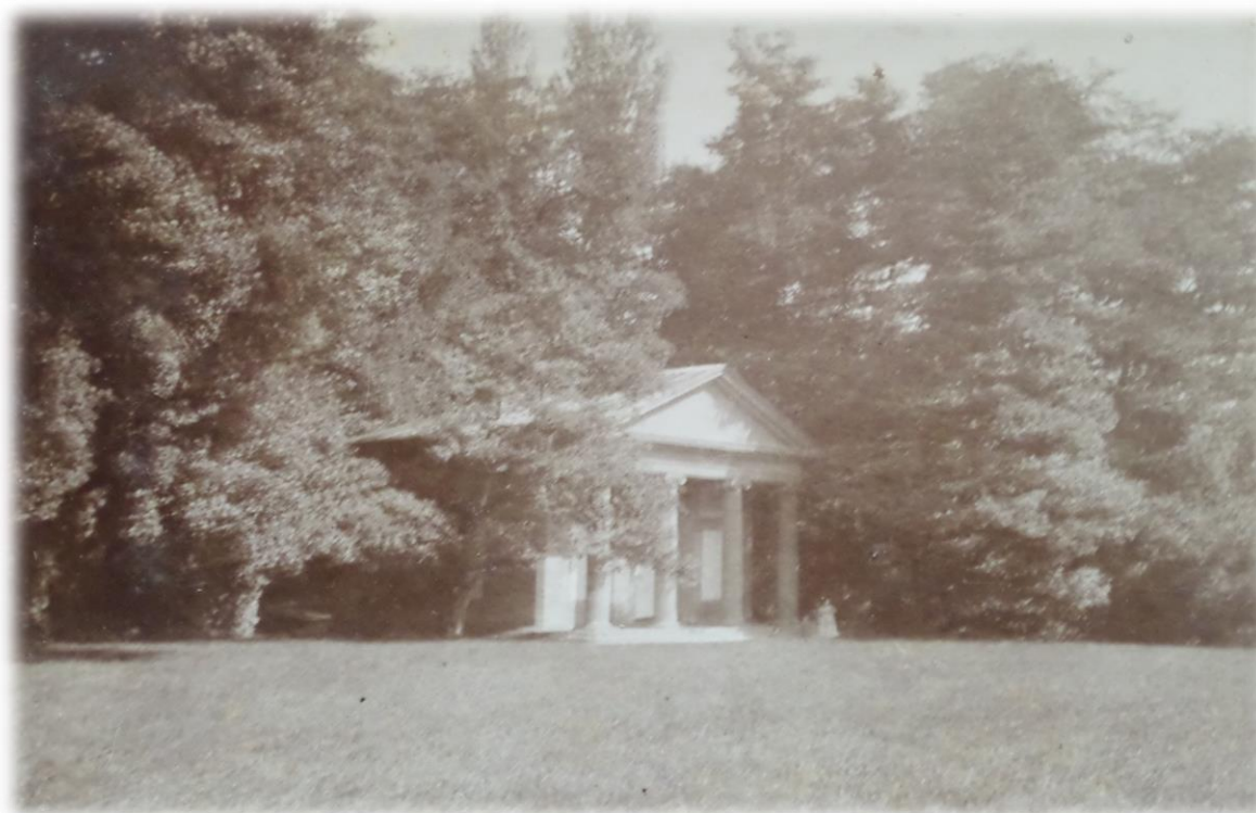
Obrázek 16b - Panův - Velký templ ve dvacátých letech 20. století