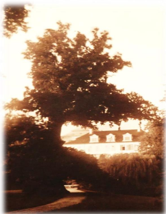
Obrázek 8b - Goethův dub ve dvacátých letech 20. století