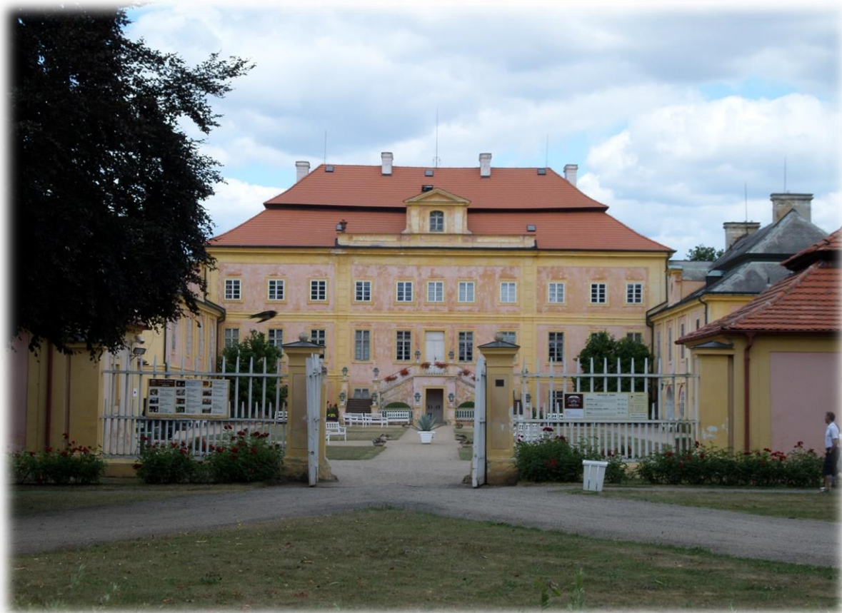
Obrázek 3a – zámek (současnost –, 30. 7. 2015)