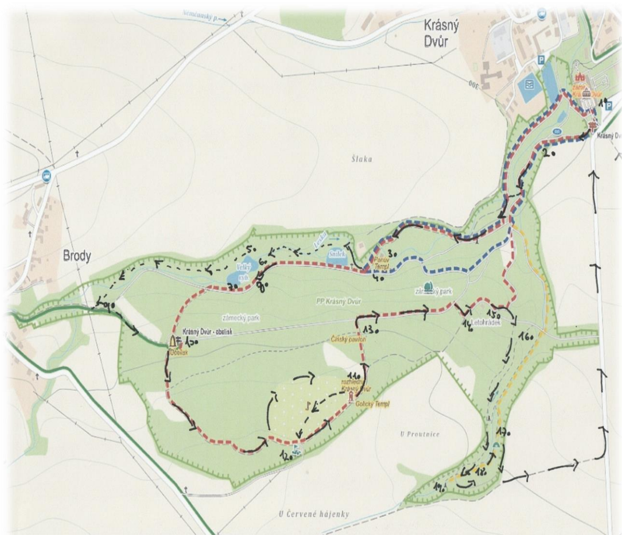
Obrázek 56 - mapa3 (cesta Johanna Quirina Jahna parkem)