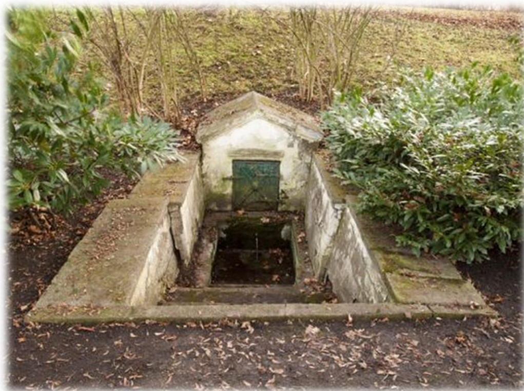
Obrázek 51a - Hrabčící studánka (, 30. 7. 2015)