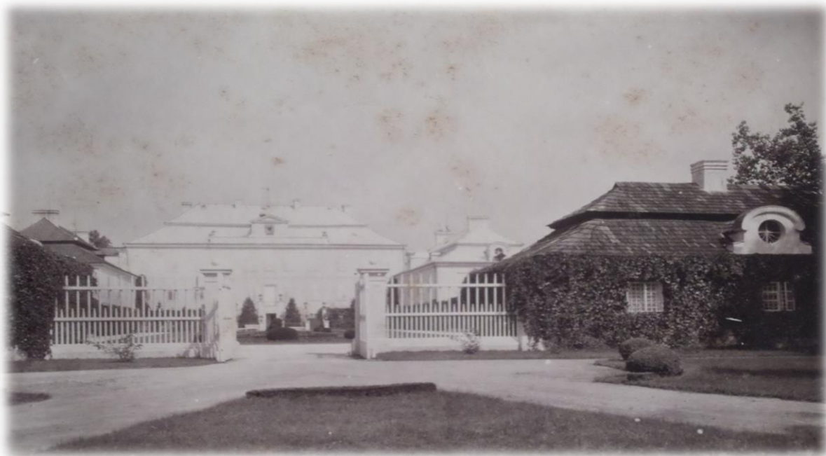
Obrázek 4b - zámek ve třicátých letech 20. století