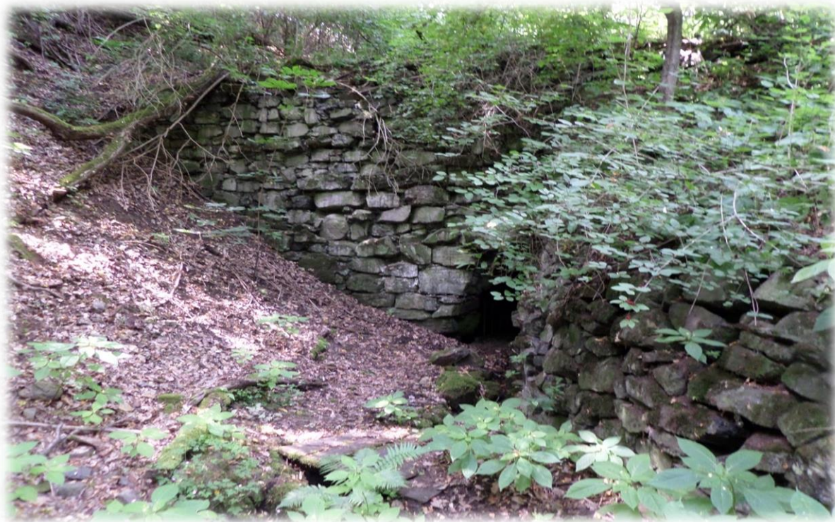
Obrázek 49a - Rokle Rachel - ústí do jeskyně se sarkofágem