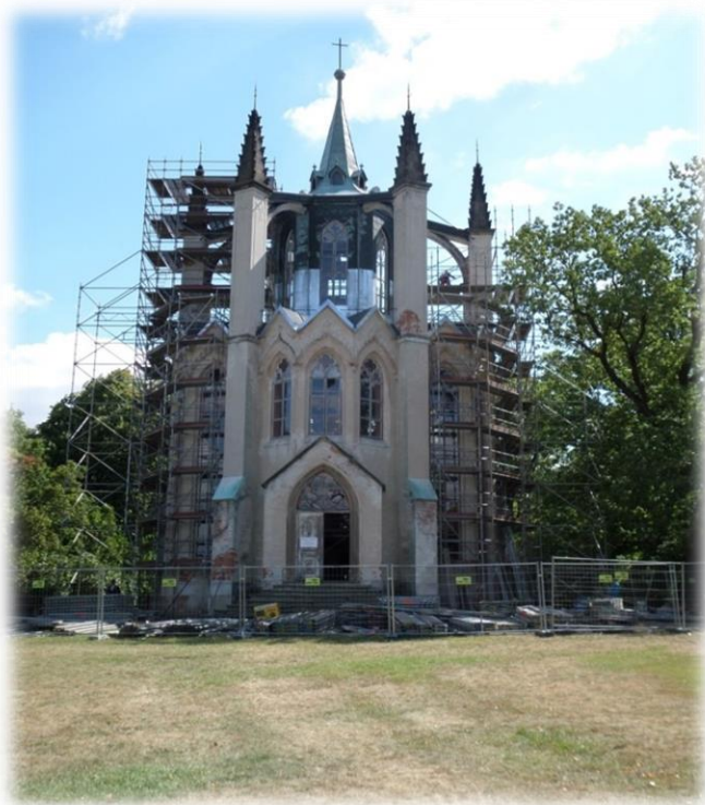
Obrázek 33a - Gotická věž