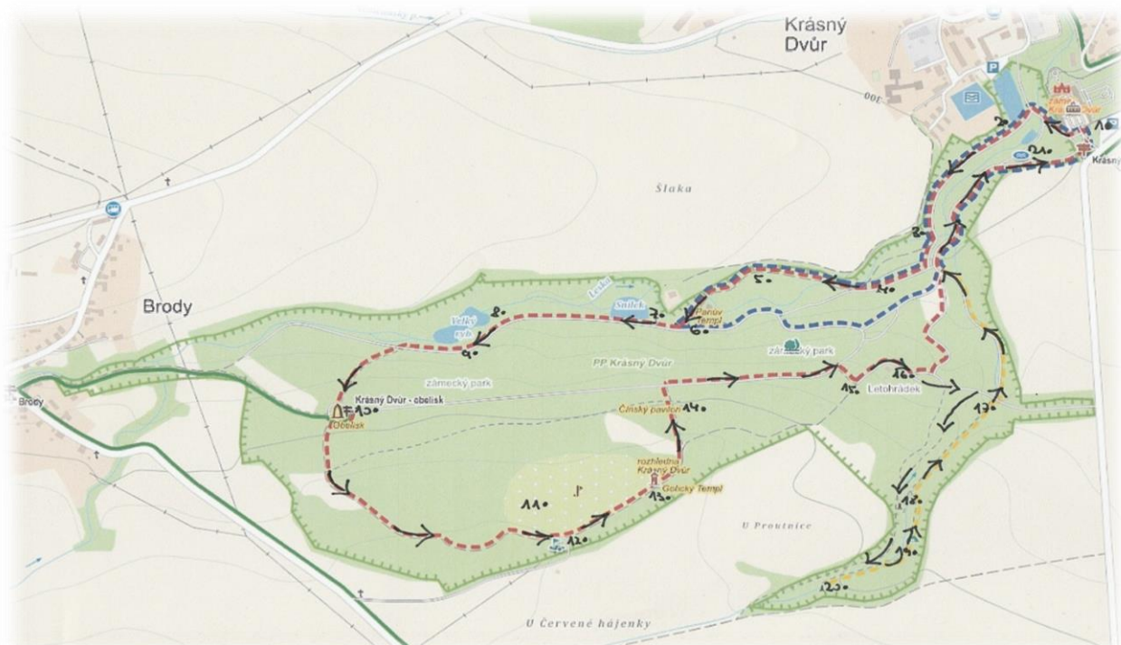
Obrázek 54 - mapa1 (cesta autora parkem)