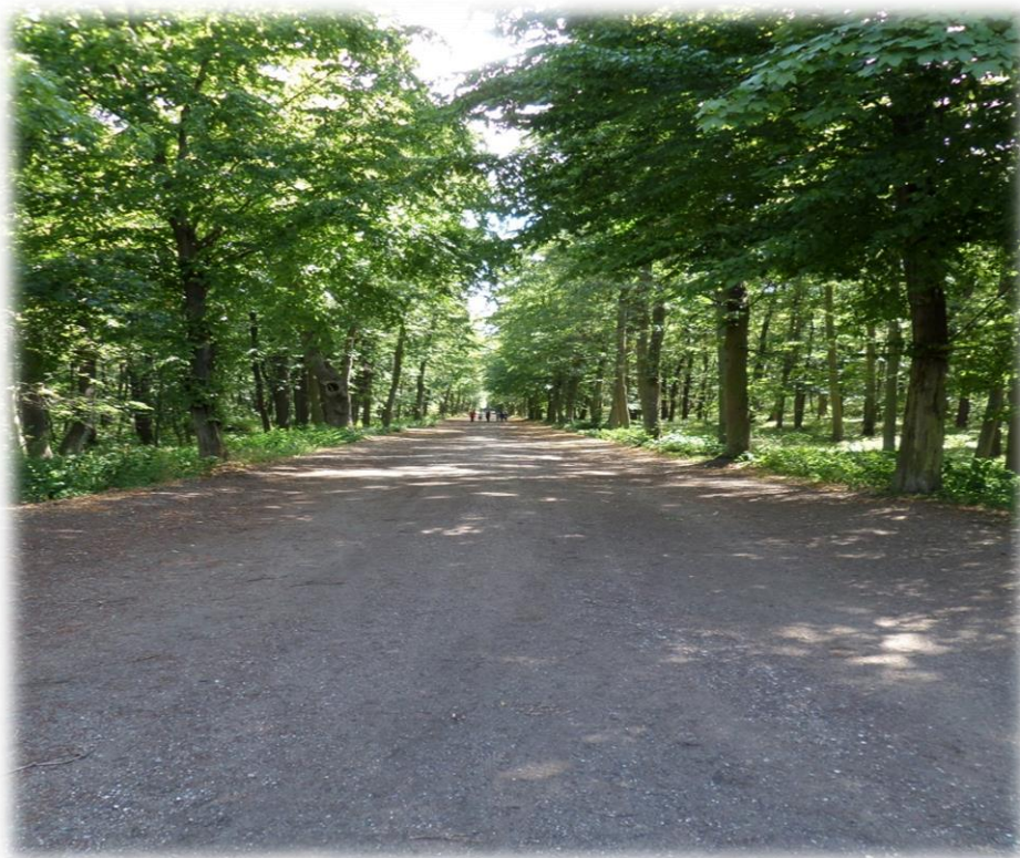
Obrázek 29a - Milovka