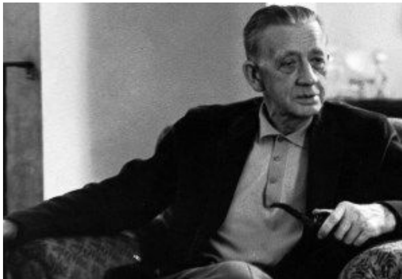
Ferdinand Peroutka

Český spisovatel, dramatik a publicista 6. únor 1985 (Praha) – 20. duben 1978 (New York)