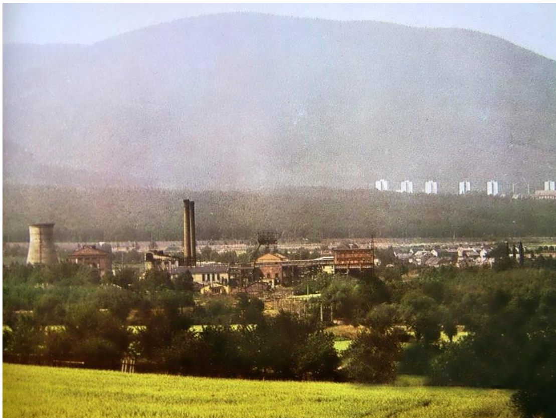
Obr. 7 Stavějící se panelové sídliště, v popředí důl Alexander