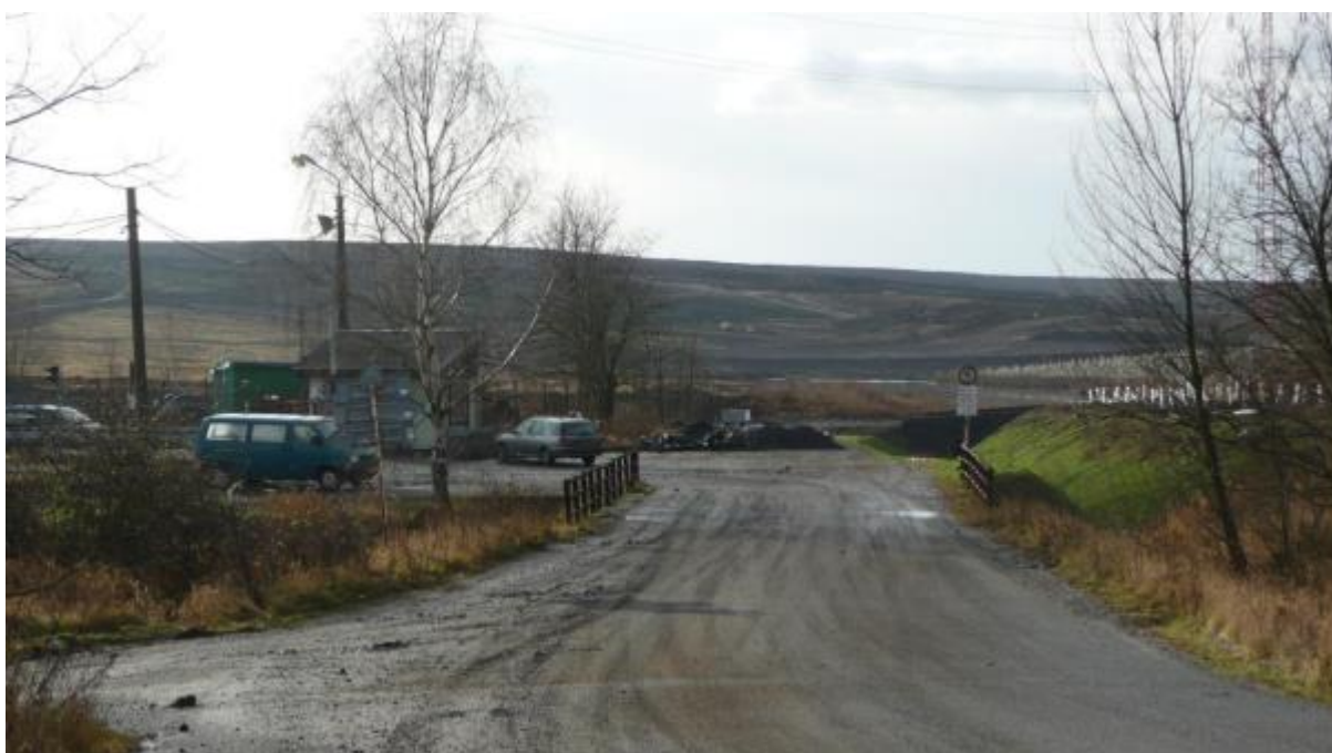
Obr. 4 Výsypka na Hrdlovce, rok 2010