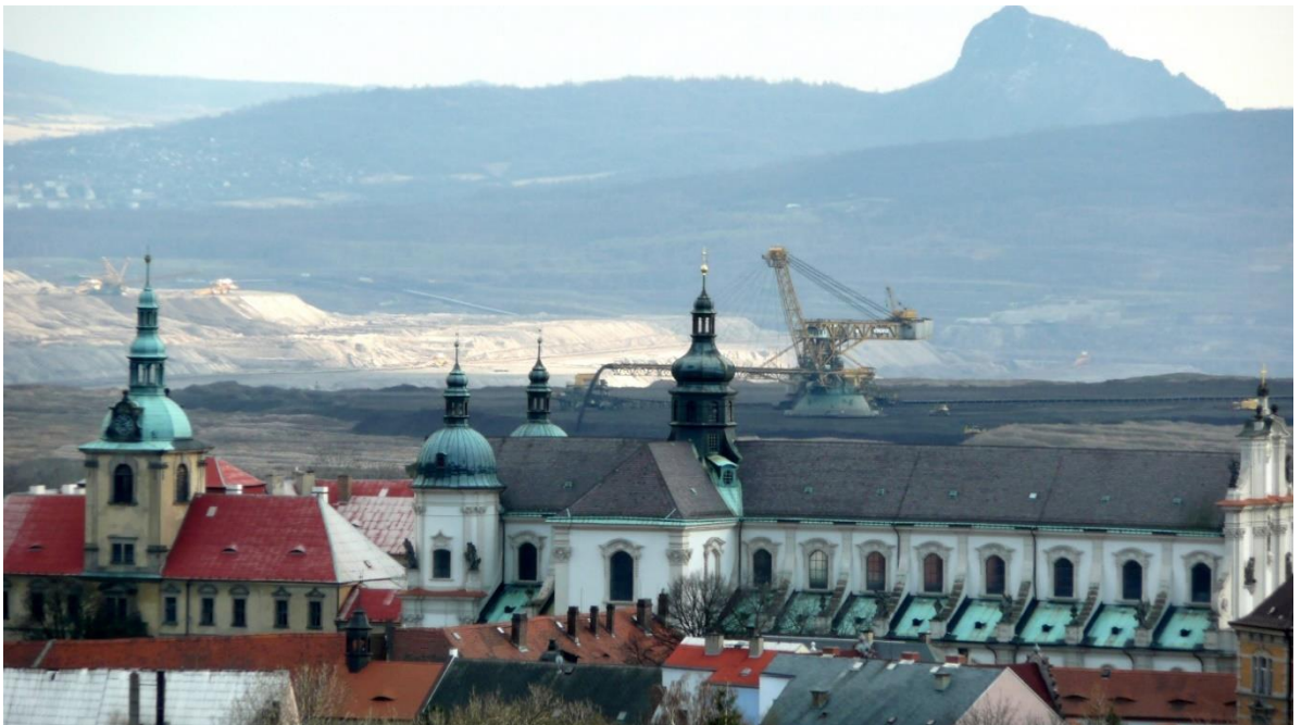
Obr. 10 Osecký klášter se zakladačem na místě, kde stála Hrdlovka