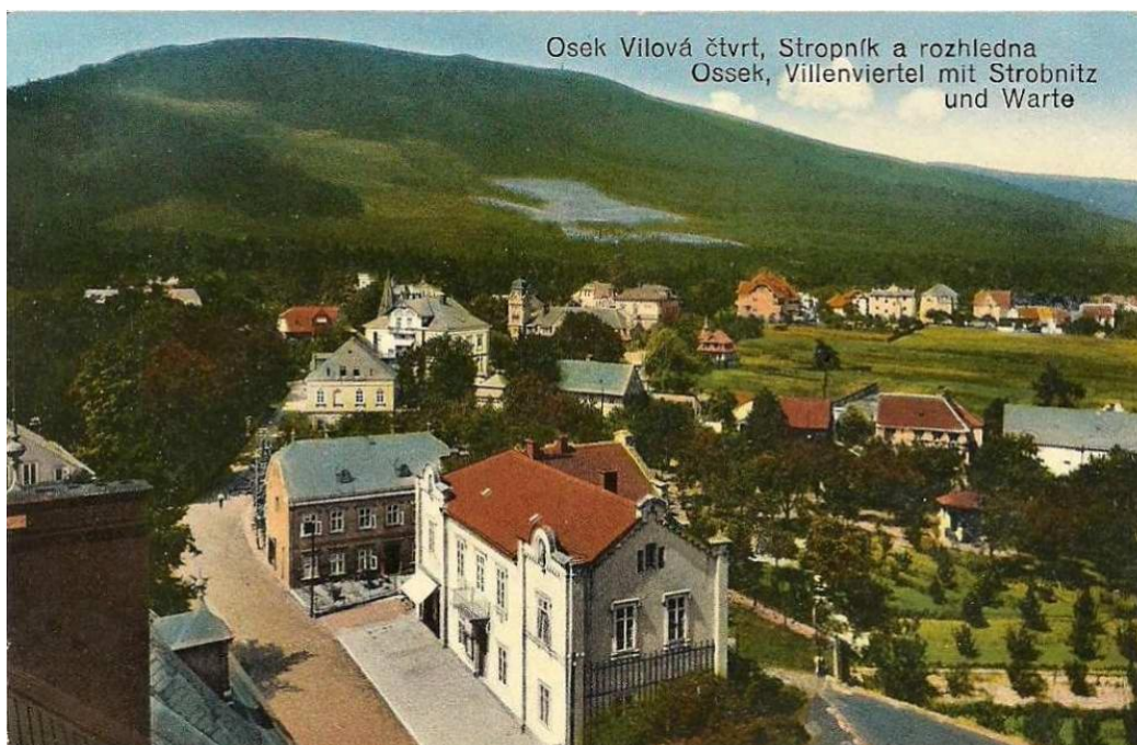
Obr. 6 Osek bez panelového sídliště