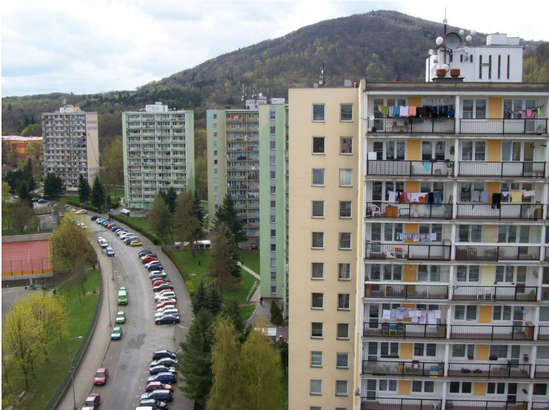
Obr. 9 Pohled z jednoho z panelových domů