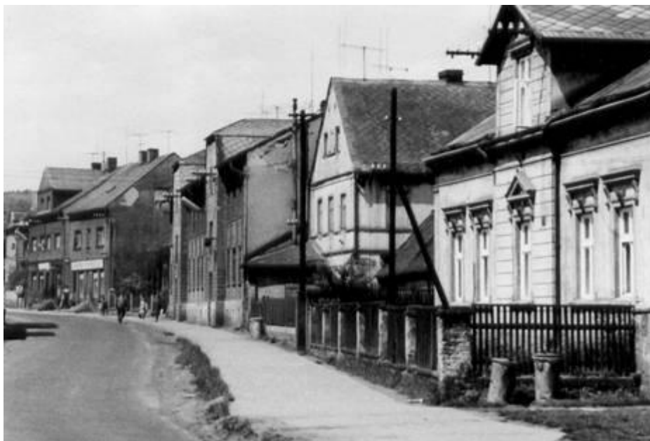
Obr. 1 Duchcovská ulice