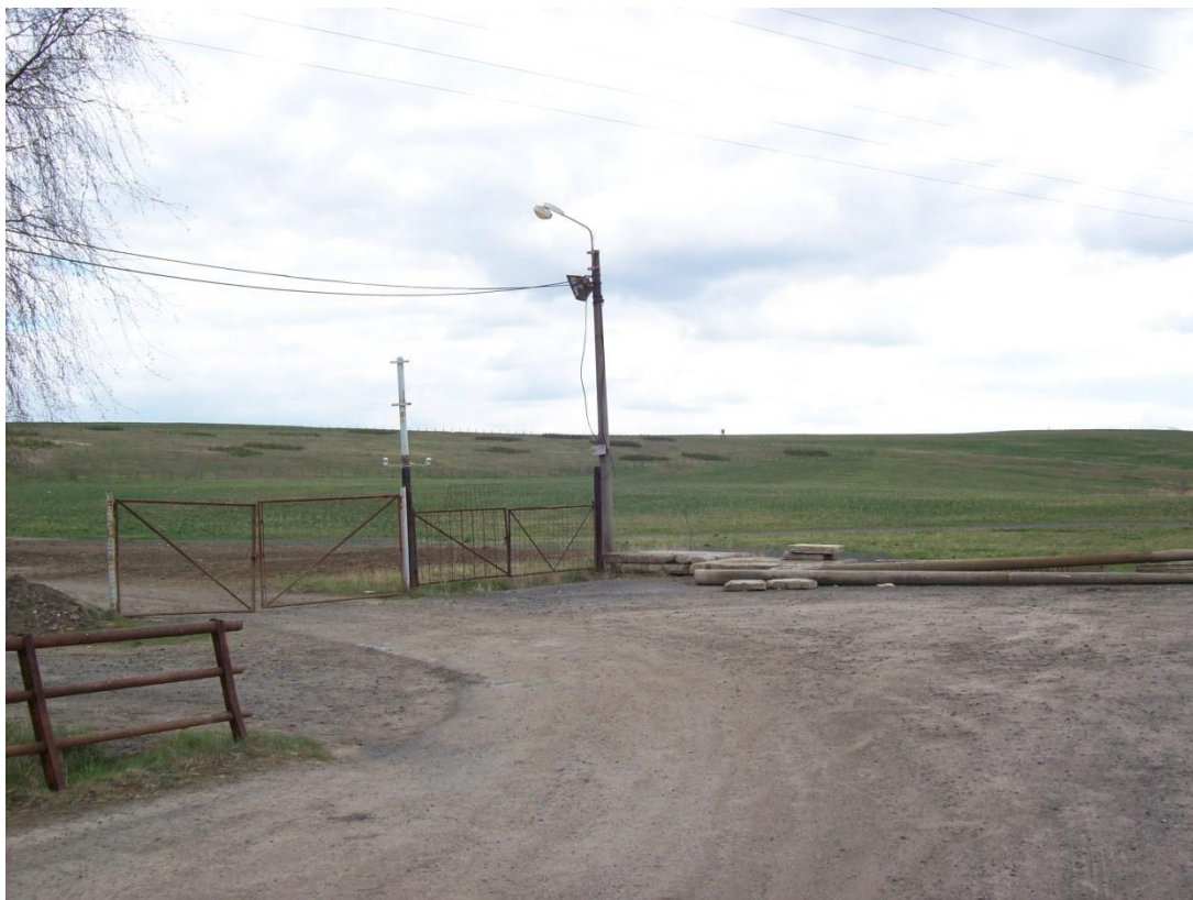
Obr. 5 Rekultivace na Hrdlovce, rok 2015