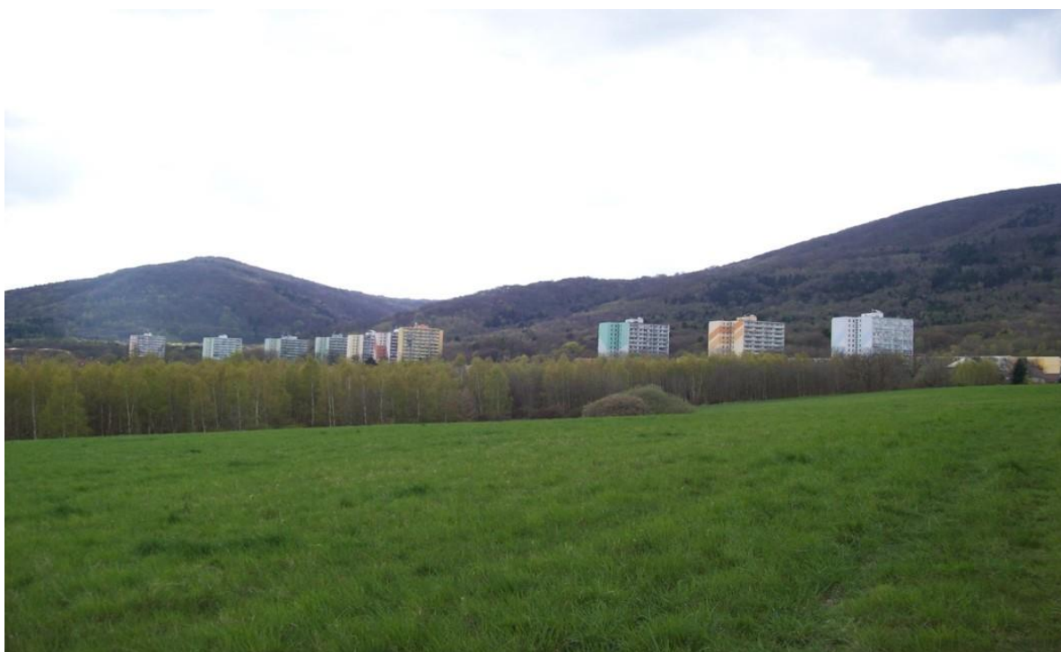
Obr. 8 Panelové sídliště dnes