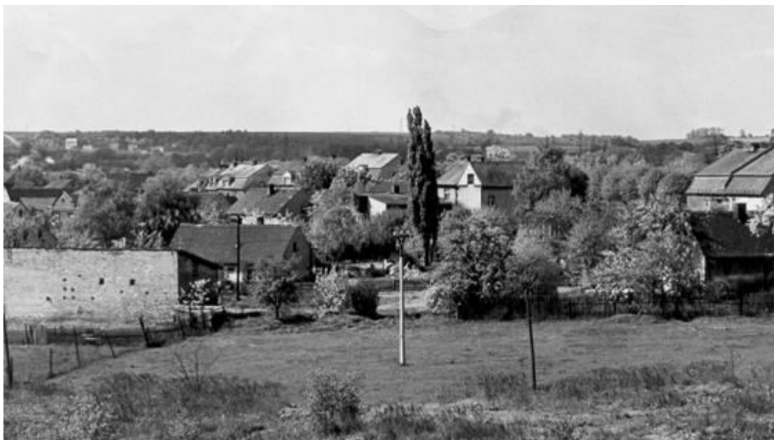
Obr. 3 Hrdlovka z dále