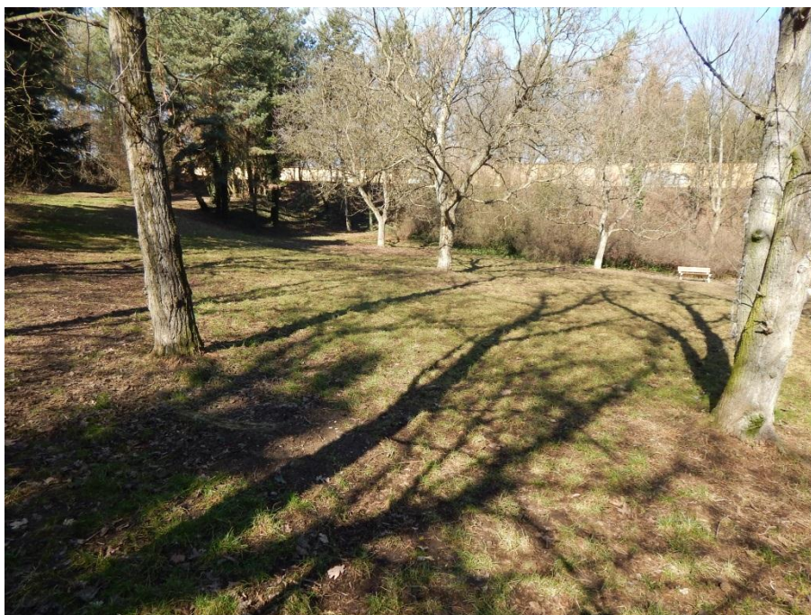
Obr. č. 1 Lesopark Radlice

Pro práci jsem si vybrala konkrétní prostor v místě svého bydliště na Praze 5. Tím je lesík v Radlicích (viz obr. č. 1, str. 12), nacházející se mezi hřbitovem Malvazinky a stanicí metra Radlická. Zvolila jsem jej proto, že mě oslovil svou divokostí a rozmanitostí. Vedle sebe zde stojí jehličnany spolu s listnatými stromy a po zemi se rozprostírá břečťan. V některých částech parku se zdá, jakoby člověk ani nebyl v Praze, ale v lese kdesi za městem. Je to dostupný kout čistě přírody, uměle neupravený, přirozený a klidný. Narazila jsem na něj náhodně při venčení psa a na první pohled mě uchvátil. Do lesoparku se dá vstoupit ze čtyř různých stran, jedna z nich vede z ulice, ve které jsou domy skrývající tento prostor. Ten je díky tomu intimní a skrytý, ale i veřejný a zároveň přece utajený. Navštěvují jej převážně majitelé psů, kteří se zde zastavují na „kus řeči“, zatímco jejich čtyřnozí miláčci vykonávají potřebu. Lesopark tak plní funkci společenskou, ekologickou a estetickou, je místem pro trávení času, kde si kluci kopou hakisakem, mladí pokušují a milenci se k sobě tisknou na lavičce. Do tohoto prostoru jsem chtěla vstoupit a zkoumat jej z různých hledisek.