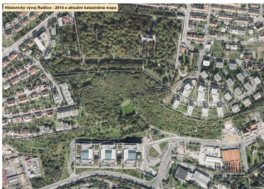
Obr. č. 3 Letecký snímek z roku 2014 s vyznačením k. ú.

Podoba Lesoparku se nejvýrazněji proměnila mezi lety 1842 a 1975, kdy se z orného pole stal postupně ovocný sad. Hřbitov Malvazinky, který s parkem sousedí, byl založen roku 1876, do té doby se zde nacházela rozlehlá pole, zatím neoddělená hřbitovní zdí. Podoba lesoparku se od roku 1988 příliš neměnila, podle leteckých fotografií se zdá, že prostor byl zalesněn stále stejně, nedošlo ani k žádnému kácení, ani výrazným úpravám. V roce 2003 odkoupilo část pozemku ČSOB. Je až s podivem, že se usedlost zachovala na pozemku lesoparku přibližně až do roku 2007.