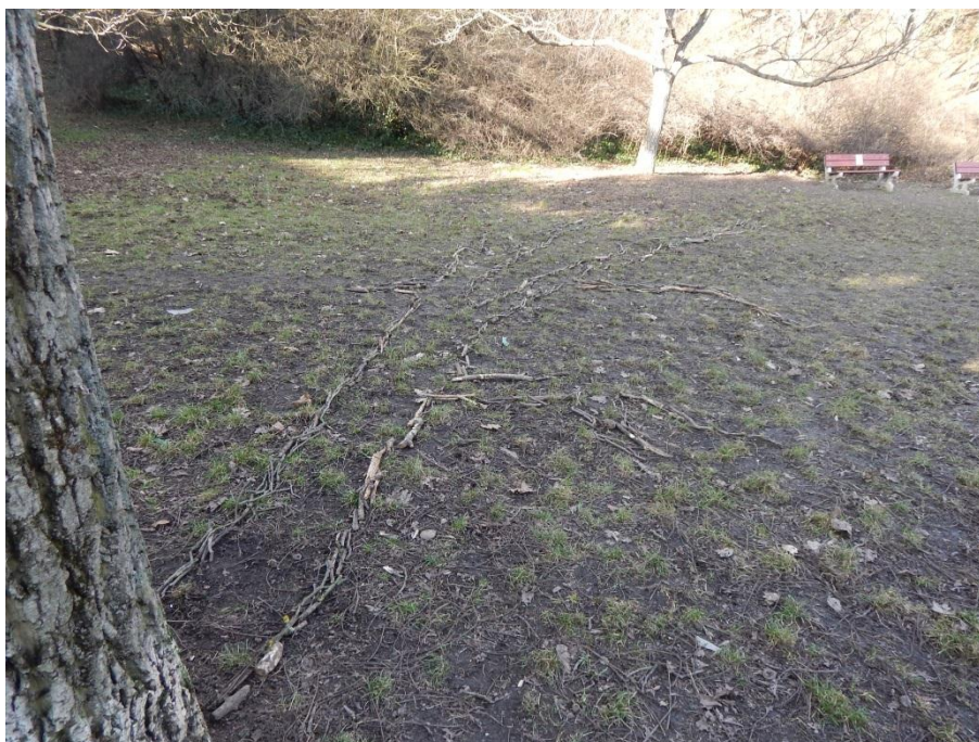
Obr. č. 4 Linie stínu po 15:00 hod.

ohraničování stínu jsem nemohla vždy posouvat všechny větvičky podle toho, jak se stín v posledních několika minutách proměnil, ale snažila jsem se nový obrys napojit na předchozí pozici. Vznikal tak obrys stínu, který se proměňuje v čase a putuje podle polohy slunce. Silueta zobrazovala na zemi původní stín a tento obrys se křížil s aktuálním stínem, který ustupoval jeho záznamu (viz příloha č. 2 – 1). Tvorba obrysu stínu mi trvala asi hodinu a půl, cca od 11:30 do 13:00, stín jsem přestala zaznamenávat, když se proměnil natolik, že bych nové větvičky musela příliš napojovat na novou polohu stínu a obrys tak deformovat. Stín ustoupil od siluety za dobu, kdy jsem byla opět nucena jít pro materiál až téměř na opačný konec louky. Průběh práce jsem po celou dobu fotografovala a nakonec pořídila i video záznam. Asi o dvě hodiny později jsem se na místo vrátila a obrys stínu jsem shledala neponičeným. Světlo se kolem 15:00 hodin změnilo tak, že louka byla z velké části ve stínu, který na ní vrhaly domy z ulice. Na zemi byl tedy vytyčen pouze odraz původního stínu, jež byl lemován větvičkami (viz obr. č. 4, str. 23). Efekt siluety fungoval i v tuto chvíli, kdy jej nenarušoval změněný ustupující stín. Zůstal zde pouze dekorativní obrys připomínající strom samotný. Tato linie vedla od kmene stromu a její nejvzdálenější konce se nacházely asi 10 metrů od stromu samotného.