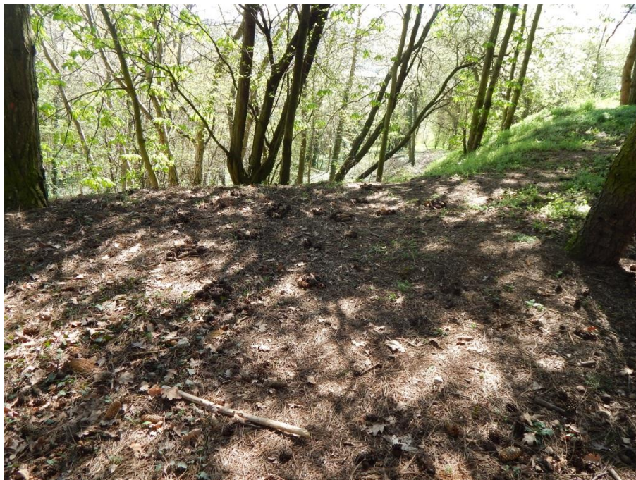
Obr. č. 6 Světelná krajka

Seskupení šišek na jehličnatém podkladu však příliš nevyznělo. Jejich materiál utlumil a jaksi pohltit dopadající světlo, slunce také stihlo změnit svou polohu, tudíž se stín i světlo posunuly (viz příloha č. 2 – 3). Hromádky šišek v prostoru působily spíše intimně a minimalisticky, a zanikaly mezi suchými listy spadány z stromů (viz obr. č. 6, str. 27).