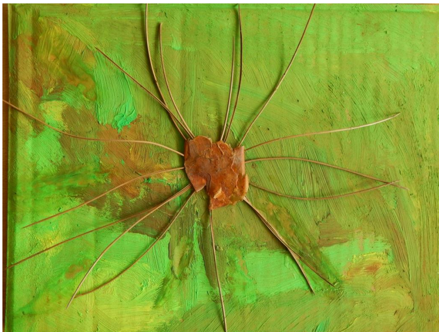
Obr. č. 8 Koláž z přírodnin