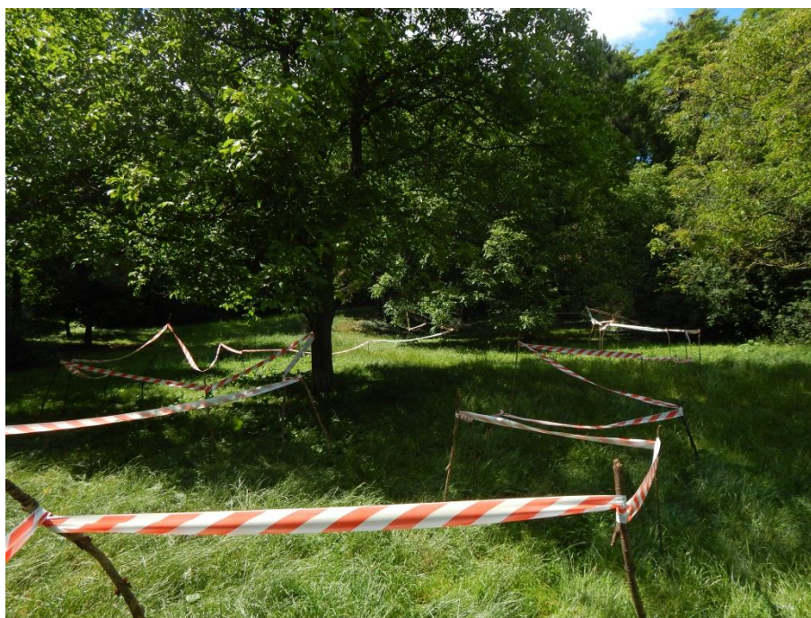
Obr. č. 7 Kolíkování – linie tří stromů

přispívat tak ke znečišťování prostředí. Byla jsem již před začátkem práce rozhodnutá akci realizovat, zdokumentovat a následně sklídit a odstranit. Podobně jako se po skončení různých akcí sbalí vybavení, stánky a podium, prostor se vyklidí a organizátoři odjedou. Náhodní kolemjdoucí se během práce dotazovali, „co se zde děje?“ nebo zda tudy mohou projít, když je prostor ohrazený. Jedna starší paní se psem si se mnou chvíli povídala a řekla mi, že park navštěvuje blízká mateřská školka a že sem děti chodí cvičit, a také že se v tomto místě dříve nacházelo volejbalové hřiště. Jiná paní se ptala „co se tady bude dít?“ ve chvíli, kdy jsem již odnášela demontované klacky a vše, co proběhlo, bylo již skončené. K vymezení stínu kolíky bylo zapotřebí 57 klacků, celý páskou ohrazený prostor jsem obešla 88 dlouhými kroky. Použitou pásku jsem následně přeměřila, a k práci bylo použito 106,40 m.