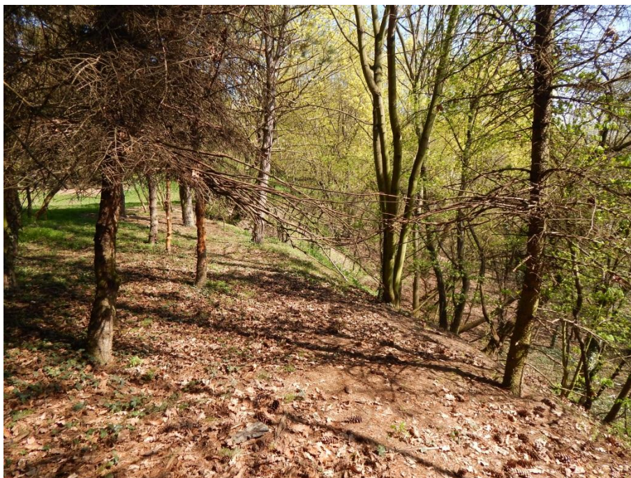
Obr. č. 5 Dotyk

Propojením větví jsem chtěla docílit i vrhnutí stínu, který by tak potvrdil vztah těchto stromů. Větvičky však byly tak tenké, že se stín na zemi neprojevil. Také z důvodu polohy slunce byl stín tak vzdálen od stromů, že se na zemi sloučil se stíny jinými. Pouto, které tak mezi stromy vzniklo, bylo křehkým důkazem jejich partnerství.