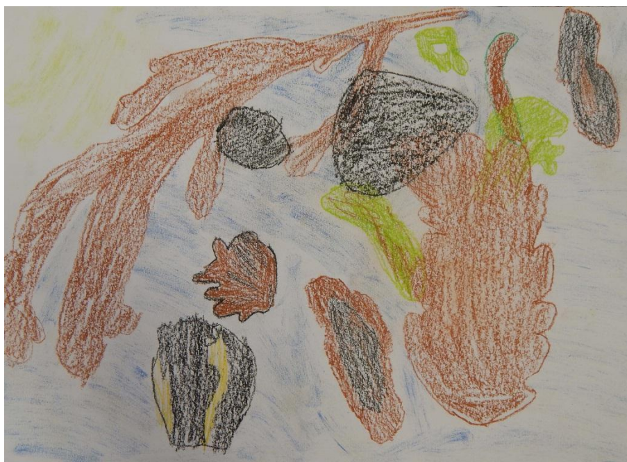
Obr. č. 9 Zachycení stínu

určitá větvička nebo šiška k dispozici. Zkoumání stínu a jeho proměn, které mělo být cílem práce, se žáci příliš nevěnovali, zaměřili se na tvary samotných přírodnin. Vydrželi se soustředit několik desítek minut, poté se chtěli věnovat kresbě motivů dle vlastního výběru. Celkově práci nevěnovali dostatek pozornosti a trpělivosti, po několika zkouškách ztratili zájem o dané téma. Úroveň výstupů se lišila, převážně bych je však označila za nepodařené a postrádající efekt. Smysl, který činnost měla mít, se neprojevil, žáci si sice uvědomovali, že všechno fyzicky hmotné vrhá stín, ale nejevili zájem o jeho zkoumání. Domnívám se, že námět nebyl přiměřený věku dětí. Bylo by třeba téma zjednodušit do podoby, která bude pro žáky pochopitelná a smysluplná. Koncept jako takový byl do jisté míry nosný, ale pro žáky 1. a 2. třídy byl v této formě příliš komplikovaný. Proto bych tuto výtvarnou činnost příště zamýšlela spíše pro 2. stupeň základní školy.