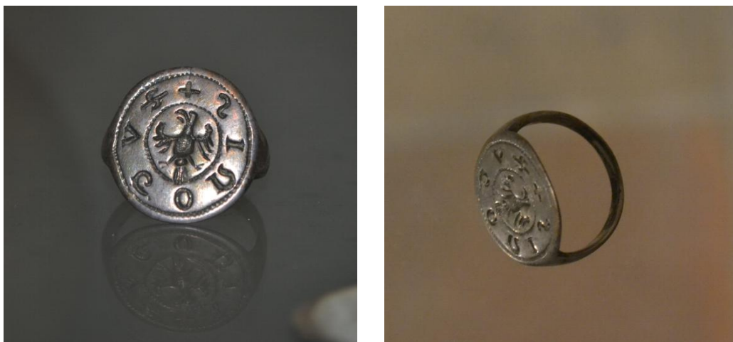
Obr. 2. a 3. pečetní prsten z depotu Vrátno se jménem nositele, foceno ve vitrině

kromě zmiňovaného bronzového pečetidla části textilií, papíru, kovových přezek a ozdobných knoflíků. Vzhledem k těmto faktorům a ve světle archeologického kontextu můžeme jméno Meir, syn Kopelův (uvedené na pečetidle) vyslovit s daleko větší, téměř stoprocentní jistotou. Tento a mnoho dalších srovnatelných příkladů, podtrhuje důležitost kritického přístupu k jednotlivým nálezům depotů.