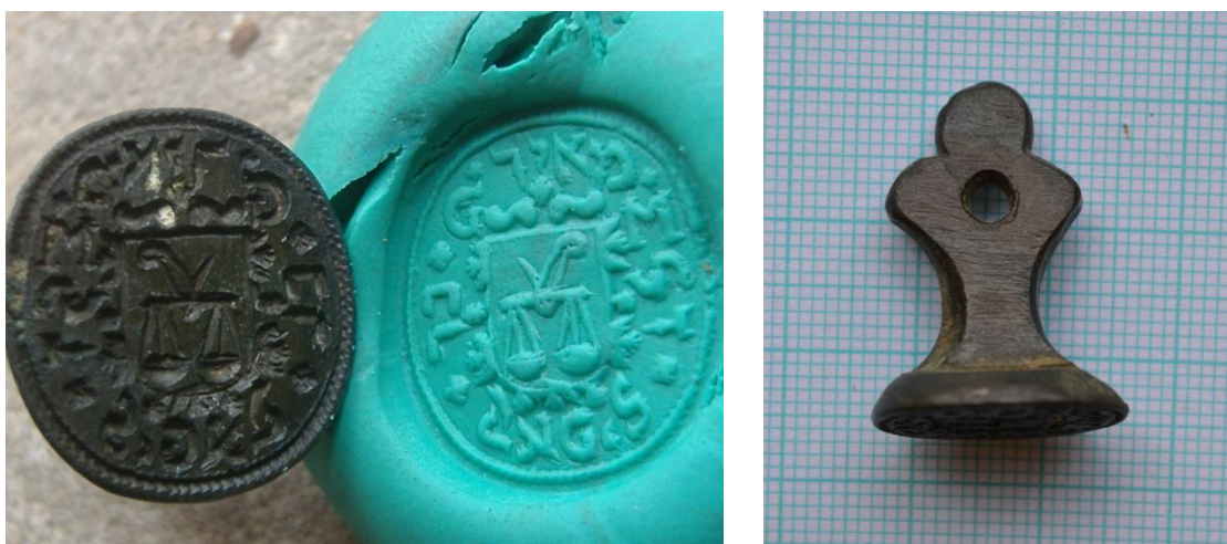
Obr. 4. a 5. pečetidlo z depotu Čejetice 2 se jménem v opise.

Počet objevených depotů na území České Republiky stoupá s počtem aktivních uživatelů detektorů kovů. Je však otázkou, kde a za jakých okolností tyto (nejen mincovní) depoty skončí. Situace ohledně využívání detektorů kovů amatérskými hledači je jednoznačně lepší, než tomu bylo v minulosti ( Militký 2005, 48 ). Počet registrovaných