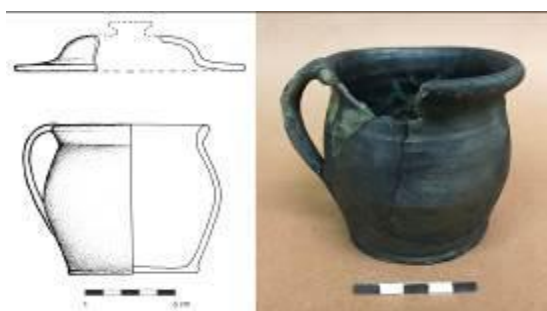
Obr. 5. Keramická nádoba po rekonstrukci (kresba T. Kolegar; dle Thomová - Bumerl 2016).

analýzy (Thomová – Bumerl 2006, 12). Výplň nádoby obsahovala krom mincí i pestrá směs organického materiálu: rostlinné makrozbytky, uhlíky, dřevo, hmyz a kosti. Získaný soubor makrozbytků z vnitřku nádoby byl interpretován jako nadrcená sláma, ta mohla být umístěna v nádobě ve funkci izolace a ochrany proti stavební suti, kterou byla nádobka zasypána. Pylové analýzy napovídají, že depot byl pravděpodobně uložen ve stejné době, kdy vznikala v interiéru kostela nová podlaha. Pro srovnání byly odebrány a prozkoumány rovněž vzorky z nejbližšího okolí. Bio - archeologická analýza rovněž částečně odráží zemědělské prostředí Bošilce v 17. století (Bezděk – Houfková – Kovačiková – Šálková 2016, 18 -25).