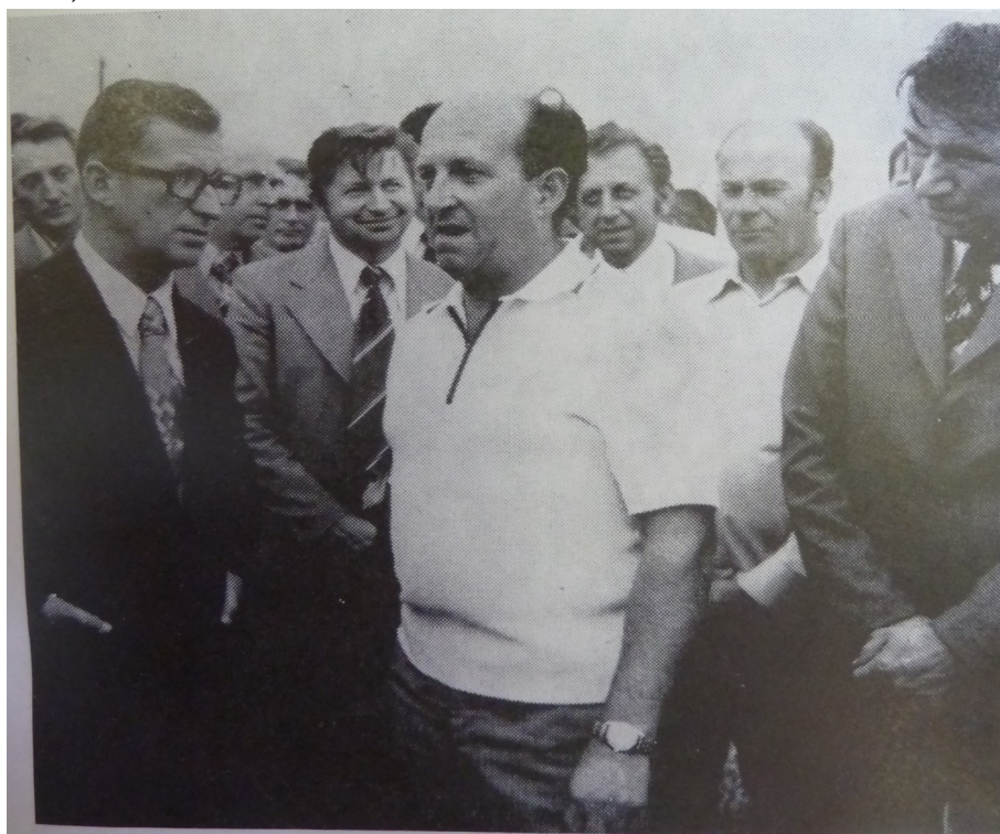
O žních v roce 1977 přijel mezi družstevníky v JZD Mír v Chelčicích, člen PÚV KSČ a předseda federální vlády Lubomír Štrougal.